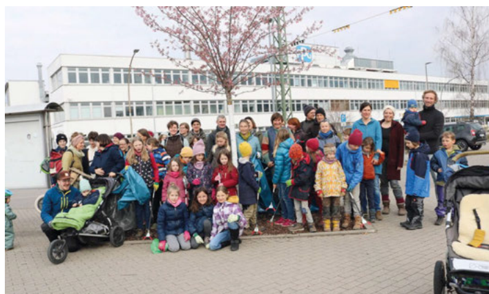
Im letzten Jahr fanden sich viele "Wastebusters" zum Müllsammeln ein.

Wir freuen uns auf eine gemeinsame, spaßige Aktion wie im letzten Jahr. Treffpunkt ist am Sonntag, den 12.3.2022 um 10 Uhr am Bauhof Weingarten. Von dort aus gehen wir verschiedene Routen. Bitte Handschuhe mitbringen und gerne auch Geschirr und Besteck. Zum Abschluss laden wir zum gemeinsamen Essen auf dem Gelände des Kleintierzuchtvereins ein. Fragen gerne per Mail an info@flurkultur.org .