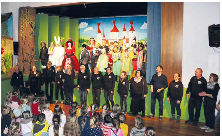
Eine rundum gelungene Aufführung: Schauspielende und Helfende beim Singen der Abschlusshymne