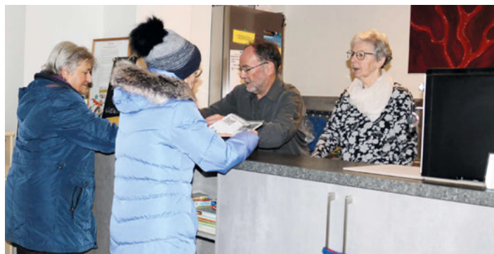
Verkauf von Fahrkarten mit Beratung in der Bahnhofstraße 3