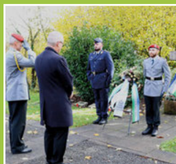
Volkstrauertag Seite 4

Wann: Samstag, den 02.12.2023 Von: 13.00 – 20:00 Uhr Wo: Kirchstraße Weingarten