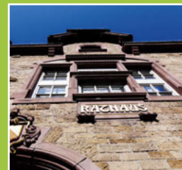
Aus den Sitzungen des Gemeinderates Seite 6-9