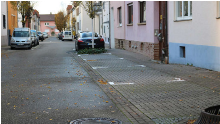
Foto: In der Gartenstraße wurden die Markierungen bereits umgesetzt