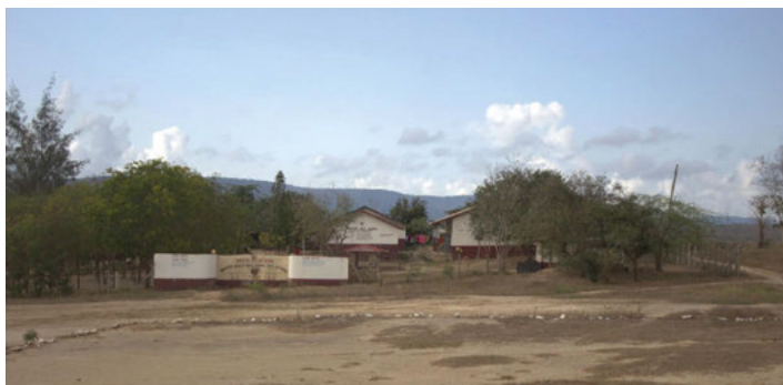
Schule und Gemeindezentrum in einem abgelegenen Dorf. Um die Familien dort zu erreichen, brauchen die Sozialarbeiter von DZARINO CBO ein geländegängiges Auto.