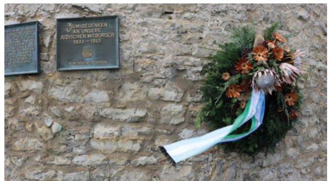
Kranz für die jüdischen Mitbürger