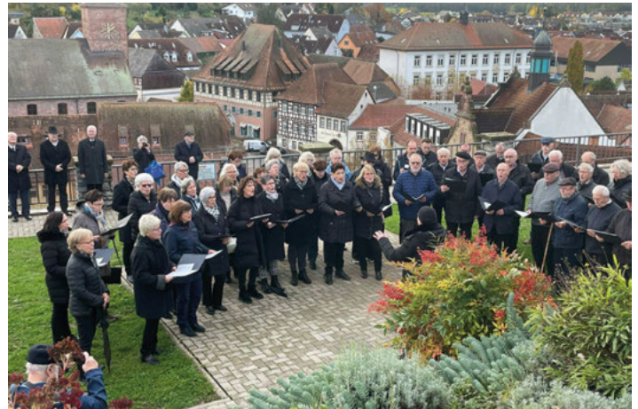
Liedvortrag am Wartturm

Gesangverein Liederkranz www.liederkranz-weingarten.de