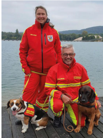
Das erfolgreiche Weingartener Team

Die Wasserortungshunde der DLRG OG Weingarten haben erfolgreich an der Prüfung teilgenommen. Diese fand am vergangenen Wochenende am Baggersee Weingarten statt. Geprüft wurden die angehenden Wasserortungshunde aus Wertheim, Weinheim und Weingarten. Es waren 9 Wasserortungshunde-Teams zur Prüfung angemeldet. Es wurden zwei Bereiche mit 4.000 qm mit Bojen markiert. In diesem Bereich mussten die Prüflinge einen Geruchsträger in einem Radius vom 50 m lokalisieren. Von den 9 zur Prüfung angetretenen Wasserortungshunde-Teams haben 7 Teams bestanden.