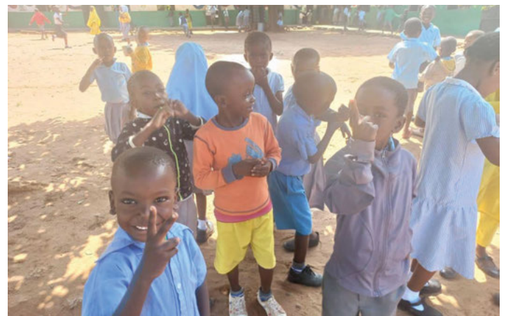
Wir möchten noch mehr Kindern ermöglichen, so fröhlich zu sein, weil sie in die Schule gehen können.

Spendenkonto: DE47 6729 2200 0031 8863 05