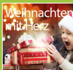
Weihnachten mit Herz Seite 5