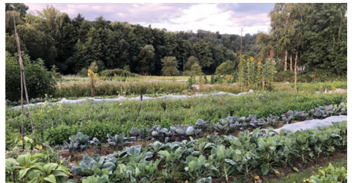
Ganzjährig frisches Gemüse. Durch abwechslungsreichen Anbau gibt es das ganze Jahr über frisches Gemüse.

Gesund, lecker, frisch und nachhaltig- mach mit bei GUTES GEMÜSE und komm übermorgen zur Biiterrunde!