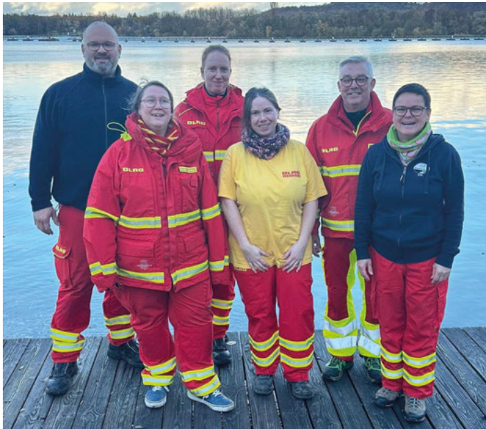
WO Weinheim und Weingarten mit Prüfer und dem Bezirksvorsitzendem