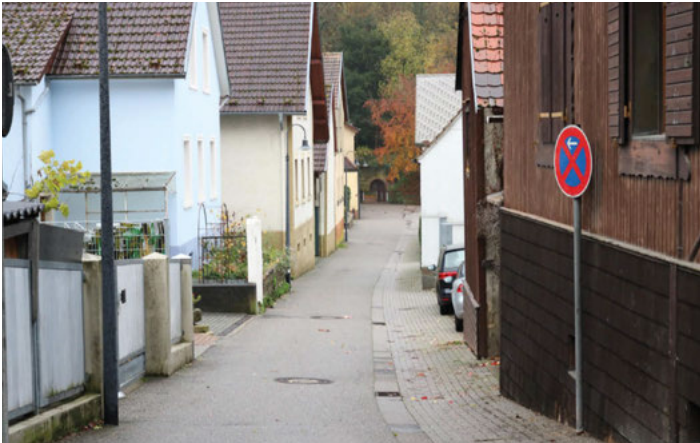
Foto: Die Blumenstraße ist ebenfalls im Sanierungsprogramm enthalten

Noch ausstehend sind die Sanierung der Hebelstraße, der Engelstraße, der Blumenstraße, der Schafstraße, der Mühlstraße und der Brunnenstraße. An privaten Maßnahmen wurden bereits 18 Modernisierungen vorgenommen.