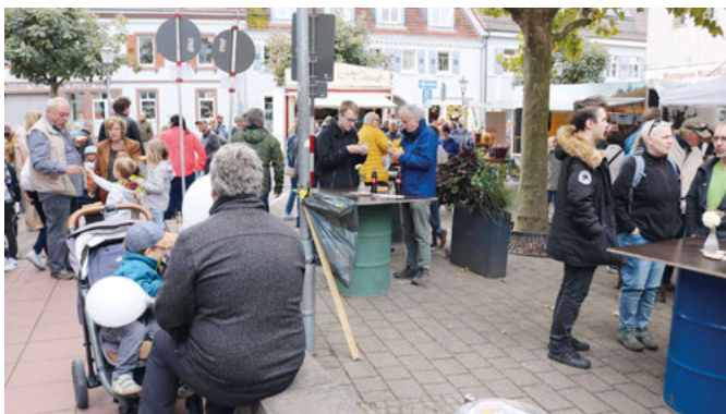
Besucher am Weinstand

Das Lichtschießen des Schützenvereins stieß ebenso auf Interesse, wie das Literaturangebot des Bürger- und Heimatvereins. Ein musikalischer Flashmob des Gesangvereins Liederkranz war ein Stimmungsmacher und das DLRG sowie das Rote Kreuz nutzten ihre Infostände zur Mitgliederwerbung.