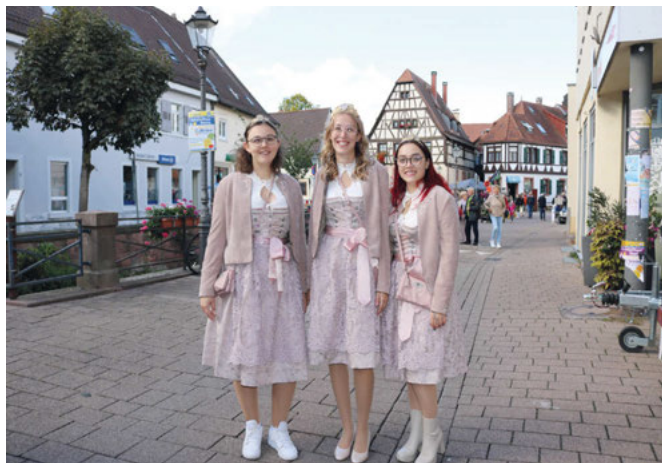
Die Weinhoheiten Leoni, Leoni I. & Celia.

Das Träuble durfte natürlich nicht fehlen und auch die Weinhoheiten waren hier und dort anzutreffen. Es war ein runder, abwechslungsreicher Nachmittag für alle.