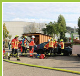
Wehrhauptübung der Feuerwehr Seite 4