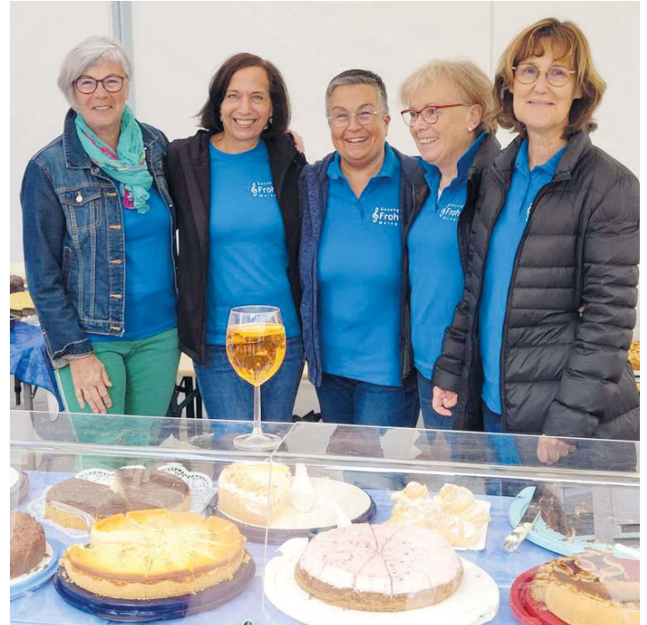
Frohsinn Weingarten beim verkaufsoffenen Sonntag

Folgt uns auf Instagram @Frohsinn-Weingarten und auf facebook Frohsinn Weingarten