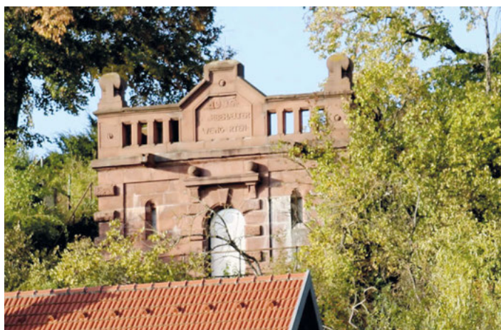
Der historische Wasserhochbehälter aus dem Jahr 1906

erbaut 1906, äußerlich in schlechtem Zustand sei. Es sollte unbedingt erhalten bleiben. Die Abstimmung ergab ein eindeutiges Bild: Der Verwaltungsausschuss empfiehlt einstimmig dem Gemeinderat, der Sparkassenstiftung Karlsruhe die Verwendung der Erträge für die Sanierung der Inschrift am alten Wasserhochbehälter vorzuschlagen. Der zweite Vorschlag solle, falls Geldmittel übrig seien, zu einem späteren Zeitpunkt realisiert werden.