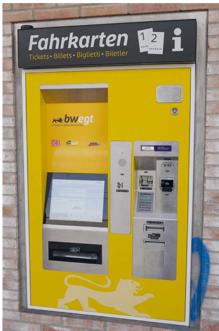
Die neue Automaten generation im Netz der AVG bietet neben einer freundlichen Optik auch eine verbesserte Funktionalität