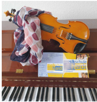
Klavier oder Geige? Hauptsache Musik!