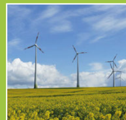
Einladung Podiums- diskussion Seite 7