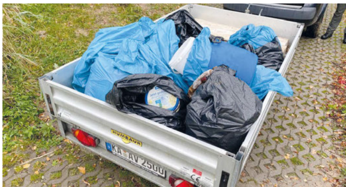
Gesammelter Müll Seeputzete 2023

Seit Jahrzehnten bemüht sich der Anglerverein darum, unser aller Naherholungs- und Naturschutzgebiet zu erhalten und weiter zu entwickeln. Auch deshalb gibt es mindestens einmal im Jahr eine Seeputzete. Die Vorstandschaft dankt allen Helfern.