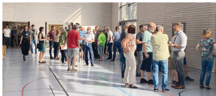
Foto eines Info-Markts in Kupferzell mit Unterstützung des Forum Energiedialog am 20.07.2022

Alle Bürgerinnen und Bürger aus Weingarten und Walzbachtal sind herzlich eingeladen sich an den beiden Veranstaltungen zu informieren und zu beteiligen.