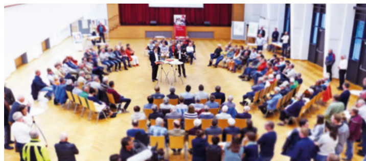
Foto einer Podiumsdiskussion in Bräunlingen mit Unterstützung des Forum Energiedialog am 23.09.2018