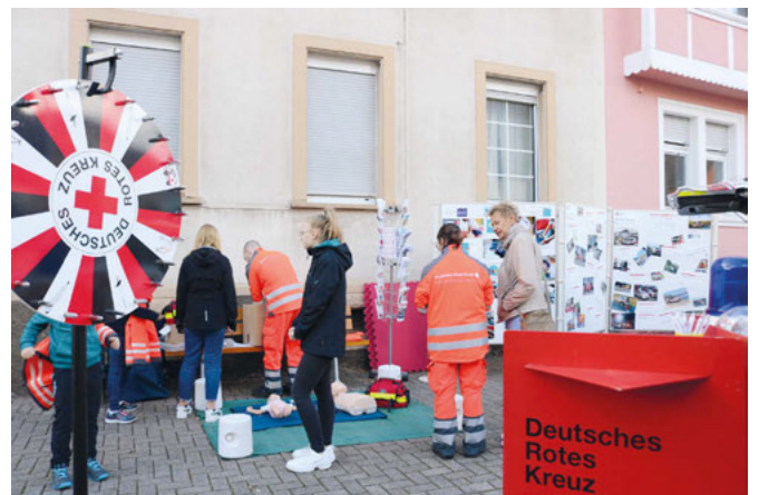
Besucher am Info-Stand des DRK

Ein optisches Highlight war die viel beachtete Brautmodenschau auf dem Rathausplatz. Die Treppen wurden zum Laufsteg und neun Models präsentierten die schönsten Modelle von Anja Katharina Brautmode. Begleitet von der schönen Stimme der Hochzeitssängerin Tanja Belle entstand ein kleines Event, das viele Besucher anlockte.