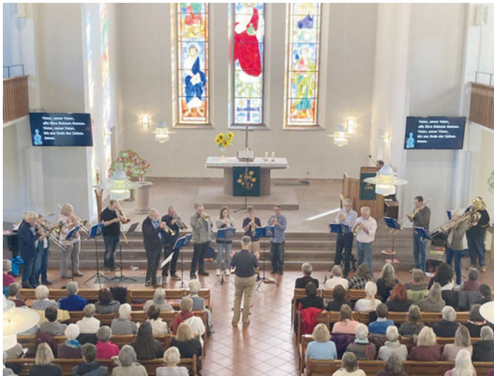
Der Posaunenchor eröffnet das Chorfest zu "Mein Lebenslied"