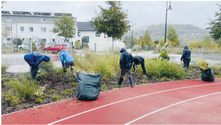
Arbeitseinsatz beim TSV