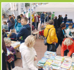
Verkaufsoffener Sonntag Seite 3-4

zur Einweihung des ersten kommunalen Kindergartens Bullerbü am 21.10.2023 von 12-15 Uhr im Buchenweg 40 - feiern Sie mit.