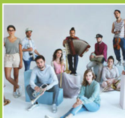
Weingartner Musiktage Seite 3