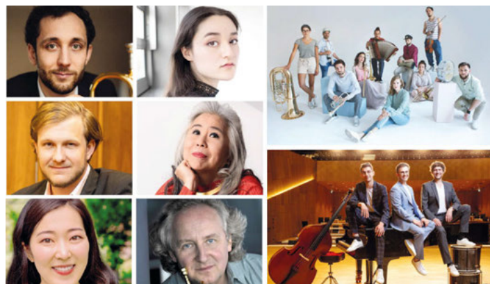
„Die Vielfalt der Klänge“ präsentieren ab Freitag die Künstler des ersten Festival-Wochenendes der Weingartner Musiktage.

Karten: Buchhandlung Wolf, Musikhaus Schlaile, Reservix-Verkaufsstellen, und über www.weingartner-musiktage.de/tickets .