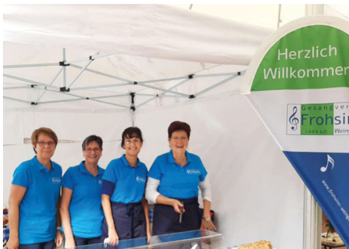
Archivfoto: GV Frohsinn wieder beim verkaufsoffenen Sonntag auf dem Rathausplatz