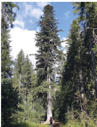
Die Großvatertanne bei Freudenstadt

Welch beeindruckende Naturbauwerke, die in über 300 Jahren in luftige Höhe gewachsen sind wie die „Großvatertanne“. Sie hat einen Stammdurchmesser in Brusthöhe von 1,55m und ist mit 47m die größte Tanne im Schwarzwald. Welche Geschichten könnte sie wohl erzählen, wenn sie sprechen könnte?