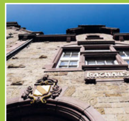
Einladungen den Ausschuss- Sitzungen Seite 4