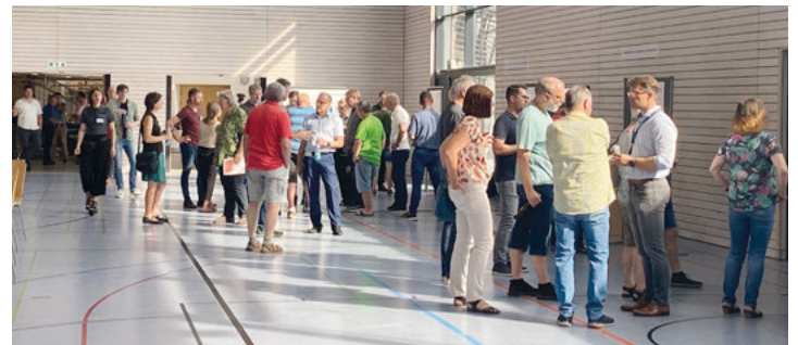
Foto eines Info-Markts in Kupferzell mit Unterstützung des Forum Energiedialog am 20.07.2022

Alle Bürgerinnen und Bürger aus Weingarten und Walzbachtal sind herzlich eingeladen sich an den beiden Veranstaltungen zu informieren und zu beteiligen.