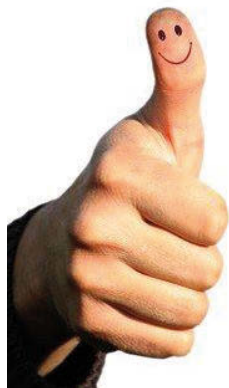
Einfach Spitze! Die MSH!

Sie können auch einen Schnupperkurs buchen, um zu testen, welches Instrument am besten zu Ihnen oder Ihrem Kind passt. Fragen Sie uns, wir beraten Sie gerne! Tel. 07249-1859. Mail: sekretariat@musikschule-hardt.de. Allgemeine Informationen und die Gebührenordnung finden Sie unter: www.musikschule-hardt.de .