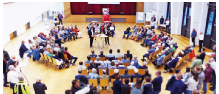
Foto einer Podiumsdiskussion in Bräunlingen mit Unterstützung des Forum Energiedialog am 23.09.2018