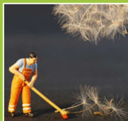
Gemarkungs- putzete Seite 6