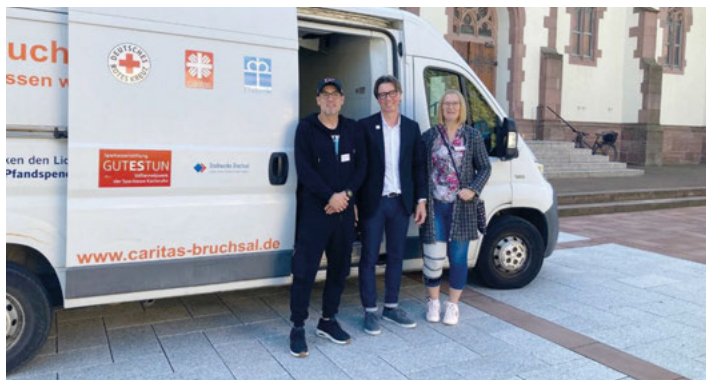
Mitarbeitende im Caritasverband Bruchsal