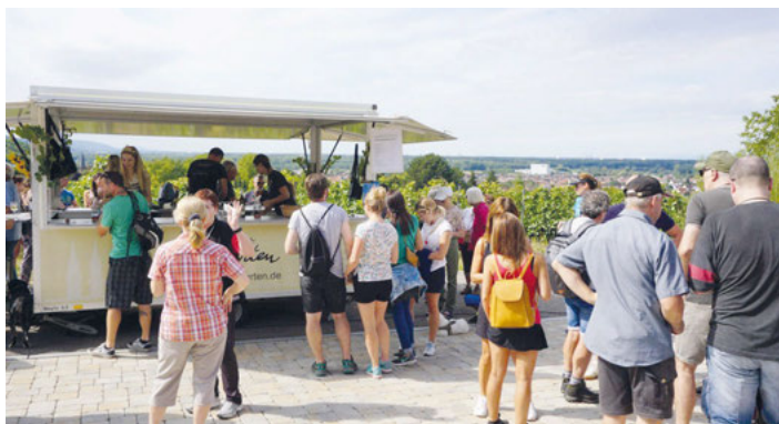
Weinprobierstand am Katzenberg

Alle Informationen über den Musikverein, die Orchester und Veranstaltungen findet ihr immer aktuell unter www.musikverein-weingarten.de .