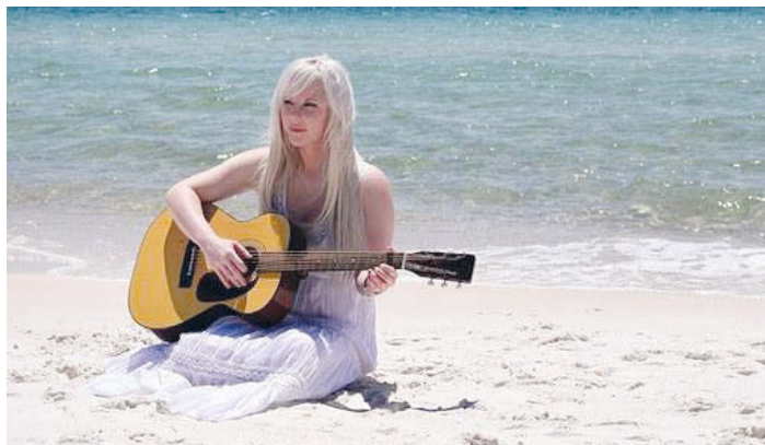
Auch in den Ferien...