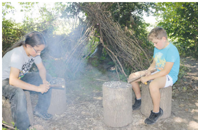
Schnitzen erfordert Konzentration und Geduld. Das Wichtigste ist die richtige Technik.