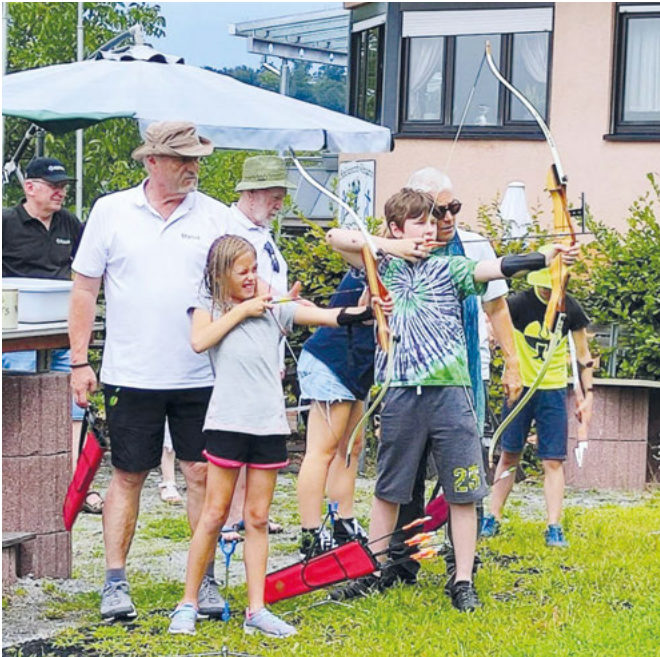
Konzentriert und unter Anleitung übten die Kids das Bogenschießen

ins Zentrum platzieren, was gar nicht so einfach war, wie manche feststellen mussten. Doch auch hier klappte es mit jedem Schuss besser und die Augen strahlten, wenn der Pfeil im „Gold“ stecken blieb.