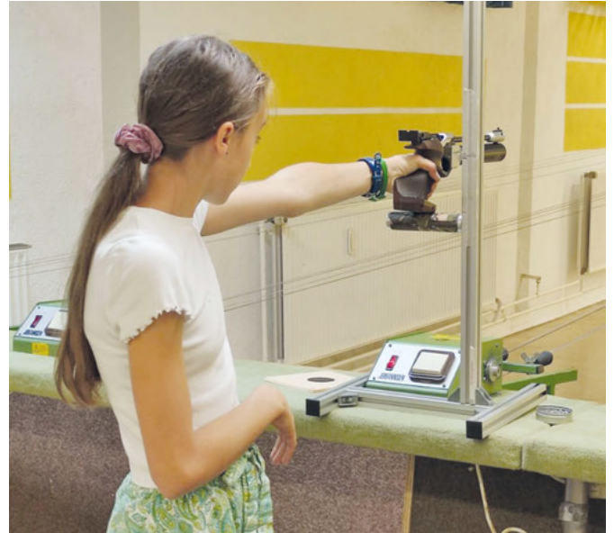
Auch in die Disziplin Luftpistolenschießen durften die Kids reinschnuppern.

Wenn euch dieser Tag gefallen hat, kommt doch zu einem Schnupperschießen zu den üblichen Trainingszeiten bei uns vorbei.