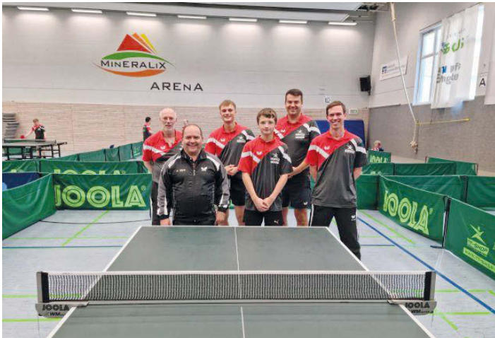
Die Meister der Kreisklasse A: die 3. Herrenmannschaft