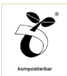
... bzw. das Keimlingsymbol.