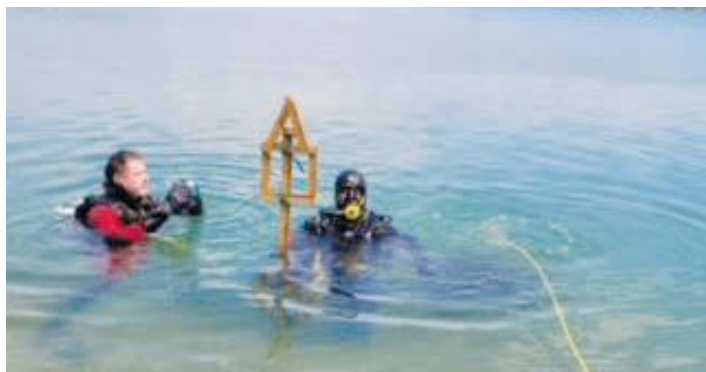
Das Haus ist fertig!