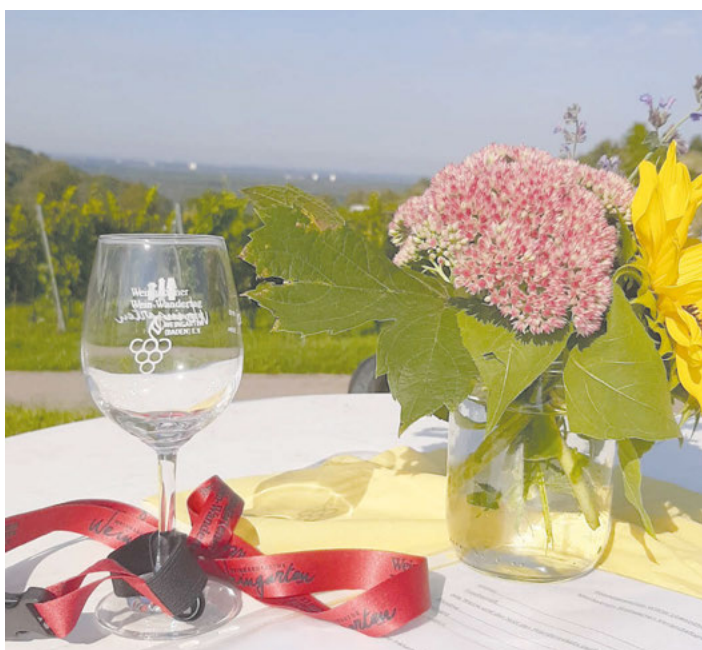
Mit einem Weinprobierglas und dem passenden Halter gut ausgestattet für den Weinwandertag

Gesangverein Liederkranz www.liederkranz-weingarten.de