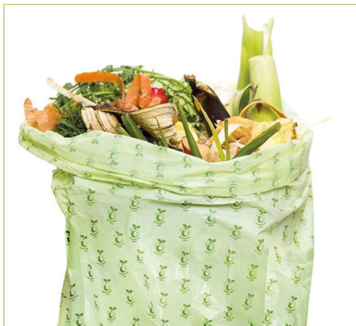
Biobeutel aus biologisch abbaubarem Kunststoff