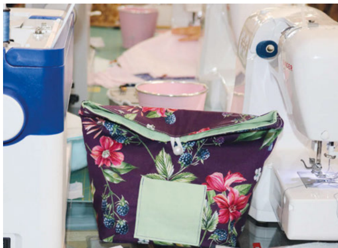
So sieht das fertige Produkt aus