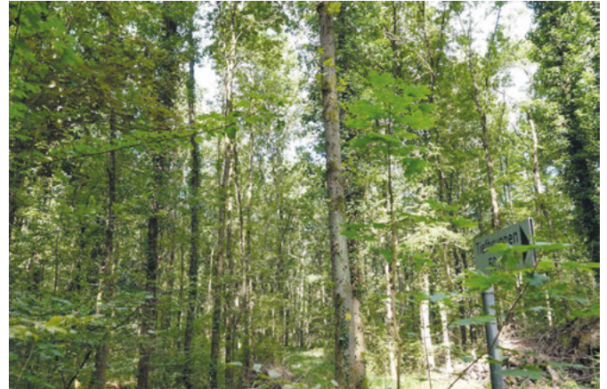
Ein Waldstück am Tiefbrunnen