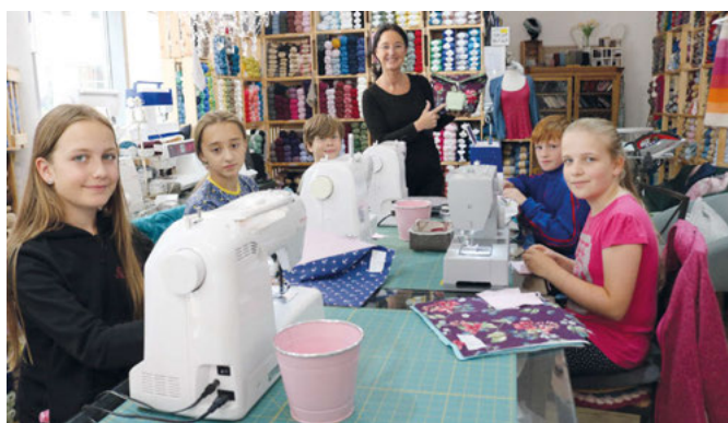
Fünf eifrige und motivierte Kinder beim Nähen eines Reisebeutels

Das Ergebnis ist ein hübscher und praktischer Beutel. Eine Schlaufe mit einem Knopf verschließt ihn und macht ihn vielseitig. Auf die Frage, wozu sie den Beutel benötige und was sie hineintun wolle, zuckt ein Mädchen nur mit den Schultern. Das werde ihr einfallen, wenn sie wieder in ihrem Zimmer sei, sagt sie. Gut vorstellbar. Beim Ferienspaß geht es natürlich um ein praktisches und brauchbares Ergebnis, aber nicht nur. Das Tun an sich macht Freude und weckt Stolz, etwas Tolles geschafft zu haben.