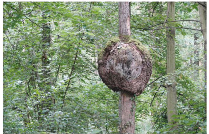
Seltenes Fundstück in der Größe: Eine Schwarzerle mit Krebswucherung

Doch erst einmal wird 50 Jahre gewartet, um verwertbares Holz zu erhalten. Im Vergleich benötigt eine Pappel, die zum Beispiel im Gebiet Dörnig zu finden ist, nur 1/3 der Wachstumszeit um als Stammholz verarbeitet zu werden. Auf Nachfrage erläuterte Herr Schmitt, dass pro Jahr im Gemeindewald 4.500 Festmeter Holz im Oktober/November zum Einschlag kommen - deutlich weniger als im Vergleich zu 2006, da waren es noch 7.000 Festmeter. Davon werden 400-500 Festmeter im Wald als Totholz für Flora und Fauna belassen. 1.000 Festmeter können als Stammholz vermarktet werden. 3.000 Festmeter sind mittlerweile Brennholz, wovon 1.000 Festmeter zu Hackschnitzel für die gemeindeeigenen Anlagen, zum Beispiel in der Walzbachhalle verarbeitet.