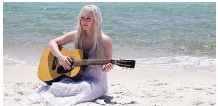
Auch in den Ferien ....