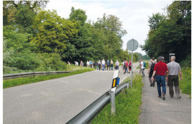
Von der Autobahnbrücke geht es in den Wald

Weiter ging es zu einer ruhigeren Waldlichtung mit Douglasienbestand, die deutlich machte, wie sehr Douglasien mit Schädlingsbefall und vor allem unter dem Wassermangel der letzten Sommer leiden. Sie gehören als Feinwurzler nicht zu den trockenresistenten Arten wie zum Beispiel die Trauben- und Roteichen sowie Rotbuchen, die derzeit im Gemeindegewald gepflanzt werden. Bei den Baumartenempfehlungen für die Zukunft waren ursprünglich die Douglasie und die Kiefer mit dabei. Die Erfahrung jedoch hat gezeigt, dass es durch den Klimawandel mit seiner anhaltenden Trockenheit sowie den Schädlingsbefall für die Nadelhölzer im Wald immer schwerer wird. Hier gilt leider die Regel: „Was durch Trockenheit und Schädlingsbefall weg ist, wächst nicht mehr nach“ - in 10 Jahren werden auch im Gemeindegewald die Nadelhölzer seltener zu finden sein. Laubbäume sind um einiges robuster und erholen sich im Laufe der Zeit; selbst wenn sich eine Aufsetzerpflanze, wie der Efeu, am Stamm ausbreitet. Der Efeu ist kein Rivale und kein Halbschmarotzer, jedoch mit einem Nachteil, die Bäume werden unter seinem starken Bewuchs einfach sturmgefährdeter. Die größte Konkurrenz sind die umgebenden Bäume selbst, führte Lothar Himmel aus. Und zum Thema Zukunftsbepflanzung ergänzte er, dass jetzt eher fremdländische exotische Baumarten im Gespräch sind – „Palmen werden wir dennoch nicht so schnell im Wald sehen“, antwortete er auf eine entsprechende Nachfrage.