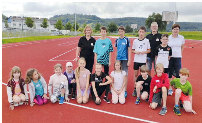
14 Kids stellten sich der Herausforderung zum Deutschen Sportabzeichen