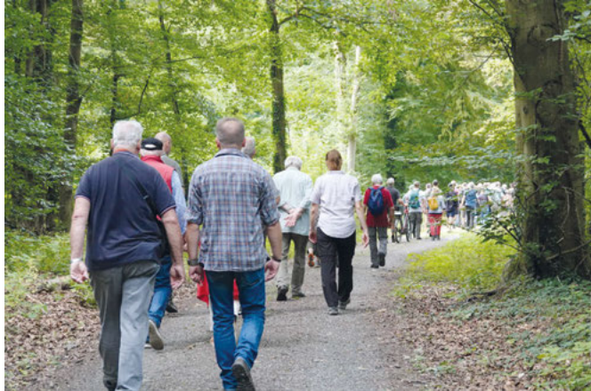
Auf zur nächsten Station

erfordern in der Anfangszeit viel Pflege, sie müssen vor allem regelmäßig bewässert werden, erklärte der Förster. Dies erfolgt durch einen Tiefbrunnen oder mit Wassertanks. Der Ausbau von weiteren Tiefbrunnen, auch aufgrund der zunehmenden Waldbrandgefahr, sollte weiter vorangetrieben werden, gibt Förster Schmitt für zukünftige Planungen mit auf den Weg. Sobald die Oberhöhe der Baumkronen von 13-14 m erreicht ist, erfolgt die oben genannte Z-Baum Durchforstung – nach 150 Jahren bleibt idealerweise alle 15 m eine gesunde Eiche übrig.