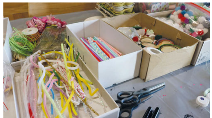
Das Material als Quelle der Inspiration

Ein Mädchen ließ sich mit der Grundierung viel Zeit. Immer wieder strich der Pinsel über ein sattes Dunkelblau. Auf die Frage, wer sich denn für ein lustiges Monster entschieden habe, antwortete nur ein Junge. Die anderen hatten sich offenbar für gruselig und böse entschieden – oder noch gar nicht. „Ich weiß es noch nicht“, sagte das Mädchen und der Pinsel glitt weiter auf und ab.