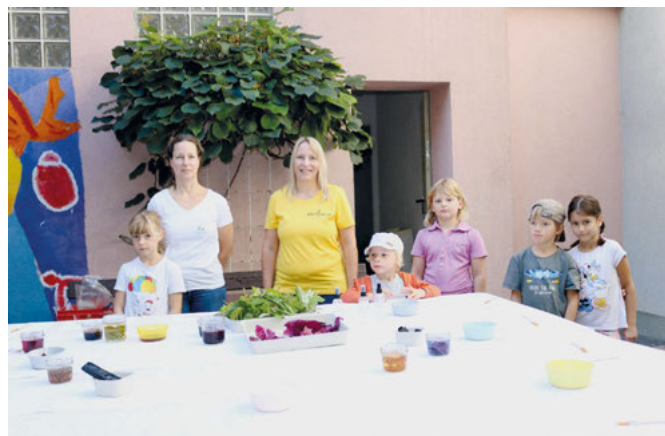
Die bunten Farbtöpfe stehen zum Malen bereit