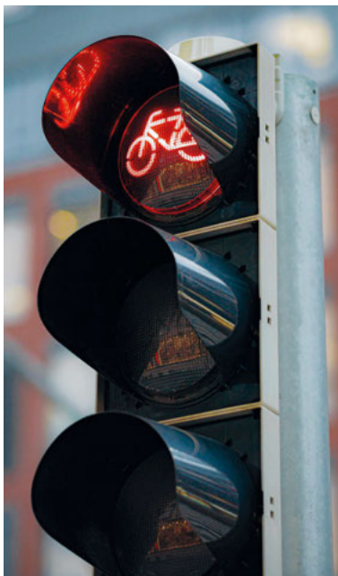
Die Vollsperrung beginnt ab 25. September 2023