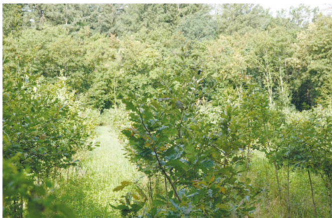
Die vierjährige Eichenkultur