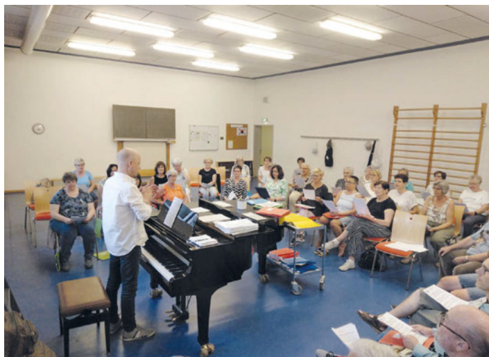
Am 7. September wieder donnerstags ab 19:15 Uhr: Chorprobe des GV Frohsinn

Die nächste Chorprobe finden wieder am 7. September 2023 statt. Weitere Informationen auch auf www.frohsinn-weingarten.de Folgt uns auf Instagram @Frohsinn-Weingarten und auf facebook Frohsinn Weingarten