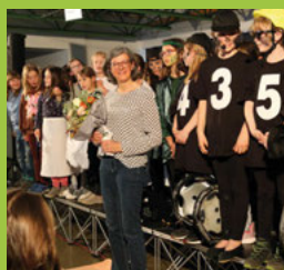
Musical in der Turmbergschule Seite 4