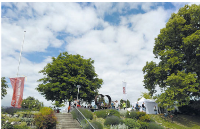
Turmfest am 18. Mai (Archivfoto)

Vorstand und Mitglieder des Gesangvereins Frohsinn Weingarten und des Sportvereins Germania Weingarten freuen sich auf Ihren Besuch beim Turmfest am Weingartener Warttum! Am 18. Mai bieten wir ab 11:00 Uhr bis zum frühen Abend wieder leckere Speisen und vielerlei Getränke sowie Kaffee und selbstgebackene Kuchen und Torten an.