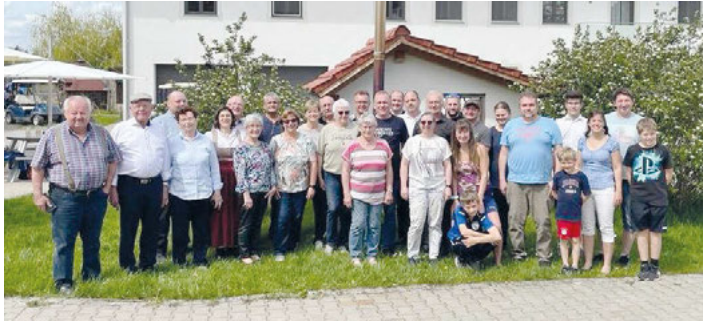
Freundschaftstreffen mit den Zellbachtaler Schützen in Pauluszell/Niederbayern.

Wir sagen vielen Dank an die Zellbachtaler Schützen und den Volkstrachtenverein Pauluszell. Es war wieder ein pfundiges Wochenende und wir freuen uns schon auf das Wiedersehen im nächsten Jahr.