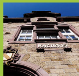
Einladungen Gemeinderats- sitzungen Seite 6-7