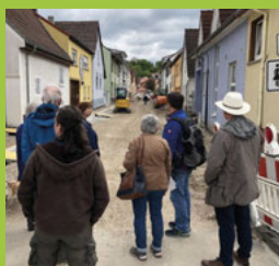
Quartiers- spaziergang Seite 3