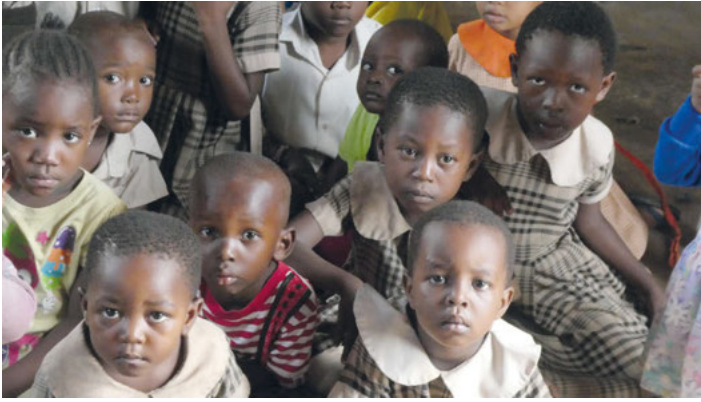
Diese Kinder möchten lernen und eine Zukunft haben.