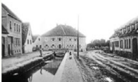
Lohmühle, fotografiert um 1900 Heute steht dort die Bahnhofsapotheke.