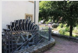
Wasserrad am Gailbumber, Foto: Hubert Daul.

Bedingt durch den Walzbach hatte Weingarten eine begünstigte Lage für Mühlen. Entlang des Baches waren es zeitweise fünf, wobei beim "Gailbumber" schon die Weißenburger Mönche eine Mühle hatten. Hauptsächlich unterschied man zwischen Ober-, Mittel- und Untermühle. In der Lohmühle beim alten Krankenhaus waren die Bemühungen, auch dort das Mehlrecht zu bekommen, mehrfach abgelehnt worden. Denn im Unterdorf wurde das Wasser zur Bewässerung der Wiesen gebraucht. Auch beim Werrabronn war zeitweise die sogenannte Werrenmühle eingerichtet. Nach dem Zweiten Weltkrieg waren nur noch die Lepp'sche und die Langendörfermühle in Betrieb.