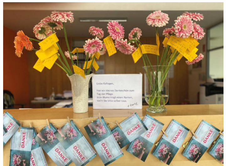
Dankeschön zum "Tag der Pflege 2023"

Ein herzliches Dankeschön an all unsere Patienten/Innen & deren Angehörige für Blumen, Kartengrüße & kleine Geschenke anlässlich des „Tages der Pflege“ am 12.05.2023.