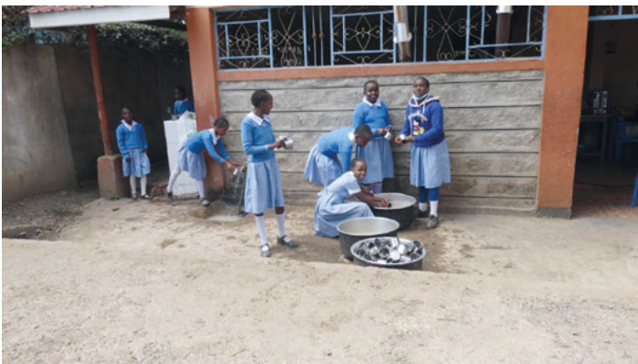
Jede Schule in Kenia verlangt eine einheitliche Kleidung für die Schüler.

Bürger- und Heimatverein Weingarten e.V. www.bhv-weingarten.de