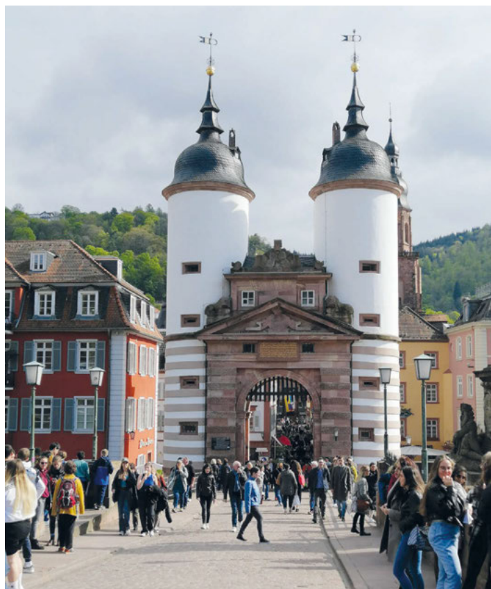
Das Brückentor an der alten Brücke in Heidelberg.