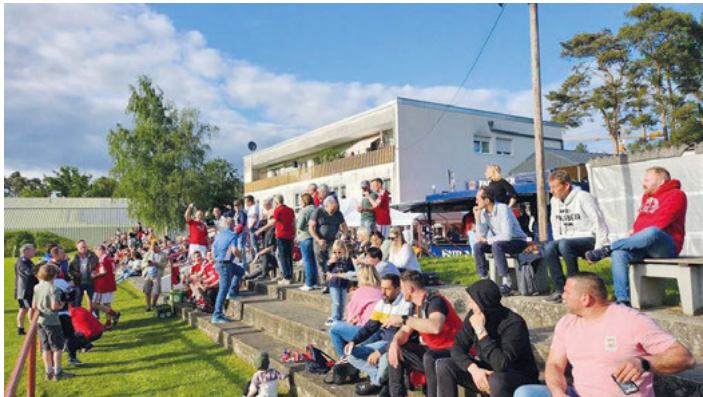
Prima Stimmung im Waldstadion

Ein ganz großes DANKE SCHÖN an alle Helferinnen und Helfer, die dieses Event möglich gemacht haben.