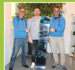
Neues aus dem Skiclub Stabil Seite 4