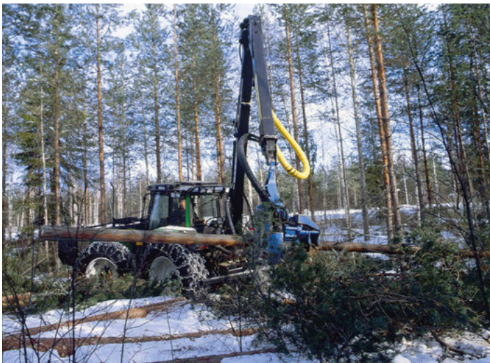
Dort wo es möglich ist, sollte Sturmholz mit forstlichen Großmaschinen, wie zum Beispiel einem Harvester, sicher aufgearbeitet werden.

Zug- und Druckseite beachten. Bei Seitenspannung von der Druckseite aus arbeiten.