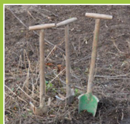
Das Forstamt informiert Seite 4