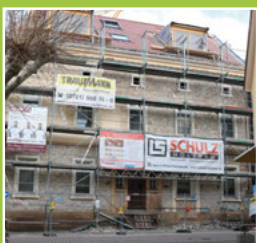
Was passiert in der Alten Apotheke? Seite 3

Hand in Hand: Durch das gute Zusammenspiel der Handwerker verschiedener Gewerke schreitet die Sanierung zügig voran.