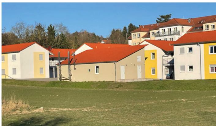
Blick auf die Flüchtlingsunterkünfte, Jöhlinger Str. 112