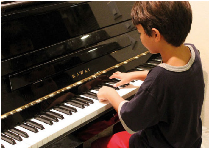
Einfach mal probieren!