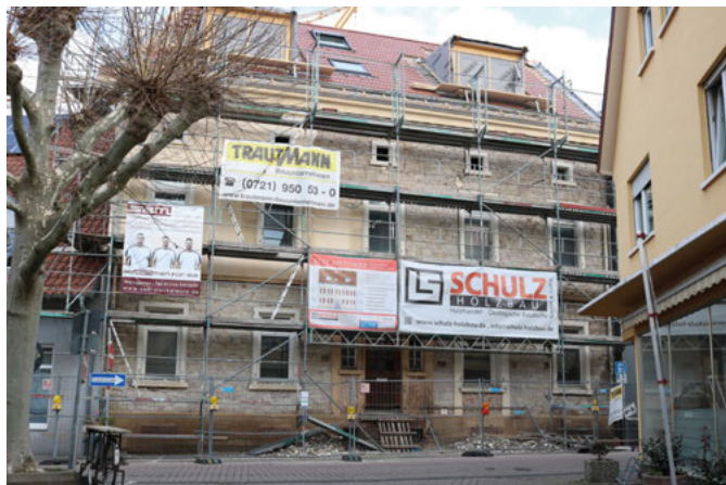
Fassade zur Straßenseite