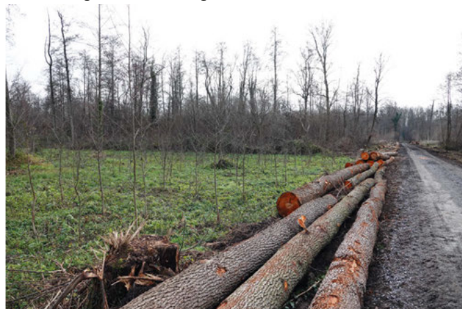
Jungbäume im Gewann Dörnig

Zum anderen ist unser Bestreben einen entsprechenden Totholzanteil zu gewährleisten. Neben Lebensraum für viele Tier- und Pflanzenarten, Stichwort Biodiversität, ist dies auch für den Aufbau eines zukünftigen gesunden Waldbodens sehr wichtig. Denn durch den Klimawandel wird es zu vermehrten Trockenperioden kommen und Totholz sowie der daraus entstehende Humus sorgt für eine langsamere Verdunstung des Niederschlags.