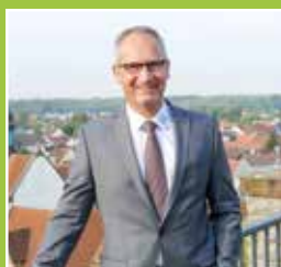
Einladung zur Bürgersprech- stunde Seite 5