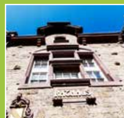
Einladungen zum AUT und VA Seite 4