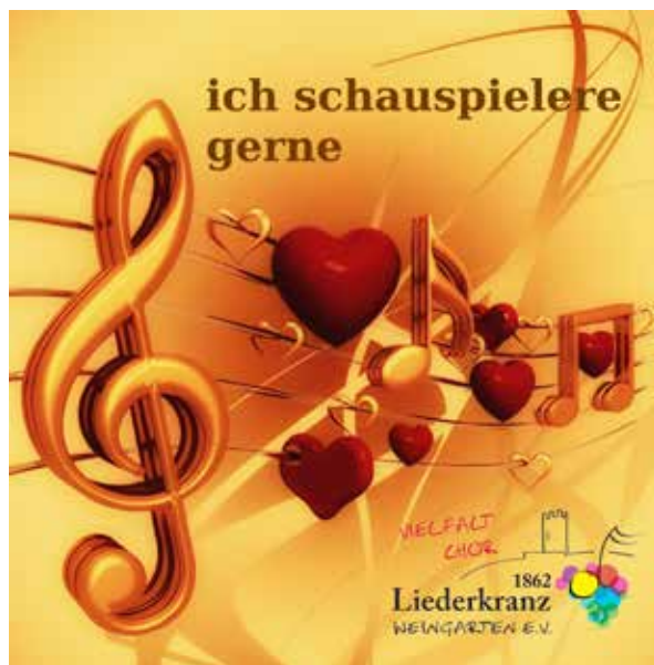
Manche Lieder werden bei Auftritten schauspielerisch dargestellt, um sie dem Publikum näher zu bringen.

Mit seinen vier unterschiedlichen Chören bietet der Liederkrantz Chorlebnisse für jeden Geschmack. Ob Rock-, Pop-, Jazzchor, moderner Männerchor, a capella Frauenchor oder gemischter Traditionschor. Aber warum sollte man zur Chorprobe gehen? Hier stellen wir jede Woche einen Grund vor, warum es sich lohnt, singen zu gehen. Weitere Informationen über die einzelnen Chöre auf unserer Homepage. Interessierte können sich per Email unter 52gruende@liederkrantz-weingarten.de melden.