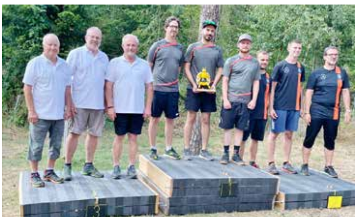
3. Platz in der Mannschaftswertung für den SV Weingarten.