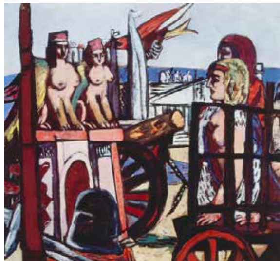
Dae Abtransport der Sphinx, 1945