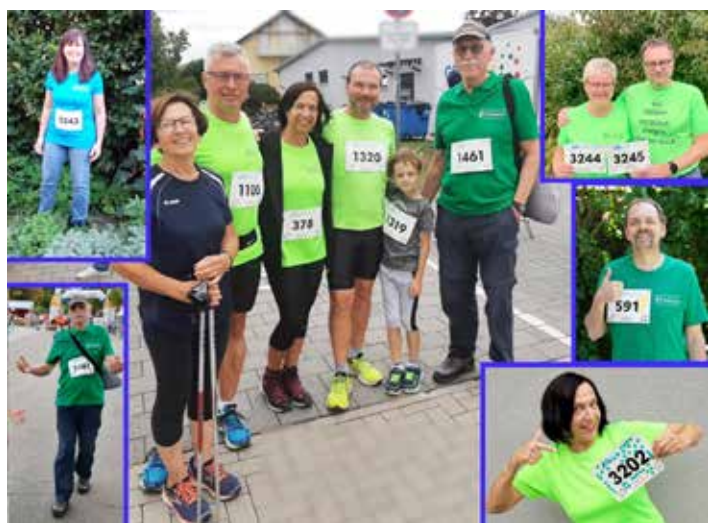
Wir können nicht nur Singen, sondern auch: Beim Lebenslauf mitmachen! (GV Frohsinn)

Nicht nur am 10. September, sondern auch beim „virtuellen“ Lauf in den beiden Wochen danach hat ein kleines, aber feines Team des GV Frohsinn am „Lebenslauf“ teilgenommen und noch weitere Kilometer für den guten Zweck gesammelt.