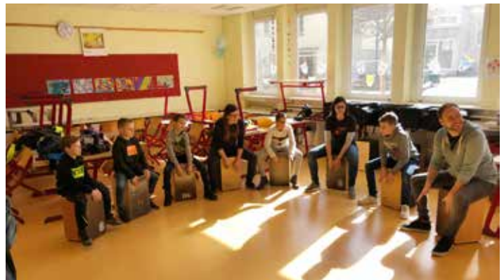
Die MusikvereinKIDS 2019 beim Trommelworkshop