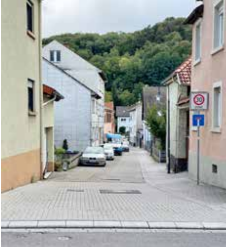
Blick von der Jöhlinger Straße in die Mühlstraße