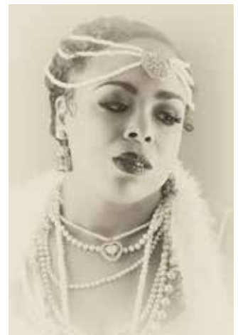
Josephine Baker