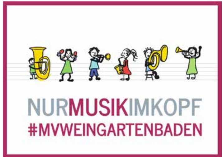
MusikvereinKIDS - nur Musik im Kopf

Alle Informationen über den Musikverein, die Orchester und Veranstaltungen findet ihr immer aktuell unter www.musikverein-weingarten.de .