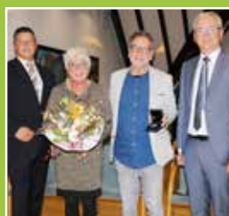
Verleihung der Staufermedaille Seite 3