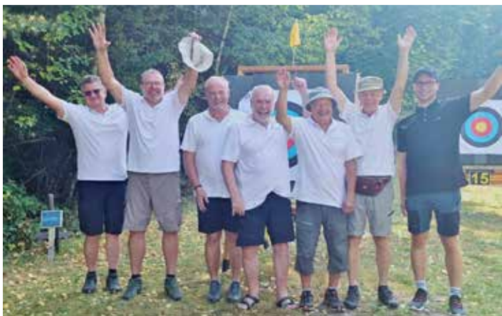
Die Weingartner Bogenschützen hatten sichtlichen Spaß beim Bienwald-Bogenturnier in Kandel.