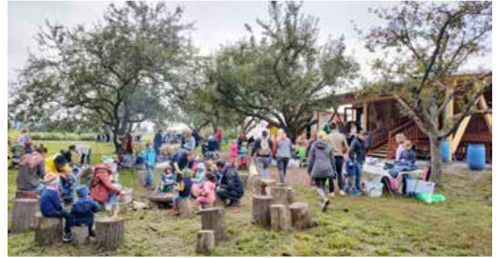
Reges Treiben auf dem Gelände des Naturkindergarten Weingarten am Wochenende beim Flohmarkt mit Stockbrot am Lagerfeuer und Kaffee und Kuchen

den Vorschulkindern ein zusätzliches Angebot zur Gewaltprävention an der Academy Karlsruhe zu ermöglichen. In diesem Kurs „Young Warrior“ erlernen die Kinder ab 5 Jahren wie ihre Selbstständigkeit, Selbstsicherheit und die gewaltfreie Kommunikation gefördert, gefestigt und vermittelt wird. Einige Eltern des Naturkindergarten Weingarten haben sich Anfang des Jahres zusammengetan, um einen Förderverein zu gründen, damit über Verkaufsfaktionen wie dem Flohmarkt, Spendengelder oder Mitgliedsbeiträge solche zusätzlichen Angebote für die Kinder ermöglicht werden können. Alle Mitwirkenden und der Vorstand des Fördervereins freuen sich sehr über die positive Bilanz des ersten Kindersachenflohmarktes und kündigten schon jetzt eine Wiederholung im Frühjahr 2023 an.