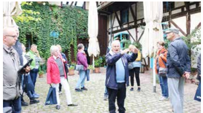
Im Innenhof des Fränkischen Hof, eines der ältesten Fachwerkensembles Weingartens