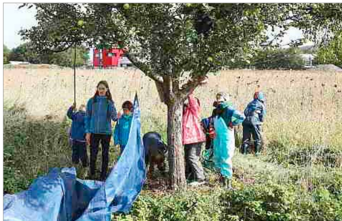
Die Buntspechte haben am vorletzten Samstag drei von der Gemeinde Weingarten gepachtete Apfelbäume geerntet und die Äpfel beim Natursaftmobil pressen lassen. Vielen Dank an die Gemeinde Weingarten und an Gutes Gemüse e.V., dass das Natursaftmobil organisiert hat. Es hat viel Spaß gemacht!

Die Buntspechte schauten sich die verschiedenen Spechtarten an, bastelten welche aus Papier, richteten die Grundstücke weiter her (z.B. entstand ein Sonnenblumenbeet), bauten Nistkästen für die Vögel, erkundeten die nähere Umgebung, ... Auch hier gab es Leckereien, wie Wildkräuterburger und Holunderblütenpannkuchen.