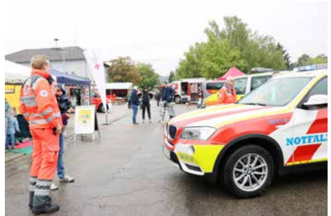
Fahrzeuge sind immer interessant. Trotz bescheidenen Wetters war der Tag der Rettungskräfte in Weingarten gut besucht.

Sie möchten die Turmberggrundschau gerne als