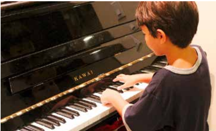
Einfach mal probieren!