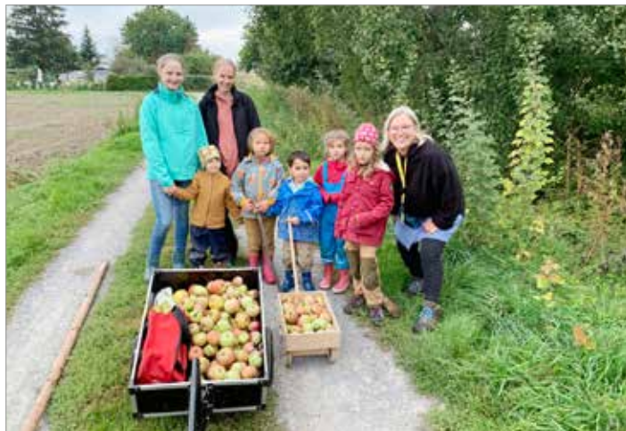
Letzten Samstag wurde von den Spatzen ein von der Gemeinde Weingarten gepachteter Apfelbaum geerntet und die Äpfel zu Apfelbrei verarbeitet, der mit selbstgemachtem Milchreis verspeist wurde.