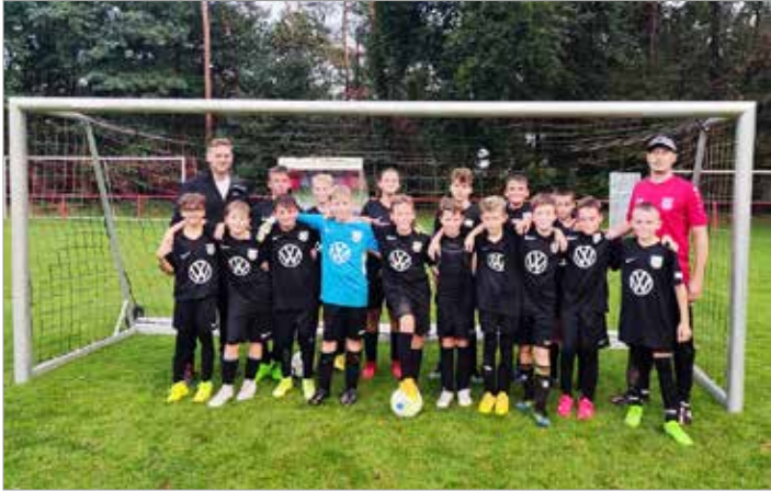
Unsere D1-Junioren sind für die Kreisliga qualifiziert

Unsere neu zusammengestellte Mannschaft hat gezeigt, wie schnell sie zu einer Gemeinschaft zusammengewachsen ist. Neben dem Erfolg waren der mannschaftliche Zusammenhalt, Teamgeist und Fairness ebenso wichtig.