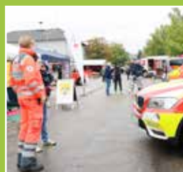
Tag der Ret- tungskräfte Seite 4