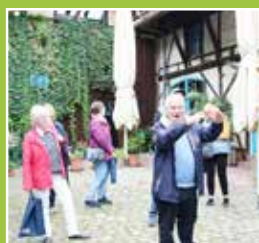
Neubürger- führung Seite 3