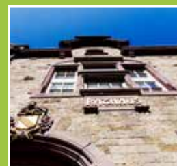
Aus dem Gemeinderat Seite 5