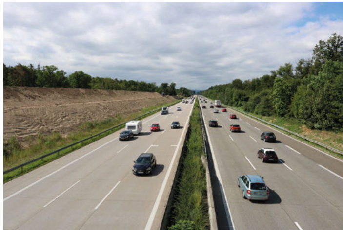
Der Lärmschutzwall an der BAB 5 ist auch in südlicher Richtung schon weitgehend fertiggestellt

Der Gemeinderat stimmte dem vorgelegten Zwischenbericht des Lärmaktionsplans sowie der Aufstellung der 3. Fortschreibung des Lärmaktionsplans mit dem Ziel zu, Maßnahmen zur Verringerung des Straßenlärms festzulegen. Der Entwurf vom Juni 2022 soll in die Offenlage gehen. Der Lärmaktionsplan wird am 21. Juli 2022 in einer öffentlichen Informationsveranstaltung der Bürgerschaft vorgestellt.