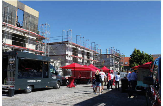
In Natura: Die Bebauung an der Ringstraße soll ein hochwertiges Areal werden - mit eigenen Stellplätzen und dazugehörigem Kinderspielplatz

Bis Ende 2023 ist die Fertigstellung avisiert. Nähere Einzelheiten sind auf der Homepage des Bauherren unter „Wohnen an der alten Schreinerei“ zu erfahren.