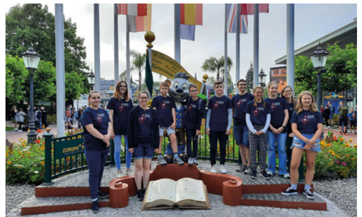
Das Schülerorchester im Europapark