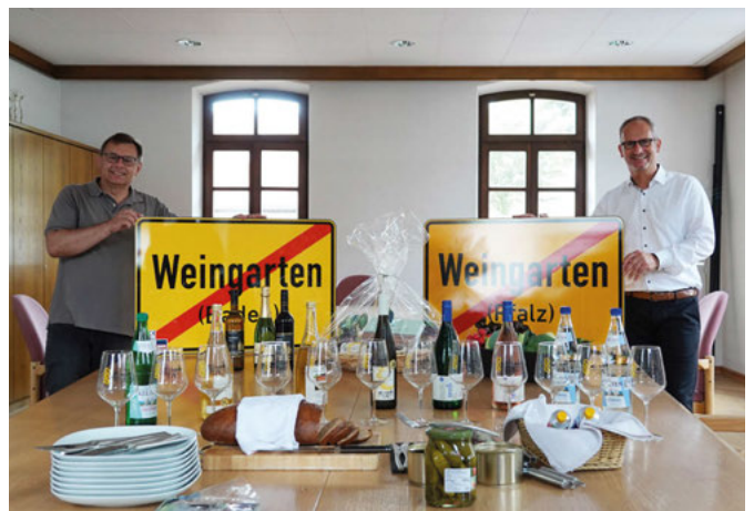
Die beiden Bürgermeister bei der symbolischen Schilderübergabe