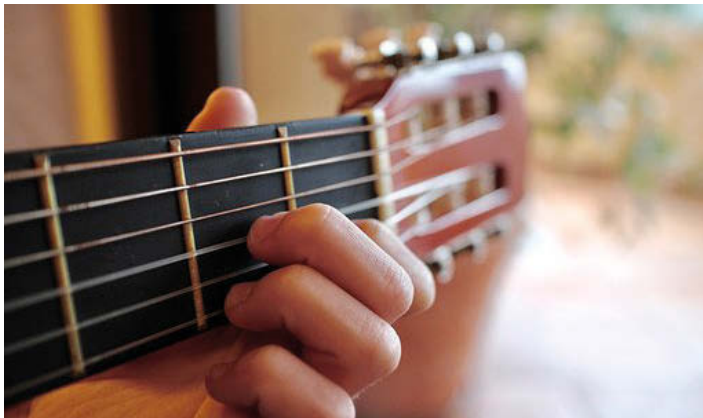
Musik von Hand gemacht!

Wir freuen uns darauf, von Ihnen zu hören! Ihr Musikschulteam