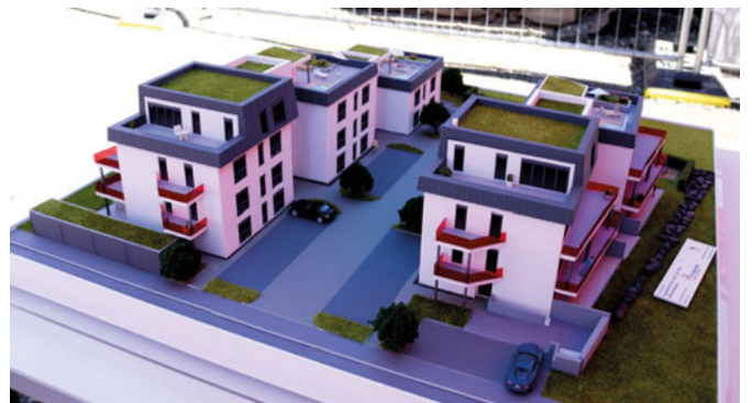
Im Modell: Ansicht von der Ringstraße