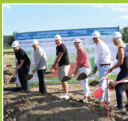
Startschuss und Spatenstich für die Außensportanlage Seite 3

Eine gemeinsame Veranstaltung der Weingartener Vereine & der Gemeinde