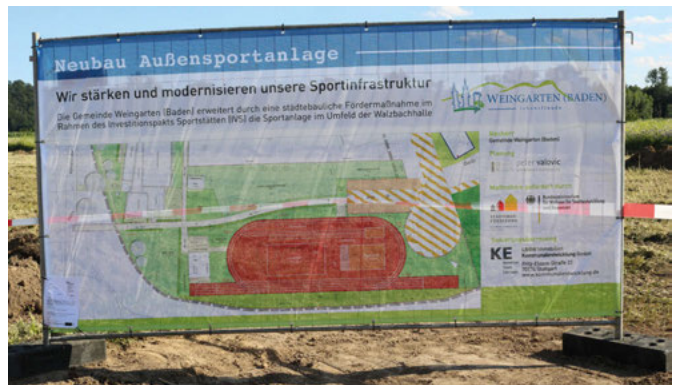
Präsentation der Planung: Neubau Außensportanlage