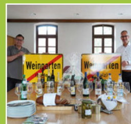
Weingarten - hivwe wie driwwe Seite 5