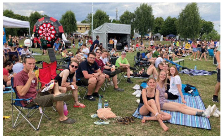
Die Weingartner Gruppe auf dem Festival-Gelände beim Badentreff

Vielen Dank an alle, die dabei waren, und natürlich an das Orga-Team!