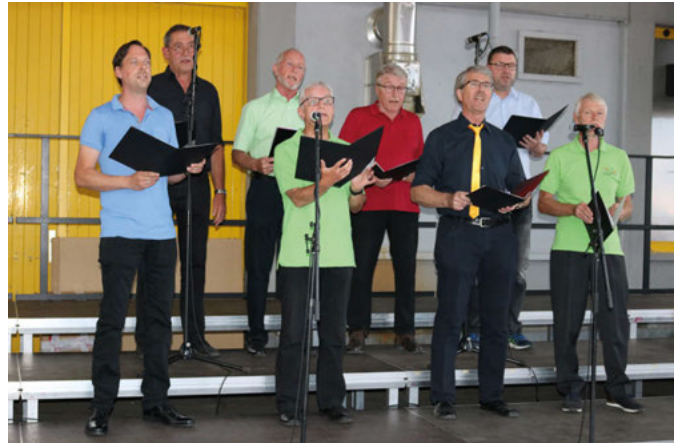
Men in Mood

Unterhaltung auch in flüssiger Form auf der Weinterrasse noch lange weiter gehen können, aber ein nahender Regenschauer setzte dem wundervollen Konzert dann doch ein Ende.