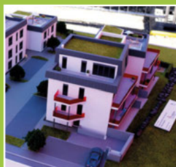
Wohnen an der alten Schreinerei Seite 4