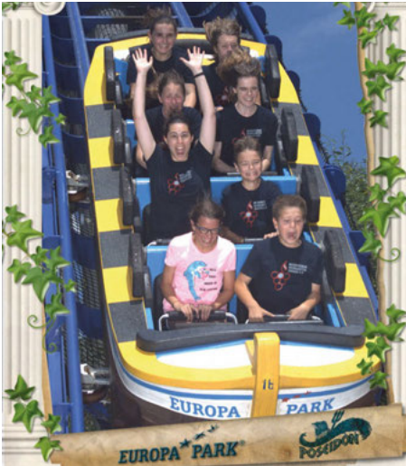
Spaß in der Achterbahn