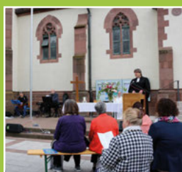
Himmelfahrtstag in Weingarten Seite 3

Tannenweg 20, 76356 Weingarten-Waldbrücke