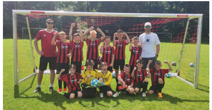
Unsere E1-Junioren freuen sich über die gute Saison