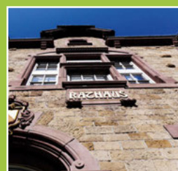
Aus dem Gemeinderat Seite 4-6