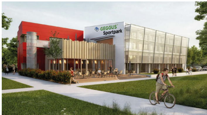
Nicht vergessen: Treffpunkt ist am Parkplatz vor dem GEGGUS Sportpark um 12:50 Uhr.

Wir freuen uns schon jetzt auf eine schöne & informative Seniorenfahrt mit Ihnen.