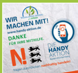
Ergebnis Handy- sammelaktion Seite 4