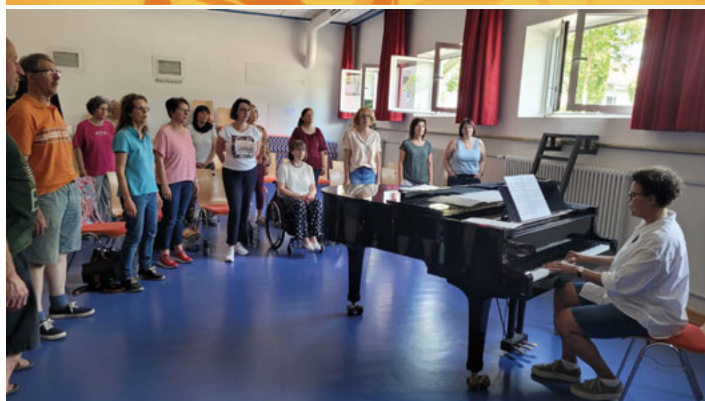
Beim Singen wird die richtige Atmung und die Atemkontrolle trainiert, was sich positiv auf Erkrankungen wie Asthma und COPD auswirkt.