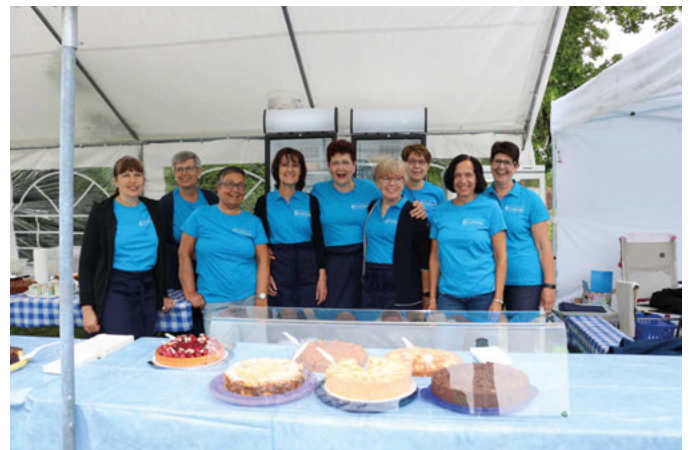
Die Frohsinn-Frauen auf dem Turmfest

Aber es war nicht nötig, nach Erklärungen zu suchen. Ab der Mittagszeit füllten sich die Bänke und am Essensstand bildeten sich mitunter Schlangen. „Ab dann war bis zum Abend immer was los“. Gegen Ende waren mindestens acht Fässer Bier über die Theke gegangen.