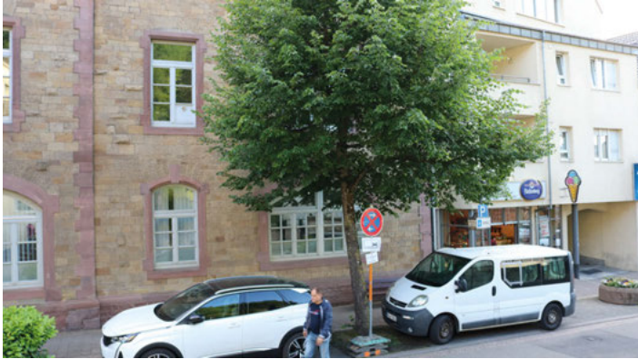
Baum in der Bruchsaler Straße: An dieser Stelle wird eine Fußgängerampel installiert

Bund hierfür die kompletten Kosten für Sanierung und Ausbau. Auf der Bruchsaler Straße soll direkt beim Eiscafé eine Fußgängerampel installiert werden. Damit werde die geforderte Querungshilfe im Rahmen der Sanierung Jöhlinger Straße umgesetzt. Leider müsse dafür einer der beiden Bäume gefällt werden.