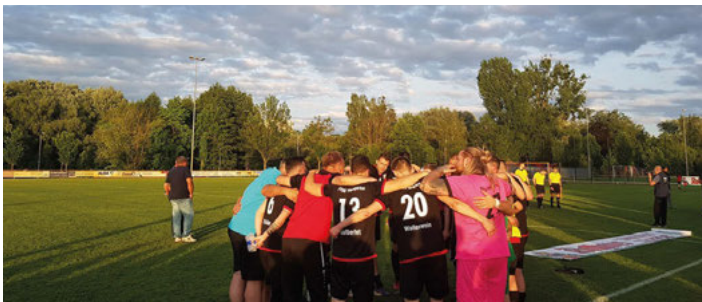
Bild-Unterschrift: Das Team hält zusammen!

Die Enttäuschung nach Abpfiff war natürlich groß. Trotz der Niederlage gebührt der Mannschaft ein großes Lob und höchste Anerkennung, sie hat eine fantastische Pokalrunde gespielt. Auch im Finale hat sich das Team nie aufgegeben und gegen einen starken Gegner bis zum Schluss alles gegeben.