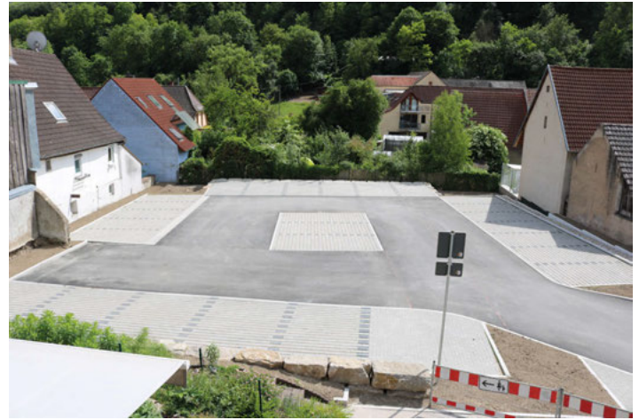
Parkplatz Jöhlinger Straße