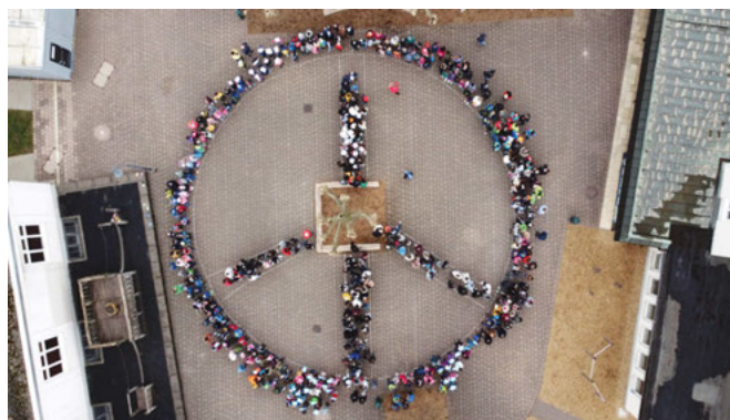
Peace: Schülerinnen und Schüler der Gemeinschaftsschule Weingarten setzen ein Zeichen für den Frieden in der Ukraine

Förderverein der Villa Kunterbunt, die in Bruchsal-Büchenau ihren Stammsitz hat und derzeit Kinder, die ohne Eltern aus der Ukraine hierher kommen, aufnimmt. Ihnen soll das Geld zugutekommen.