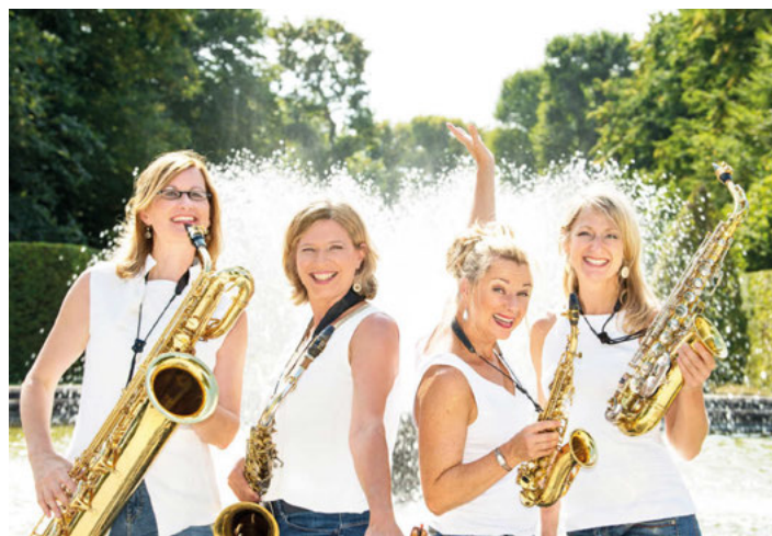
Sistergold: 30.4., 20 Uhr

Sonntagmorgen, 10:30 Uhr, sein aktuelles Programm "Albedo" - Blasmusik voller Kreativität, Spontanität und Spielwitz. Der Vorverkauf startet in Kürze. Aktuelle Informationen dazu finden Sie im Internet auf unserer Ticketseite über den Link bit.ly/3LkIPUT .