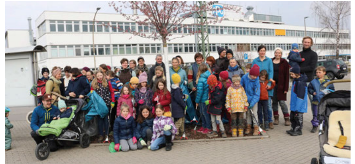
50 Wastebusters kamen zusammen um Müll zu beseitigen.

Und sie kommen, die Wastebusters – über 50 davon haben sich am 20. März 2022 am Weingarten Bahnhof getroffen, um die Beschmutzung zu beseitigen: den Müll, der unsere Umgebung überflutet. Ganz besonders entlang der größeren Straßen sieht es in Weingarten nämlich übel aus. Weggeworfene Becher, Zigarettenskippen, Mundmasken und vor allem Plastik in allen erdenklichen Formen findet sich in erstaunlichen Mengen im Gras und im Gebüsch. Daher: ruft die Wastebusters, und zwar genau jetzt, bevor die Vegetation austreibt und der ganze Unrat unter grünem Gras und Laub verborgen wird und den Mulchmaschinen zum Opfer fällt.