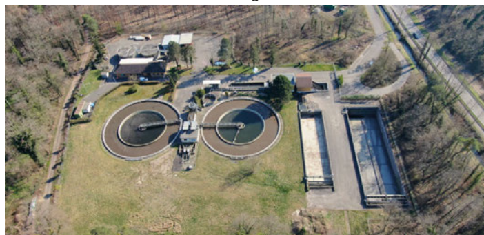
Die Kläranlage im Bestand

um Fördergelder zu erhalten. Erst dann können bis Oktober die Planungsleistungen vergeben werden. Bis September 2024 sollen die Umweltverträglichkeitsprüfung abgeschlossen sein, sowie die geotechnische Hauptuntersuchung und die Artenschutzprüfung und bis 1. Oktober 2024 der Förderantrag gestellt sein. Im Jahr 2025 soll die Ausführungsplanung erstellt werden und im Dezember 2025 die Vergabe erfolgen, damit ab 2026 gebaut werden kann. Da die Studie den Mitgliedern beider Gremien bereits bekannt war, war die inhaltliche Diskussion abgeschlossen. Nach einer kurzen Beratungspause kam es zur Abstimmung: Die Gemeinderäte der beiden Gemeinden beschlossen getrennt voneinander jeweils einstimmig, die eigenen Vertreter beim Abwasserzweckverband zu beauftragen, die Zustimmung zur ertüchtigung der Kläranlage mit der Umstellung auf die getrennt anaerobe Stabilisierung des Klärschlammes sowie die hierfür erforderlichen Investitionskosten von 16,85 Millionen Euro Stand 2020 zu erteilen. Die Finanzverwaltung wird beauftragt, die Fördermöglichkeiten bestmöglich auszuloten und im Gemeinderat entsprechendem Bericht zu erstatten. Der gefasste Beschluss ist für die Vertreter in der Verbandsversammlung bindend.