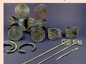
Spektakuläre Funde aus dem Hügelgrab 34, die im Heimatmuseum in der Durlacher Straße 30 in Weingarten präsentiert werden.

Begehung von archäologischen Fundstellen im Gewann Dörnig. Wanderung - durch eines der größten und archäologisch spannenden Hügelgräberfelder im Rheintal (Hügelgräberbronzezeit, Hallstatt, Latene);