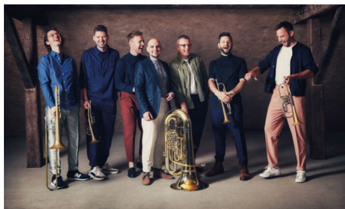
Federspiel: 1.5., 10:30 Uhr

Christlicher Verein Junger Menschen www.cvjm-weingarten.de