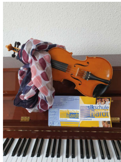
Klavier oder Geige?

Allerorten hört man es singen und pfeifen. Vogelgezwitscher weckt uns frühmorgens. Aber auch an anderen Orten sind die schönen Töne zu hören! In unseren Unterrichtsräumen singt man, spielt Klavier, Geige, Schlagzeug, Fagott, Oboe, Saxofon oder akustische und elektrische Gitarre, Keyboard oder Cello und neuerdings auch Ukulele und noch andere Instrumente! Die Auswahl ist groß, der Spaß noch größer! Und wer will, kann auch einen Schnupperkurs buchen, um zu testen, welches Instrument am besten zu ihm/ihr oder Ihrem Kind passt.