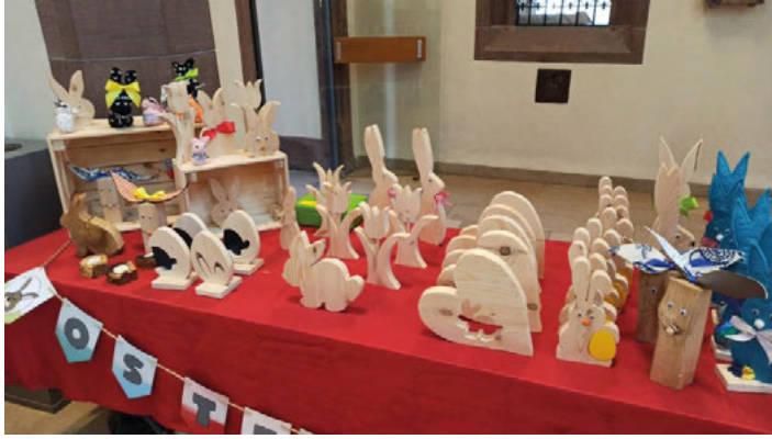
Ostermarkt in der kath. Kirche

Auch in diesem Jahr bietet das Gemeindeteam Weingarten wieder Dekoartikel an, die Sie gegen eine Spende erwerben können. Der Erlös geht an die Christliche Sambiahilfe, die sich um Schulen und Bildung in Sambia kümmert. Liebe Kolpingschwestern und Kolpingbrüder unterstützen diese Aktion.