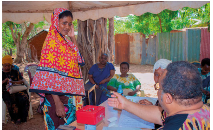
Tablebanking (= Bank auf dem Tisch)