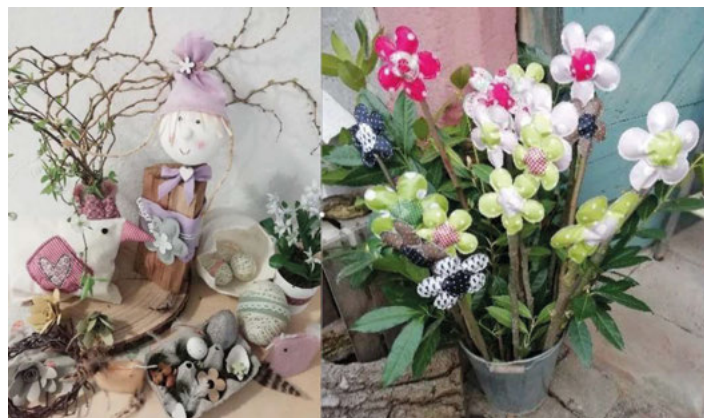
Dies und vieles mehr gibt's beim Osterverkauf in der Pfarrscheune

Einer „kleinen Tradition“ folgend gibt es auch in diesem Frühling wieder einen kontaktlosen Frühlings- und Osterverkauf, und zwar von Donnerstag, 7.4.2022 bis Donnerstag, 14.4.2022 jeweils von 9.00 bis 18:00 Uhr in der Pfarrscheune beim evangelischen Pfarrhaus in der Kirchstr. 6. Angeboten werden wieder Deko-Artikel und kleine Geschenke für den Frühling und das Osterfest.