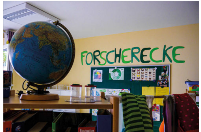
Die Forscherecke im Hort an der Schule.

Nach 13 Uhr verlassen die Schulkinder die Schule und gehen in die Schulkindbetreuung (Bahnhofstraße Nr. 3 und Nr. 7). Bis maximal 16