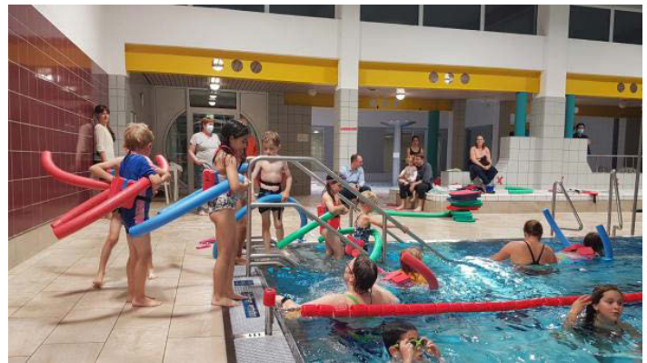
Großer Andrang beim Frühschwimmkurs der DLRG Ortsgruppe im Walzbachbad

Donnerstags, 19.30 - 21.00 Uhr: Freies Training der Erwachsenen sowie Jugendliche der Gruppe "Chris"