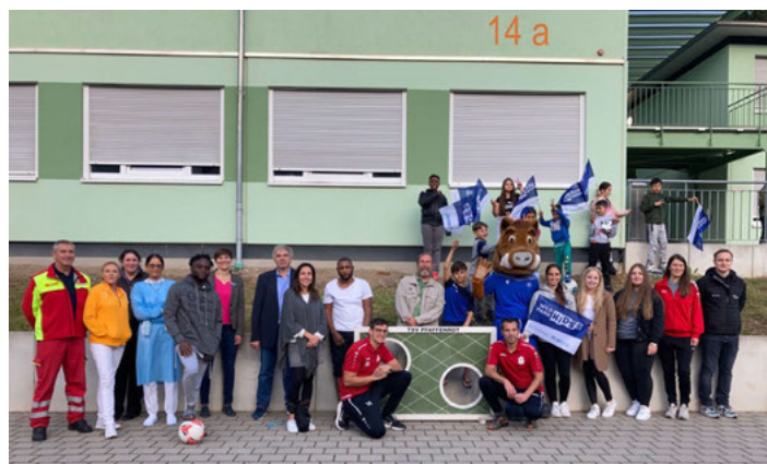
Erfolgreiche Impfkaktion in der Gemeinschaftsunterkunft in Waldbronn zusammen mit dem KSC und dem TSV Pfaffenrot