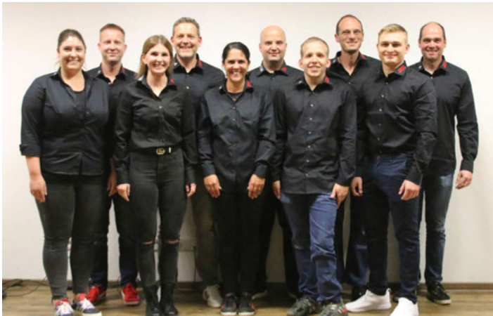
Die Vorstandschaft des SVG

Der Anbau der Mineralix-Arena ist bis auf wenige Restarbeiten abgeschlossen. Die erforderliche und im Vergleich zu den geplanten Baukosten geringe Erhöhung des Kreditrahmens wurde durch die Versammlung