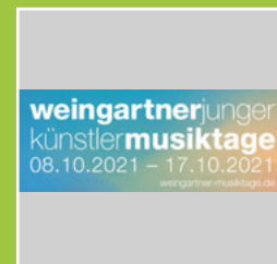
Weingartner Musiktage Junger Künstler Seite 21