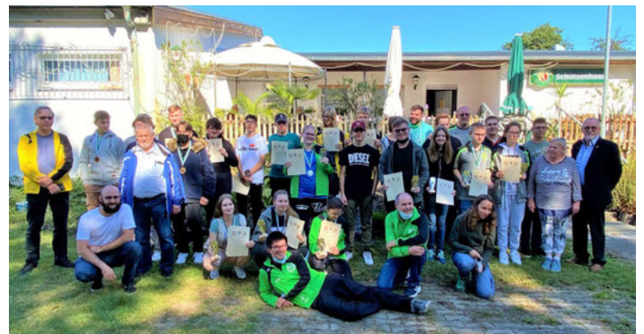
Stolz zeigen die Bestplatzierten ihren gewonnenen Pokal und Urkunde