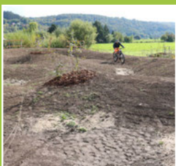
Bike Park ist fertig gestellt Seite 4