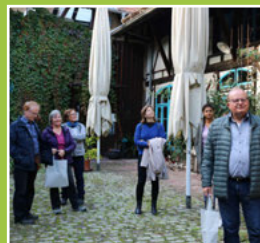
Historischer Ortsrundgang Seite 5