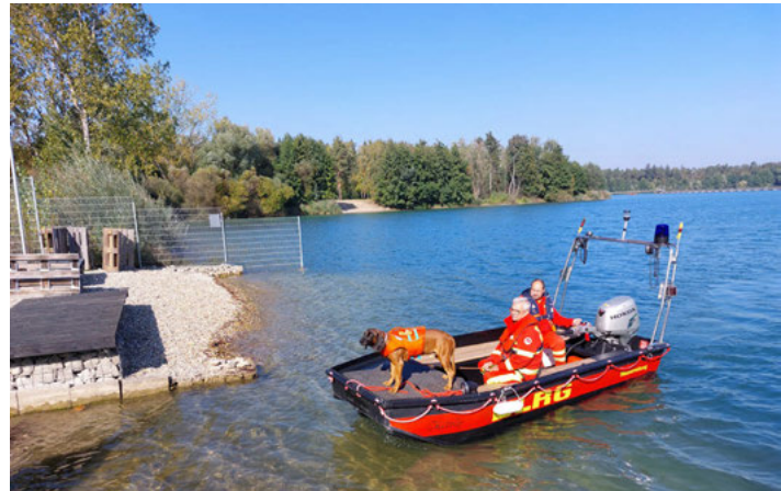
Training der DLRG-Wasserrettungshunde am Weingartener Baggersee

Arbeiterwohlfahrt Weingarten www.awo-weingarten.de