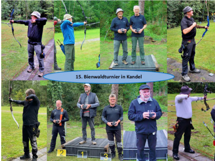
Vier Podestplätze gingen an die Weingartner Bogenschützen beim 15. Bienwaldturnier in Kandel.