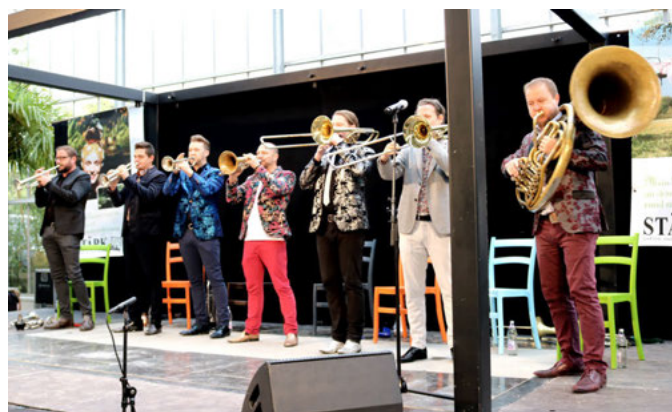
„da Blechhauf'n“: Die sieben Blechbläser gelten als „die wohl berühmtesten Vertreter der blechigen Zunft“ (Archivfoto aus dem Jahr 2018 im Gewächshaus Stärk)

Bei der Buchhandlung Carolin Wolf, Schillerstraße Oder online bei Reservix unter www.weingartner-musiktage.de .