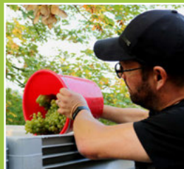
Weinlese – ein guter Ertrag Seite 4