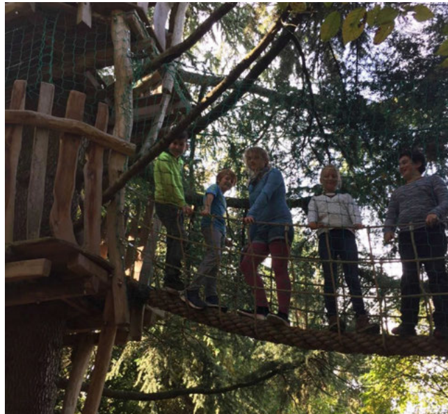
Auf dem Baumhaus im Projektgarten

Weiter geht's bei der AGNUS-Jugend ab Ende Oktober zunächst mit zwei Gruppen: Für die Jugendlichen ab der 5. Klasse gibt es Workshops in Zusammenarbeit mit dem GloW Karlsruhe e.V. und die neue Gruppe der jüngeren Wurzelkinder trifft sich auf dem AGNUS-Grundstück im Bruch. Wir freuen uns darauf!