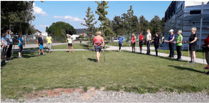
Fortbildung des BTB - Nordic Walking