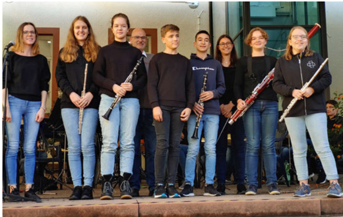
erfolgreiche Musikerinnen und Musiker beim JMLA in Bronze und Silber

Der Zugang zu beiden Vereins-Veranstaltungen ist gemäß der aktuellen Coronaverordnung nur unter Einhaltung der „3-G-Regeln“ gestattet. Es besteht in den Laufflächen sowie auf den Toiletten die Pflicht zum