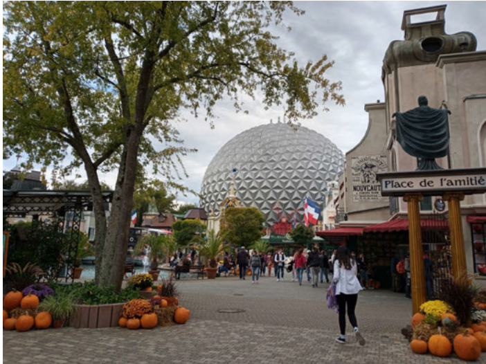
Weiterfeiern nach dem Festgottesdienst im Europapark

Nach dem offiziellen Teil ging das Feiern dann im Europark selbst weiter, denn die Betreiberfamilie Mack sponsorte allen Teilnehmern der Jubiläumsfeier Freikarten für den Park. Immer wieder sah man in dem Warteschlangen der Attraktionen ein CVJM T-Shirt auftauchen. Es war