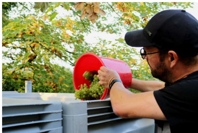
Die vollen Eimer werden in den Bottich gekippt, dann wird das Lesegut zur Annahmestelle gefahren.