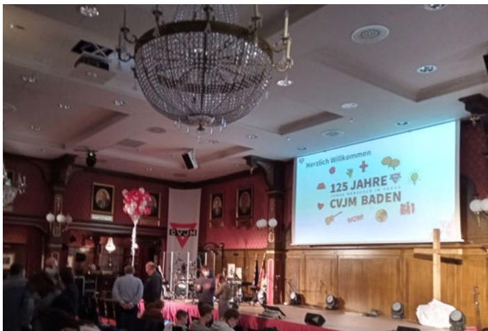
Festgottesdienst im Ballsaal Berlin