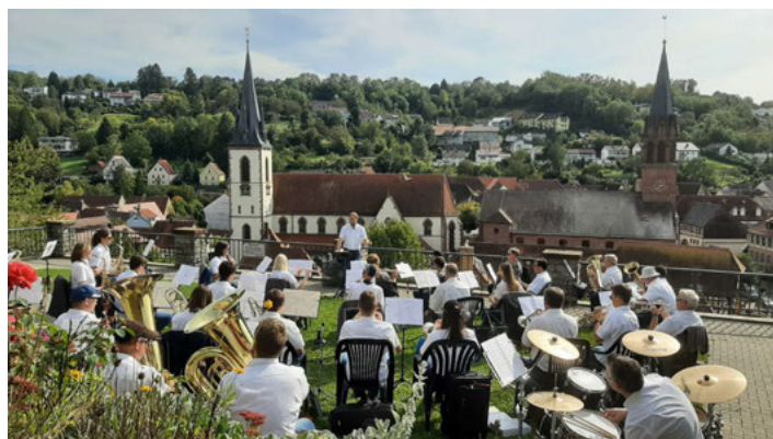
Turmbergmusik mit Aussicht