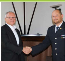
FFW Kommandantenwechsel Seite 3

Jetzt bestellen unter: adac.de/gt-masters