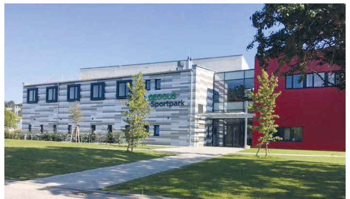
TSV-Vereinszentrum GEGGUS Sportpark mit Haupteingang

Nähere Infos und die Anmeldemöglichkeiten finden sich auch auf der Homepage www.tsv-weingarten.de . Einfach reinklicken, auswählen, anmelden und aktiv dabei sein!