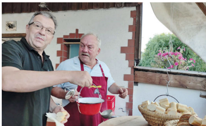
Leckeres Wildschweingulasch vom Jäger, das wollte man sich nicht entgehen lassen.