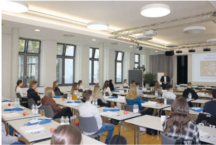
37 junge Menschen haben am 1. September eine Ausbildung oder duales Studium beim Landratsamt Karlsruhe begonnen.

Ein Kennenlernetag mit gruppenspezifischen Übungen zur Stärkung der Sozialkompetenz runden die Einführungsstage ab. Damit haben die jungen Menschen einen optimalen Start in ihre Ausbildung und ihr Studium.