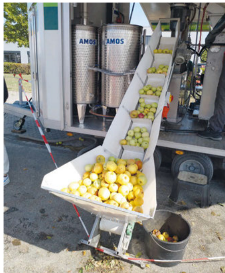
Mit dem Apfelfahrstuhl gelangen die Früchte in die Presse.