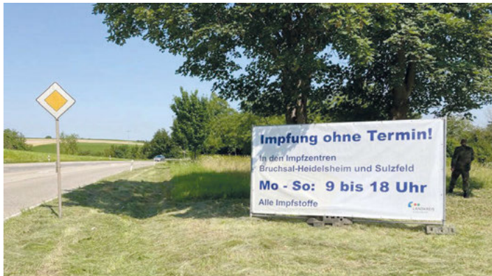
In den Kreisimpfzentren in Bruchsal-Heidelsheim und Sulzfeld wird täglich von 09.00 bis 18.00 Uhr ohne Terminvereinbarung mit allen Impfstoffen geimpft.

Jetzt noch Möglichkeit für Impfung ohne Terminvereinbarung nutzen Noch bis zum 30. September bleiben im Land Baden-Württemberg die Kreisimpfzentren und damit auch die Impfzentren in Bruchsal-Heidelsheim und Sulzfeld geöffnet.