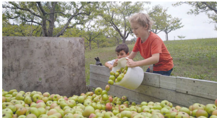
Vor dem Pressen kommt die Ernte

Eine Anmeldung wird ab dem 13.9. telefonisch bei Caro Barber unter 0176/24304979 möglich sein. Eine ungefähre Mengenangabe ist für die Terminvergabe erforderlich.