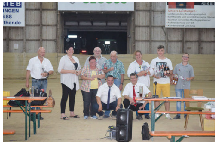
Das Team Stallumbau