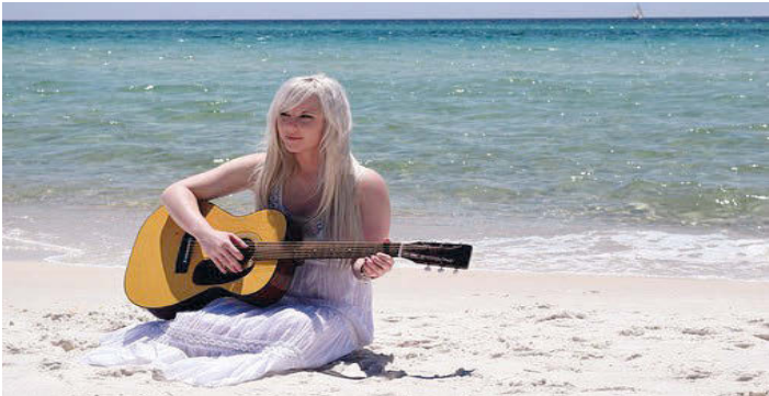
Musik am Strand!

Die Gebührenordnung finden Sie auf unserer Homepage , www.musikschule-hardt.de , die Ihnen außerdem viele Informationen zu unserer Schule und unseren Lehrkräften bietet . Fragen Sie uns, wir beraten Sie gerne! Tel. 07249-1859. E-Mail: sekretariat@musikschule-hardt.de . Wir freuen uns darauf, von Ihnen zu hören! Ihr Musikschulteam