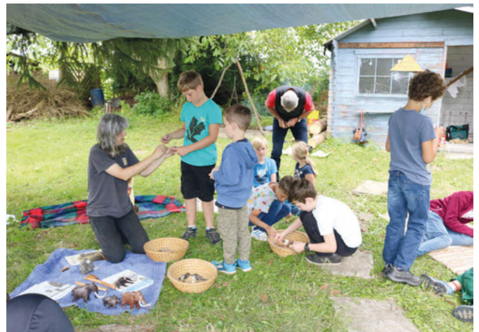
Steinzeitliche Messer zu bauen ist keine ganz leichte Arbeit, aber die Menschen in der Steinzeit hatten Zeit und die Messer waren scharf