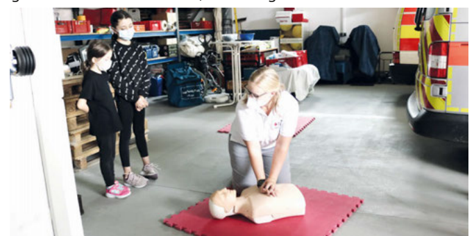
Demonstration einer Herzdruckmassage an der Übungspuppe