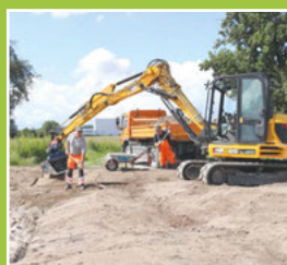
Bike-Park in Arbeit Seite 3