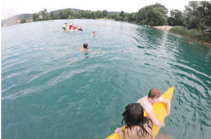
Spiel und Spaß am Baggersee beim diesjährigen Jugendwochenende

28.08.2021: Schwertfischschwimmen (Ort: Wache am Baggersee Weingarten, nähere Angaben folgen)