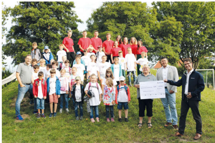
Die Kinder der Ortsranderholung freuen sich auf einen erlebnisreichen Tag in Tripsdrill. Finanziert hat den Ausflug die Spende von der Netze-BW.

Informationen unter: https://www.netze-bw.de/portoaktion