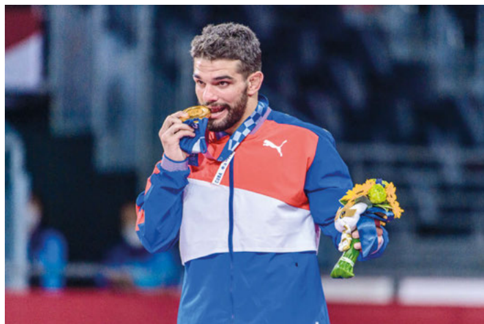
Luis Orta gewinnt Gold in Tokio