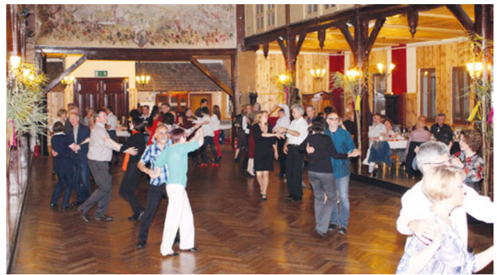
Tanzveranstaltung vom Tanzclub Kristall Weingarten