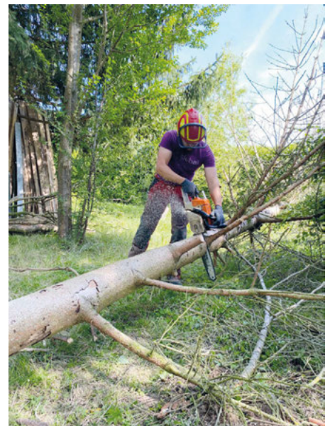
Die toten Fichten auf dem Grundstück der AGNUS-Jugend mussten gefällt werden.