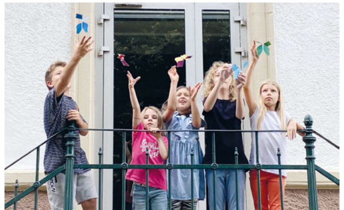
Die witzigen Schmetterlinge können tatsächlich ein kleines Stück weit fliegen, angetrieben von einem gedrehten Gummiring