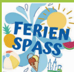
Ferienpaß in Weingarten Seite 4-5