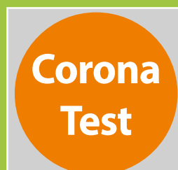
Öffnungszeiten Corona-Testmobile Seite 9