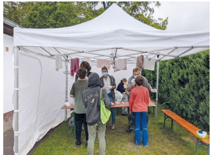
Corona-Testung auf der Freizeit