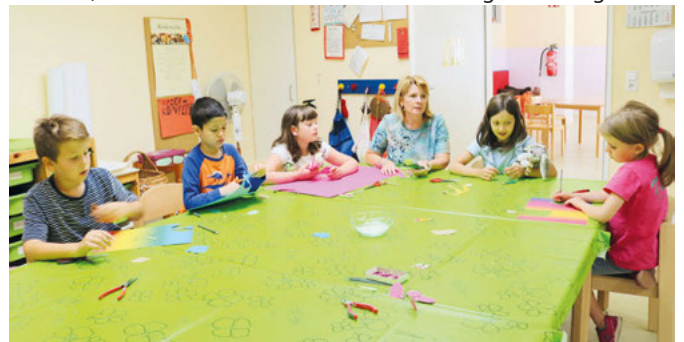
beim Basteln in den Räumen Bahnhofstr. 7

durch einen Sportparcours in der Halle zu ersetzen. Meist haben vor allem die jugendlichen Betreuerinnen noch kreative Ideen für irgendwelche selbst hergestellten Leckereien, in diesem Jahr waren das Kekse und selbst hergestelltes Eis! Wow! Mit solchen coolen Ideen sind Ferien in der Schulkindbetreuung keine endlosen Wochen, sondern interessante und abwechslungsreiche Tage.