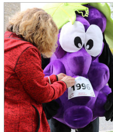
Auch das Träuble bekommt eine Startnummer angesteckt

Den symbolischen Stafelstab in Form eines Wattestäbchens wird im übertragenen Sinne von Bürgermeister zu Bürgermeister überreicht. Denn, wenn der Lebenslauf in Weingarten endet, beginnt der Lebenslauf in Königsdorf. Anmeldungen für die Weingartner Ausgabe sind bis Ende der Woche unter www.blutev.de noch möglich.