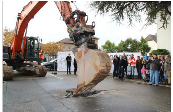
der Baggerbiss am 8. Mai 2015