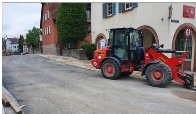
Im Kreuzungsbereich ist die Asphaltdecke bereits eingebaut.

„Gerne hätten wir alle Beteiligten und vor allem die Anwohner zur Wiedereröffnung zu einem großen Festakt eingeladen, mit Programmpunkten, Essen und Trinken, in einer festlich geschmückten Jöhlinger Straße“