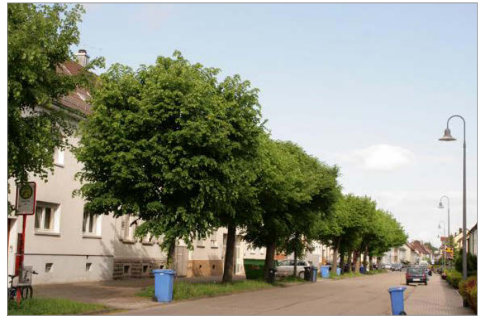
die alte Burgstraße vor 2015

Bundesinnenminister Horst Seehofer bringt es auf den Punkt: Städtebauförderung wirkt. Seit 50 Jahren.