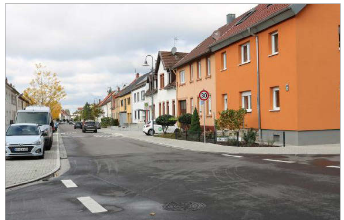
der fertiggestellte Abschnitt zwischen der B 3 und der Paulusstraße