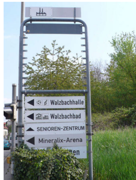
Im Weingarten der neunziger Jahre versuchte man, mit einem Orientierungssystem die Suche nach den wahllos verstreuten Gewerbebetrieben zu vereinfachen

Man kann es beim besten Willen kaum höflicher formulieren: Die Gewerbepolitik in Weingarten ist geprägt von mangelnder Struktur und Hilflosigkeit. Auch wenn man aus den Fehlern der Vergangenheit gelernt hat, muss aus Sicht der FDP-Fraktion die Vergabe der Flurstücke an die (hoffentlich zahlreichen!) gewerblichen Interessenten mit besonderer Sorgfalt und unter Berücksichtigung bestimmter Kriterien erfolgen. So wäre zu diskutieren, ob bereits existierende und erfolgversprechende örtliche Unternehmen Vorrang bei der Zuteilung genießen sollten.