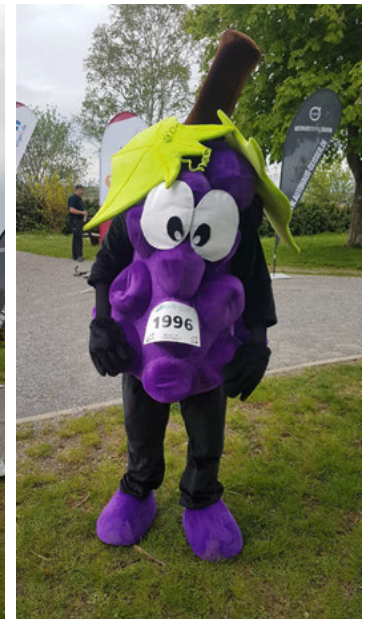
Weingartner Maskottchen Träuble kurz vor dem Start

um das Startpaket für die Läufer noch vor dem Start in den Briefkasten zu werfen, aber es ist uns gelungen und wir möchten uns bei allen die jetzt die nächsten vierzehn Tage laufen und Kilometer und Spenden sammeln recht herzlich bedanken.