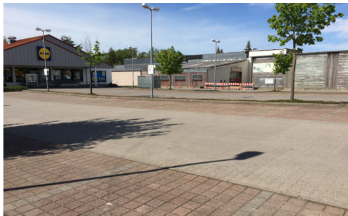
Auf diesem Kundenparkplatz könnte eine Schnellladestation stehen.

Der Güterverkehr soll verstärkt auf der Schiene erfolgen. Es geht um die Bahnverbindung Genua-Rotterdam, bei der die Bundesrepublik im Gegensatz zur Schweiz in Verzug ist. Das wird auch Auswirkungen auf die Region zwischen Karlsruhe und Mannheim haben. Die DB hat dazu unter Beteiligung eines Dialogforums eine Untersuchung