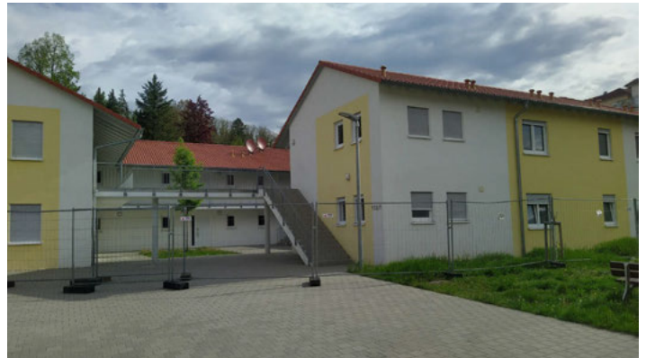
Gemeinschaftsunterkünfte in der Jöhlinger Straße. Künftige Nutzung der ehemaligen Asylunterkünfte umstritten.