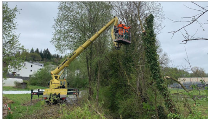
Verkehrssicherungsarbeiten am Walzbach