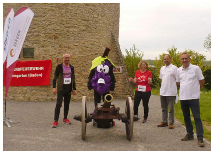
Alles bereit für den Startschuss zum Weingartner Virtual run 2021.

Corona bedingt kann auch in diesem Jahr der Benefizlauf von Blut e.V. nicht wie gewohnt stattfinden. Doch einfach ausfallen lassen und auf das nächste Jahr verschieben kam für die Organisatoren nicht in Frage.