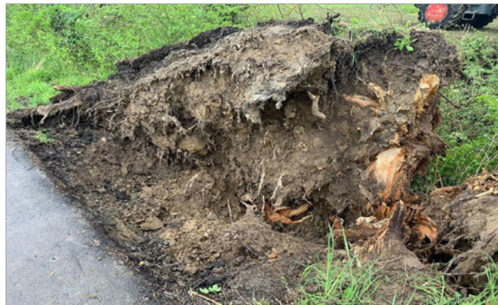
Fünf Weiden wurden komplett entwurzelt

Fünf Weiden fallen stürmischem Wetter zum Opfer