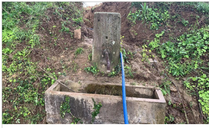
Der Brunnen im Sallenbusch

Die alte Gusswasserleitung am Brunnen in der Sallenbusch-Siedlung ist gebrochen und musste durch eine neue Leitung aus Kunststoff ersetzt werden. Die Arbeiten hat das Bauhof-Team Ende der Woche