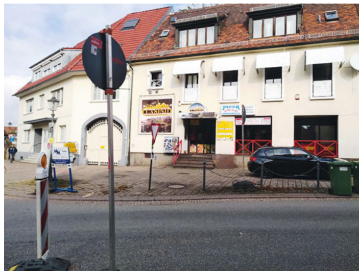
Leider kein Platz für einen „richtigen“ Kreisel - LKW entlang der BAB Umleitungsstrecke überfahren zugepflasterten Minikreisel

Die WBB-Fraktion bekräftigte ihre bereits bei der Haushaltsverabschiedung 2020 angedeutete Ablehnung eines Minikreisverkehrs an der zentralen und ortsbildprägenden Stelle mit historischem Ensemble zwischen Tulla-Brücke, Rathaus, Wartturm und Walk'schem Haus. Zwar habe die vom Planungsbüro ins Spiel gebrachte und von der CDU unterstützte Kreisellösung durchaus auch gewisse Vorteile, in der Gesamtabwägung kommt die WBB jedoch zum Ergebnis, die bestehende Einmündungssituation so zu belassen. Die bisherigen Planungen der gesamten Jöhlinger Straße auf Verkehrsberuhigung und Schutz schwächerer Verkehrsteilnehmer würden konterkariert, erzeugt man durch die Gleichberechtigung von Bundes- und Landstraße eine künftig zu befürchtende Sogwirkung des überregionalen Verkehrs. Die Gemeinde müsste trotz zweier klassifizierter Straßen den Kreisel als „Freiwilligkeitsleistung“ komplett und ohne Zuschüsse zunächst selbst finanzieren, ein undenkbares Szenario in Zeiten der Corona-Pandemie mit ihren massiven finanziellen Auswirkungen auf die Kommunen.