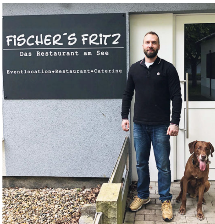
Behinderten- und Rehabilitationssportverein Weingarten e. V.

Durch viel Platz im Restaurant, im Wintergarten und auf der großen überdachten Terrasse können Sie mit ausreichend Abstand und Blick auf den Baggersee das gute Essen genießen.