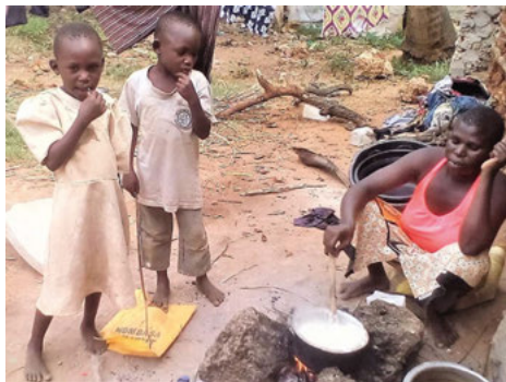
Tumaini Schüler im Lock Down

Der Freundeskreis bedankt sich beim Verein Bürger helfen Bürgern e.V. für seine Initiative, den Erlös aus dem Verkauf von Schutzmasken an DZARINO CBO zu spenden. DANKE!