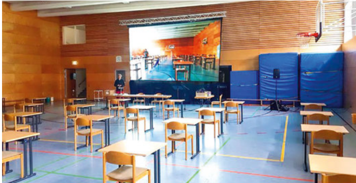
Großes „Schul-Kino“ am Gymnasium St. Paulusheim