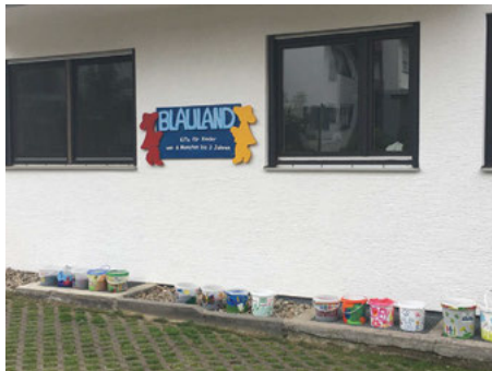
U3-Betreuung in der KiTa Blauland, Auf der Setz

Die SPD-Fraktion hat die umfangreichen Arbeiten der Verwaltung bezüglich der Bedarfsplanung als positives Signal für unsere kinderfreundliche