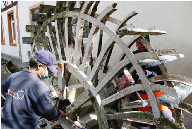
Mit dem Bohrmeißel rücken die Männer des Bauhofs den Verkrustungen zu Leibe

Die Verkalkungen sind massiv und schwer zu entfernen. Mit dem Bohrmeißel arbeiten die beiden Männer des gemeindlichen Bauhofes daran, das Stahlgestänge des Wasserrads im Walzbach zu säubern. Die Schaufeln sind bereits größtenteils abmontiert. Diese Reinigungsarbeit sei der letzte Schritt, nach dessen Fertigstellung die alten verbrauchten Holzschaufeln durch neue Kunststoffschaufeln ersetzt werden können, berichtete Wolfgang Wehowsky, Vorsitzender des Bürger-Heimatvereins, in dessen Verantwortung das Wasserrad betrieben