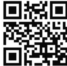
Direkter Link zum Informationsportal von Stadt- und Landkreis Karlsruhe