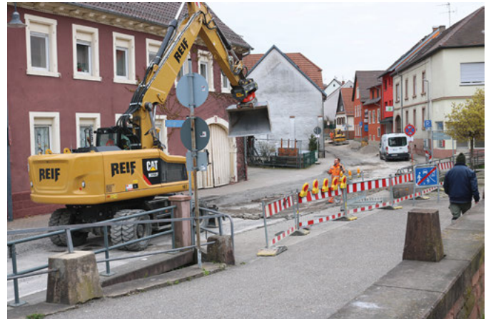
Der erste Arbeitstrupp befindet sich zu diesem Zeitpunkt auf Höhe der Dehn's Brücke

Dennoch gehen die Arbeiten zügig voran, aber Prognosen bezüglich Zeitangaben sind derzeit kaum möglich.