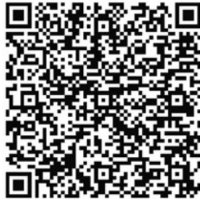
Direkter Link zur Gemeinde-Homepage unter „Corona-Virus - Infos kompakt“

Es gilt weiterhin die aktuelle Corona-Verordnung der Landesregierung und die damit eingehenden Einschränkungen. Weitere Hinweise und Mitteilungen in Zusammenhang mit dem Coronavirus finden Sie tagesaktuell online auf der Homepage der Gemeinde unter www.weingarten-baden.de .