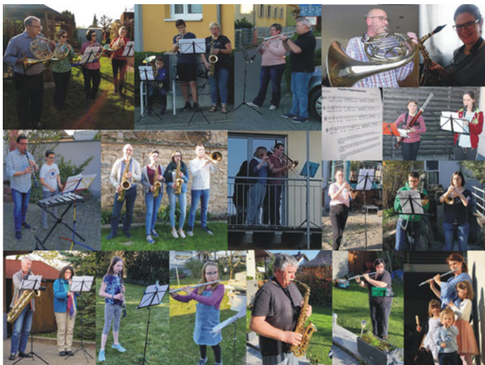
Mehr Musik am Fenster

Eigentlich wollten wir am letzten Sonntag unser 52. Frühjahrskonzert präsentieren. Stattdessen haben viele von uns Weingartener Musikern wieder mit Musik vom Balkon oder am Fenster Weingarten und andere Orte zum Klingen gebracht - manche zusammen in der Familie, andere über die Straße oder den Gartenzaun mit den Nachbarn und in jedem Fall alle zusammen mit vielen Musikern in ganz Deutschland. Als neues Stück erklang diese Woche das Irische Segenslied „Möge die Straße uns zusammenführen“. Am kommenden Sonntag musizieren wir wieder um 18.00 Uhr aus dem Fenster. Alle sind eingeladen mitzumachen oder zuzuhören, Musik verbindet uns alle.