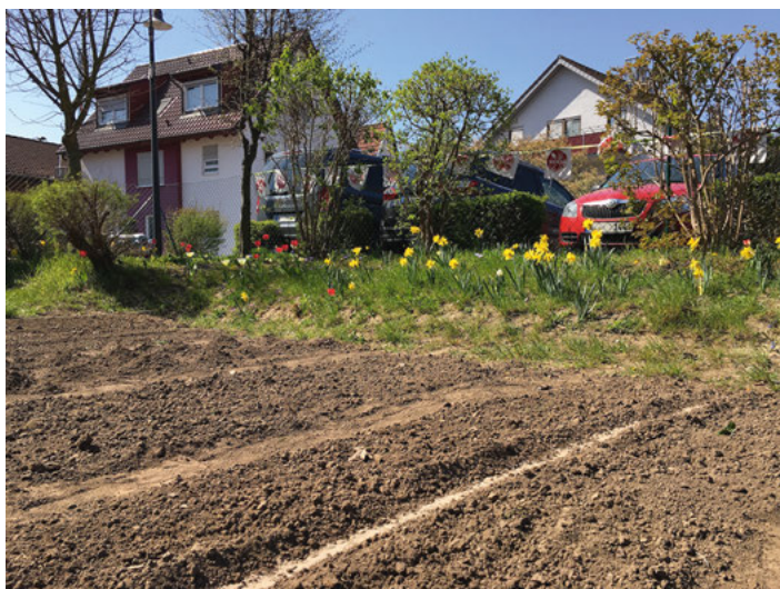
Noch sieht es unscheinbar aus, aber Radies und Karotten stehen in den Startlöchern für die neue Saison am ACKER

Dem Frühling ist die Coronakrise egal - mit aller Macht bringt er das Leben auf Wiesen und Feldern hervor.