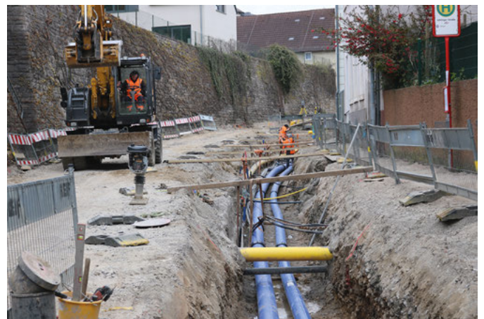
Die blauen Rohre sind die Versorgungsleitungen der Hoch- und Niederzone. Hier arbeitet der zweite Baustrupp