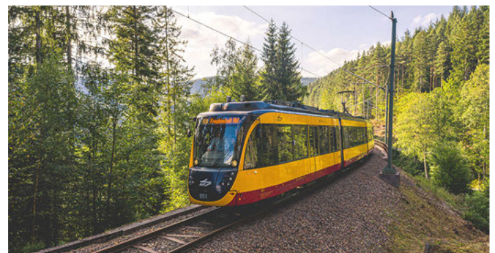
Die AVG wird ihren Fahrgästen auch in den kommenden Wochen ein stabiles Grundangebot auf den Stadtbahnlinien

Deshalb dünnt die AVG in einer ersten Stufe das Fahrplanangebot auf den Linien S1/S11 ab Montag, 23. März, aus. Die Fahrplanreduzierung ist ein notwendiger Schritt, um die Zuverlässigkeit der verbleibenden Fahrten zu gewährleisten. Die AVG bittet ihre Fahrgäste um Verständnis. Die geänderten Fahrpläne sind bereits online in den Reiseauskunftsmedien des KVV ( www.kvv.de ) und des Landes Baden-Württemberg ( www.efa-bw.de ) abrufbar. Um für einen ausreichenden gesundheitlichen Schutz der Fahrgäste zu sorgen, setzt die AVG zudem längere Züge ein und führt alle Fahrten in Doppeltraktion durch. Durch die damit erweiterten Platzkapazitäten können die Fahrgäste während der Fahrt den von den Gesundheitsbehörden empfohlenen Mindestabstand zu anderen Fahrgästen einhalten.