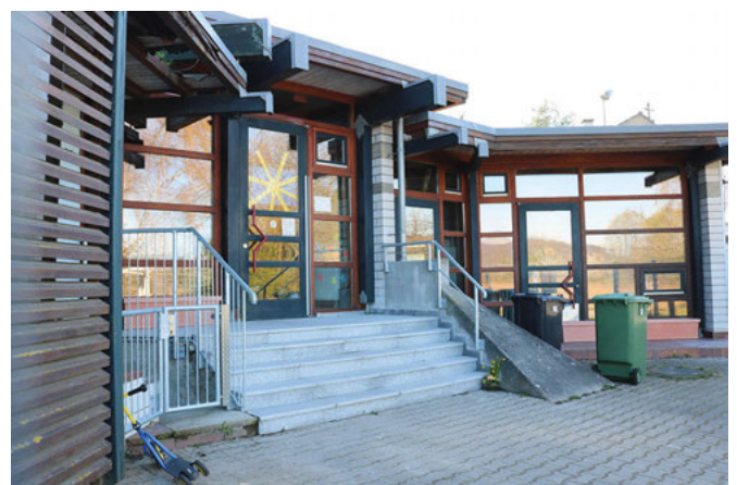
Das ehemalige Vereinsgebäude des Turn- und Sportvereins (TSV) Weingarten am Buchenweg im Ortsteil Waldbrücke

Obwohl zurzeit alle Kinderbetreuungseinrichtungen geschlossen haben, laufen die Planungen und Anmeldungen im Hintergrund weiter. Im Bereich Kleinkinder von unter drei Jahren (U3) zeichnet sich trotz intensiver Maßnahmen der Gemeinde für den Planungszeitraum 2020 bis 2022 ein Defizit von zwei zusätzlichen Gruppen ab. Nach Möglichkeit soll eine „Tiger“ (Tagespflege in anderen geeigneten Räumen)-Gruppe unterstützt und die Möglichkeit des Ausbaus der evangelischen Kinderkrippe Zauberwald im Dachgeschoss geprüft werden. Eine Tiger-Gruppe könnte sieben bis neun zusätzliche Betreuungsplätze bringen. Eine entsprechende Vereinbarung mit dem Tageselternverein Bruchsal hat die Gemeinde bereits vorbereitet, nur sei leider noch keine geeignete Räumlichkeit gefunden, heißt es aus dem Rathaus. Aktuell stehen insgesamt 122 Betreuungsplätze für Kinder unter drei Jahren zur Verfügung, davon 93 Plätze in Einrichtungen und 19 Plätze bei Tageseltern. Mit der Eröffnung der dritten Gruppe im Blauland erreichte die Versorgungsquote für unter dreijährige Kinder rund 36 Prozent. Eine Versorgung von 45 Prozent sei anzustreben.