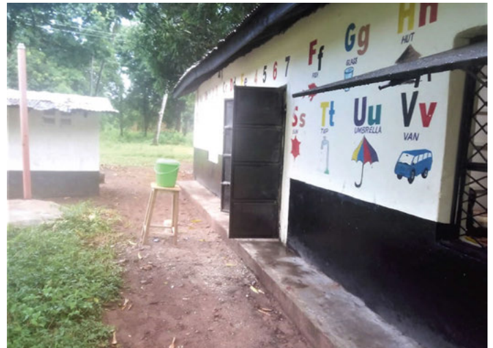
Schule geschlossen! Wie lange?

Auch unsere Partnerorganisation DZARINO CBO in Mombasa ist von den Auswirkungen der Corona-Epidemie betroffen. Aufgrund der engen Wohnverhältnisse und der mangelhaften hygienischen Bedingungen wird die Seuche sich dort wahrscheinlich noch schneller und mehr ausbreiten als hier bei uns. Die von DZARINO CBO getragene TUMAINI-Vorschule ist auf staatliche Anordnung für mindestens drei Wochen geschlossen, um die Infektkette zu unterbrechen. Ob das so gelingen wird, ist zweifelhaft. In dieser Zeit muss jedoch dringend die von der staatlichen Schulverwaltung geforderte Toilettenerweiterung durchgeführt werden, damit der Schulbetrieb möglichst rasch wieder aufgenommen werden kann. Die Ausführung der Baumaßnahmen ist fraglich. Der Vorstand des Freundeskreises hat beschlossen, 400 EUR dafür auf jeden Fall zur Verfügung zu stellen. Ferner ermöglichen die seit Anfang des Jahres eingegangenen Spenden, dass wir uns auch an der Finanzierung der