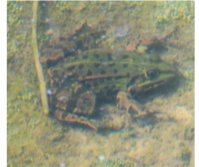
Frosch und Laich im Wasser

Dass wir uns überhaupt die Frage nach Unterscheidung zwischen Molch und Eidechse stellen können, ist hier in Weingarten auch ihr Verdienst!