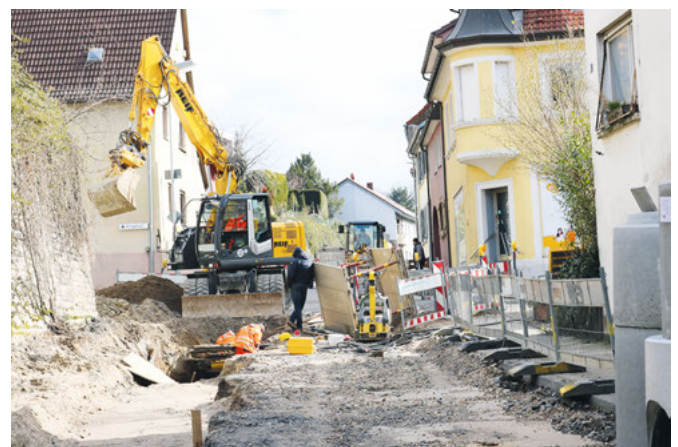
Der dritte Bauabschnitt beginnt am Katzenbergweg. Der Weg zum Friedhof ist fußläufig begehbar.