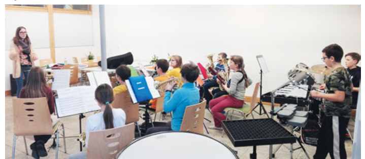
... Schülerorchester proben in Herrenwies