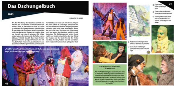
„Das Dschungelbuch“ von 2013: Nur eine der vielen bunten Seiten in unserer Festschrift

An alle Freunde und Interessierte an der Theaterkiste und an die, die es noch werden wollen! Wer blättert nicht gerne mal im Familienalbum? „Wie die Zeit vergeht“ ist dann die wohl meist getätigte Äußerung. Wie schnell auch den Theaterkistlern die Zeit seit ihrem ersten Stück vergangen ist, dokumentiert eine Festschrift anlässlich des 25. Vereinsjubiläums. Denn ohne den Räuber Hotzenplotz hätte es nie eine Weingartener Theaterkiste gegeben. Auf 88 Seiten zeigen viele Bilder und Texte Impressionen von den Anfängen bis heute. Wer die Theaterkiste schon lange kennt, erwirbt damit einen bunten Bilderbogen von Erinnerungen. Wer sie gern kennenlernen will, erfährt eine Menge Interessantes aus der Vergangenheit. Das Buch ist bei allen Aufführungen von „Sindbad, der kleine Seefahrer“ an der Tageskasse gegen eine geringe Schutzgebühr erhältlich. <Platzhalter Jub-Pub-Seite-Dschungelbuch>