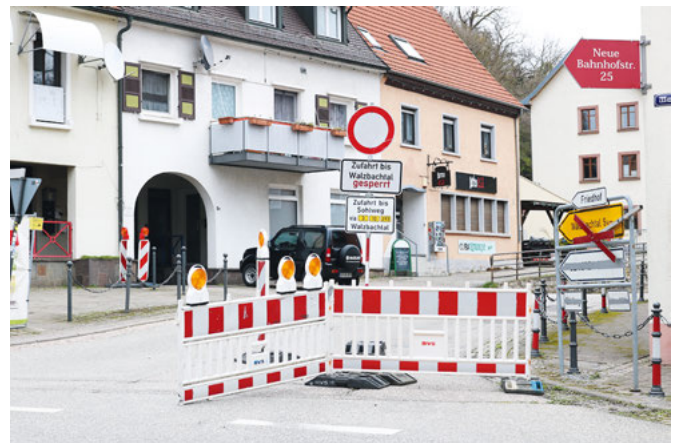
Unübersehbar ist das Schild „Durchfahrt verboten“ am Knotenpunkt Bundesstraße 3.

Für weitere Fragen ist Gerd Weinbrecht im Rathaus unter der Telefonnummer 702040 erreichbar oder Bauleiter Heiligenstein unter 0172/724 3718. Die Präsentation ist unter www.weingarten-baden.de zu finden.