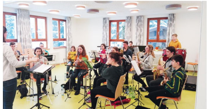
Jugendorchester und ...

erhalten Sie im Vorverkauf ab Mitte März bei den Musikern sowie an der Abendkasse. Kinder und Jugendliche unter 16 Jahren haben freien Eintritt. Wir freuen uns auf Ihren Besuch!