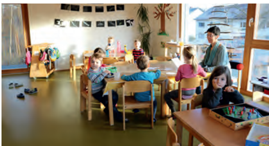
Die Nachfrage nach Kindergartenplätzen steigt rasant. Hier eine Szene aus dem Kindergarten „Waldbrücke“, der im kommenden Jahr um zwei weitere Gruppen erweitert werden soll.