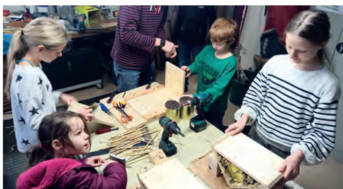
AGNUS-Jugend-Kinder in der Winterwerkstatt