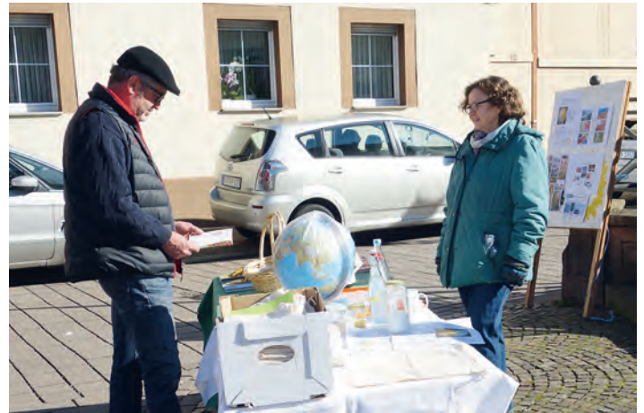
Infostand zur Vortragsveranstaltung „Unser Leben im Wegwerfmodus - Geht es auch plastikfrei?“

Die Finanzen sind solide. Die Europa-, Kreistags- und Kommunalwahlen werden die nächsten Monate bestimmen. Info- und Wahlstände sollen angeboten, eine Wahlbroschüre und ein Erstwählerbrief erstellt werden. A. Hammen