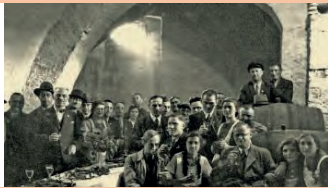
Weinprobe im Grundschulkeller 1937.

Klaus Geggus Um ihre Naturalien und insbesondere den Wein gut zu lagern, haben unsere Vorfahren schlauerweise Gewölbekeller gebaut.