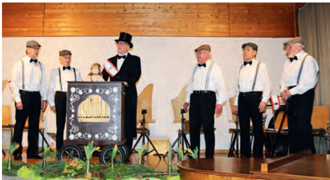
Die Lyra-Singers aus Durlach