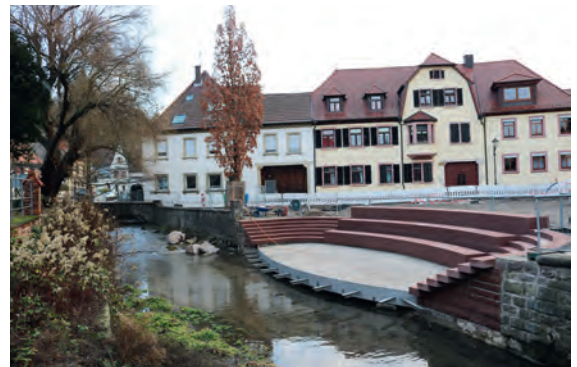
Die Bachbühne zum Walzbach wird auf dem Kirchplatz ein ortsbildprägendes Element werden