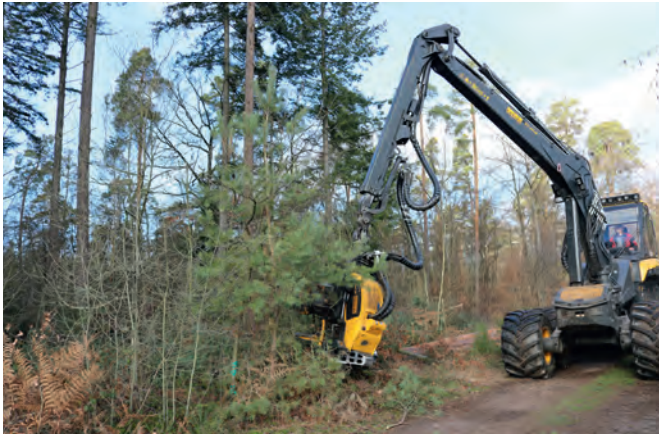
Eine Baumfällmaschine räumt die mit Kiefern und Douglasien bestandene Fläche ab