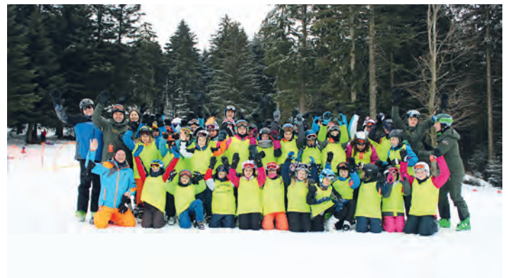
Die Große Ski-Club Stabil Schar am Hundseck