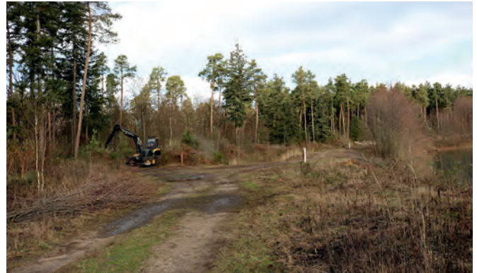
Am linken Bildrand ist der Holzernter zu sehen, am rechten Bildrand das westliche Seeufer. Ab der Bildmitte erstreckt sich eine große Freifläche nach Norden, auf der sich die Ausgleichsmaßnahmen für Zauneidechsen befinden.

Am westlichen Rand des Weingartner Baggersees haben die Arbeiten zur Erweiterung des Kiesabbaus begonnen und werden sich Richtung Westen fortsetzen. Als Gesamt-Erweiterungsfläche hat der Gemeinderat bereits in 2014 eine Fläche von 5,9 Hektar bewilligt. Begonnen wird zunächst mit einer mit Douglasien und Kiefern bestandenen Teilfläche von 2,7 Hektar. Eine Forstarbeitsfirma übernimmt im Auftrag der Gemeinde die Holzernte, die Rodungsarbeiten der Baumstümpfe und im Boden befindlichen Wurzelstöcke übernimmt die Firma Mineralix. Denn die langjährige Pächterin des Kieswerks, Firma Scherrieble, hat ihre Abbaurechte an die Firma Mineralix von der Grötz-Gruppe verkauft. Diese ist auch zuständig für den darauffolgenden Bodenabtrag. Der Wald müsse innerhalb von drei Jahren wieder aufgeforstet sein, berichtet Förster Michael Schmitt, aber nicht