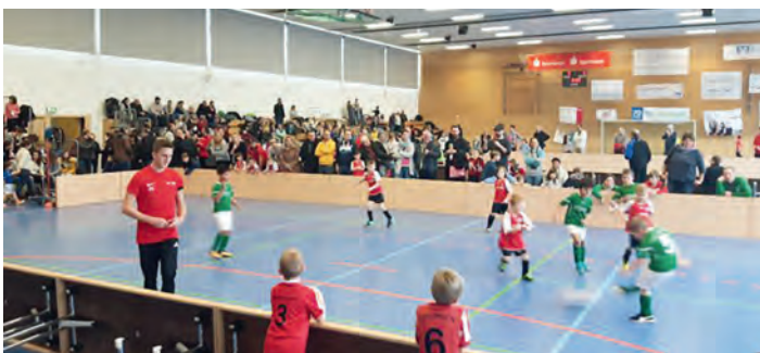
Budenzauber in der Walzbachhalle