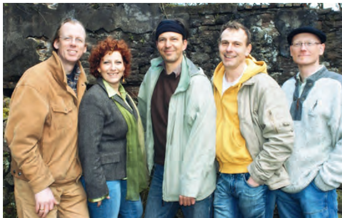
Pressefoto Duple Tonic

Hinweis: Kelleröffnung um 19 Uhr; Abholung vorbestellter Karten bis spätestens 19.30 Uhr