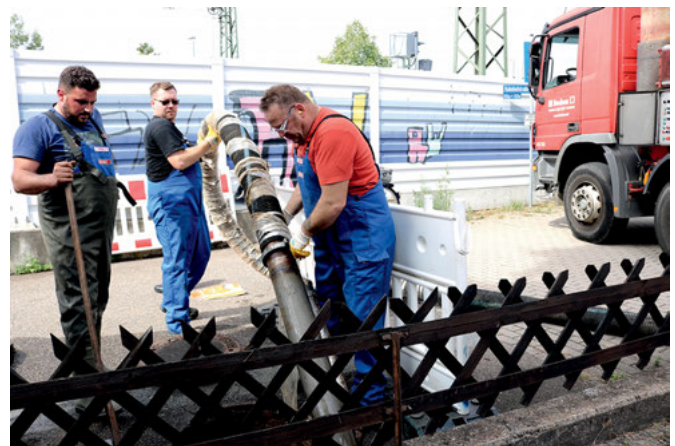
Mit dem dicken Schlauch eines Saugwagens versuchen die Mitarbeiter den Schlamm aus der Verdolung zu holen

Es ist alles andere als eine leichte Arbeit und funktioniert nicht auf Antrieb. Der Saugrüssel saugt nur Wasser, zu fest ist der Schlamm. Da hilft nur eins: In den Schacht steigen und den Schlamm mit der Hacke lockern. Der Einstiegsschacht ist eng, der Mitarbeiter der Firma kann nur mit angelegten Armen einsteigen. Außerdem ist das Arbeitsgebiet so niedrig, dass er knien muss. Jetzt geht es. Die Klumpen lassen sich mit der Hacke deutlich zerkleinern. Erneut kommt der Saugrüssel zum Einsatz. Saugen und Spülen. Am nächsten Tag wird die Firma mit einem größeren und noch kraftvolleren Saugwagen kommen. Aber den schlimmsten Teil haben die Männer noch vor sich. 50 Meter beträgt der Abschnitt zwischen Einstieg und Ziel, in dem sie sich nur kriechend und komplett im Dunklen, mit Stirnlampen ausgerüstet, fortbewegen können. Das Licht am Ende des Tunnels kann wörtlich genommen werden.