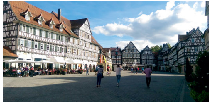
GV Frohsinn: Fachwerk an der Rems

Die Remstal-Gartenschau war Ideengeber für den diesjährigen Ausflug des GV Frohsinn. Strahlender Sonnenschein, der uns den ganzen Tag begleitete, erwartete uns in Schwäbisch Gmünd. Bereits die Städteinfahrt beeindruckte durch üppige Blumenarrangements und die renaturierte Rems. An deren Ufer erstrahlt das neue Wahrzeichen Gmünds, der futuristische Würfel der Hochschule für die Gold- und Silberschmiedekunst. Das Frühstück fand im idyllisch gelegenen historischen Spitalhof statt, umgeben von prächtigen alten Gebäuden und der modernen Plastik „Das Paradies“. Anschließend zeigte uns die charmante und schlagfertige Stadtführerin, eine schwäbische Italienerin, die Bauwerke aus acht Jahrhunderten. Auf dem Marktplatz, einem der schönsten und größten Süddeutschlands, begrüßte uns Chorablasen vom Turm der Johanniskirche. Wir erfuhren, dass Gmünd die älteste Stauferstadt ist, und die Geschichte dieses Adelsgeschlechts verfolgt einen auf Schritt und Tritt. Die Innenstadt beeindruckt mit zahlreichen Bauwerken von der Romanik bis zum Spätmittelalter.