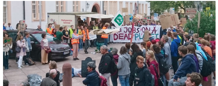
Demonstration gegen das Klimapaket bei der Regionalkonferenz der SPD in Ettlingen

und Scientists for Future, gegen das Paket demonstrieren, wie z.B. am vergangenen Montag auf der Regionalkonferenz der SPD in Ettlingen. Die GRÜNE LISTE WEINGARTEN treibt das Thema lokal voran und trifft sich deshalb diesen Donnerstag, 26.09.2019, um 19 Uhr.