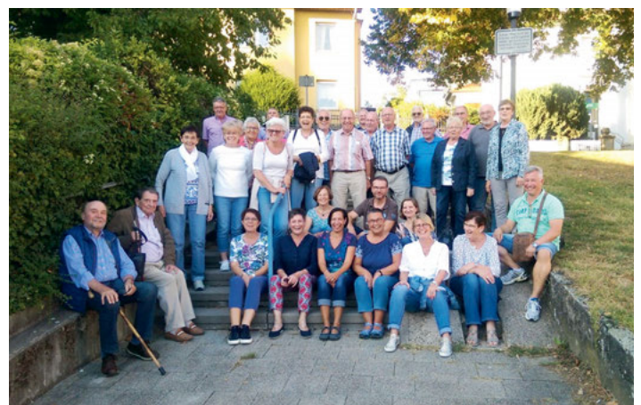
GV Frohsinn: Ausflug nach Schorndorf und Schwäbisch Gmünd

Die Remstal-Gartenschau war Ideengeber für den diesjährigen Ausflug des GV Frohsinn. Strahlender Sonnenschein, der uns den ganzen Tag begleitete, erwartete uns in Schwäbisch Gmünd. Bereits die Städteinfahrt beeindruckte durch üppige Blumenarrangements und die renaturierte Rems. An deren Ufer erstrahlt das neue Wahrzeichen Gmünds, der futuristische Würfel der Hochschule für die Gold- und Silberschmiedekunst. Das Frühstück fand im idyllisch gelegenen historischen Spitalhof statt, umgeben von prächtigen alten Gebäuden und der modernen Plastik „Das Paradies“. Anschließend zeigte uns die charmante und schlagfertige Stadtführerin, eine schwäbische Italienerin, die Bauwerke aus acht Jahrhunderten. Auf dem Marktplatz, einem der schönsten und größten Süddeutschlands, begrüßte uns Chorablasen vom Turm der Johanniskirche. Wir erfuhren, dass Gmünd die älteste Stauferstadt ist, und die Geschichte dieses Adelsgeschlechts verfolgt einen auf Schritt und Tritt. Die Innenstadt beeindruckt mit zahlreichen Bauwerken von der Romanik bis zum Spätmittelalter.