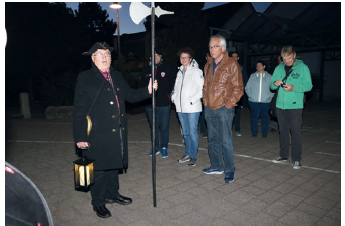
Rund 40 interessierte Bürger folgten dem Nachtwächter auf seinem spannenden Rundgang durch den alten Ortskern