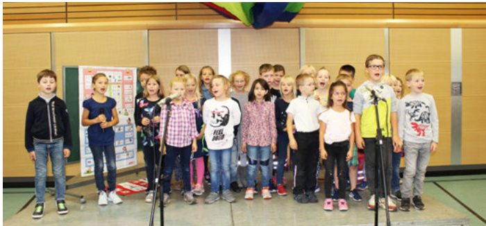
Mit einem Lied von Rolf Zuckowski „Schön dass ihr hier seid“ begrüßten die Zweitklässler die Primaner