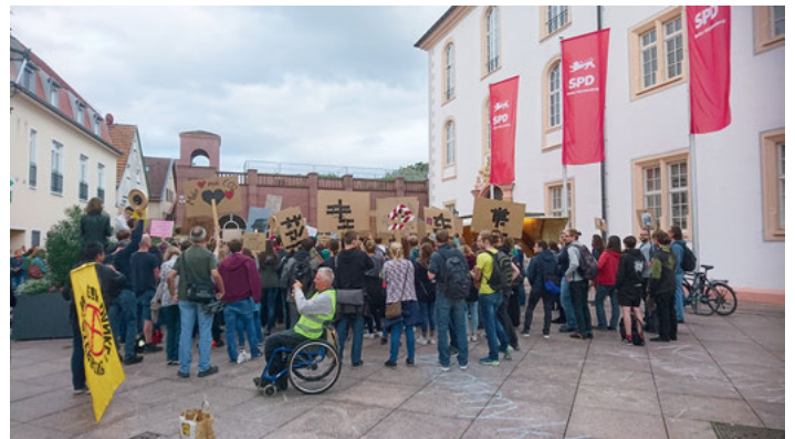
Demonstration gegen das Klimapaket bei der Regionalkonferenz der SPD in Ettlingen