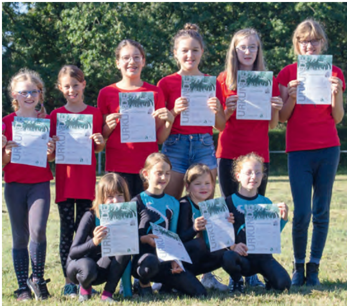
Voltingierer aus Friedrichstal und Weingarten