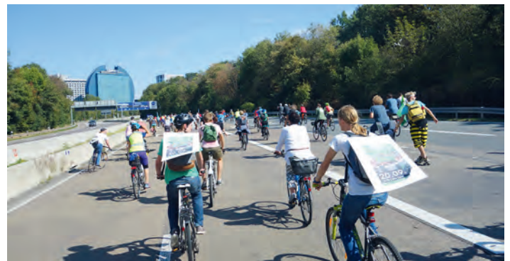
Fahrradsternfahrt durch Frankfurt gegen die IAA auf gesperrten Autobahnen

Und bei der IAA in Frankfurt wird gegen die Verkehrspolitik der Autohersteller und des Bundesverkehrsministers demonstriert. Tausende Fahrradfahrer demonstrieren friedlich mit einer Sternfahrt nach und durch Frankfurt, wofür zeitweise auch Autobahnen und die Innenstadt gesperrt wurden.