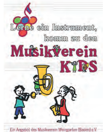
Ein Angebot des Musikverein Weingarten (Baden) e.V.