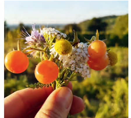
Mach' der Welt eine Freude? und setz' Dich ein fürs Klima!

Jede/r von uns kann und muss im Alltag klimafreundlich handeln. Dafür gibt es viele Wege und auch bei uns im Ort kluge und kreative Ansätze. Um darüber in Austausch zu kommen lädt die Solawi Gutes Gemüse für den Folgetag des Klimastreiks am Samstag, den 21.09 von 11 bis 13 Uhr in ihren Walzbachgarten* auf einen gemeinsamen Brunch ein (*Der Garten befindet sich am Ortsausgang Richtung Jöhlingen noch hinter dem Haus Edelberg und ist vom Bach her zugänglich).