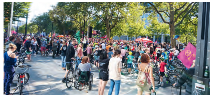
Demonstration in der gesperrten Innenstadt von Frankfurt gegen die IAA