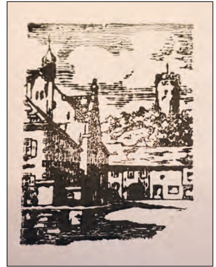
Ein Klischee-Druck mit dem bekannten Weingartner Motiv Marktbrücke und Wartturm