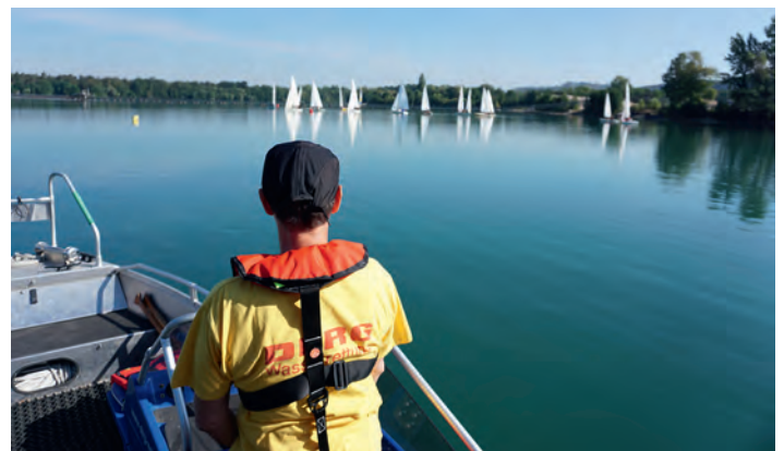
Absicherung der Segelregatta auf dem Baggersee

Die Bauarbeiten werden auch weiterhin fortgesetzt, solange es die Witterung erlaubt. Für die Bodenplatte, die voraussichtlich im Oktober betoniert werden soll, sind an den nächsten Wochenenden noch einige Vorbereitungen notwendig. Die DLRG-Ortsgruppe wartet sehnsüchtig auf die Baugenehmigung!