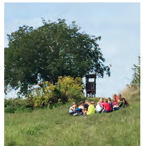
Picknick auf dem Weg

Eigentlich wollte die Wildnisgruppe der AGNUS-Jugend als Ausklang vor den Sommerferien Grillen und im Wald übernachten, doch ein Gewitter ließ den Termin ins Wasser fallen. Nun als Auftakt nach dem Sommerferien spielte das Wetter von Freitag, 13. bis Samstag, 14. September super mit. Freitag-Nachmittag trudelten die ersten Kinder ein, um ihre Zelte aufzubauen und die Grillstelle vorzubereiten. Bis zum Abend waren