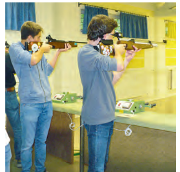
Konzentriert wurde mit dem Luftgewehr auf Glücksscheiben geschossen.