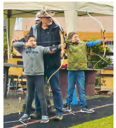
Mit Eifer ging es ans Bogenschießen, gab es doch ein leckeres Salamipaket zu gewinnen.