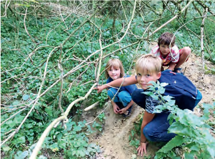
AGNUS-Jugend-Kinder zeigen auf den Fuchsbau

alle beisammen. Ein Dutzend mutiger Kinder verbrachte bei Lagerfeuer, artistischen Übungen, Schwertkämpfen, indianischen Anschleichspielen - in völliger Dunkelheit -, Feuerspeier und Waldwanderung inklusive, eine herrlich spannende, gleichzeitig harmonische Übernachtung. Kulinarisches, von Aschbrot, Gegrilltem (vegetarisch wie klassisch) bis hin zu Schokobananen, ließ für die jungen Gourmets keine Wünsche offen. Schlag Mitternacht wurde dann gemeinsam in den Schlaf gemunkelt, der dann immer wieder durch die lauten wie langen Rufe der Käuzchen unterbrochen wurde. Die Siebenschläfer, die sich in den Bäumen ringsum tummelten, verschliefen die meisten. Nach reichhaltigem Lagerfeuerfrühstück, sogar mit warmen Kakao, brachen alle auf zur Fuchsburg. Es wurde gekämpft, gewandert und balanciert. Kurz war die Zeit - und schön!