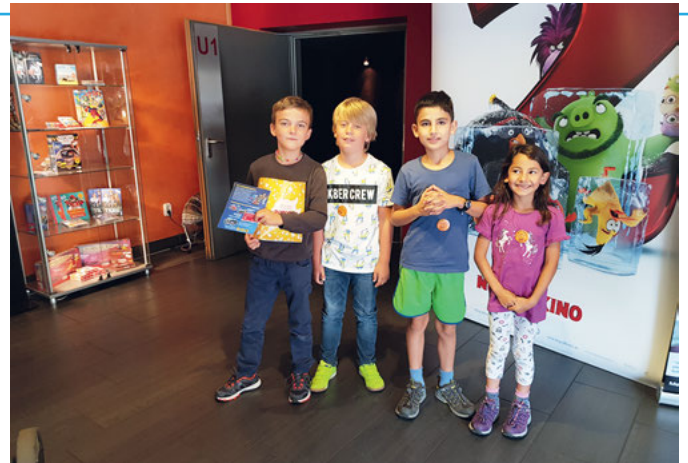
Die Kinder freuten sich auf das Kinoerlebnis