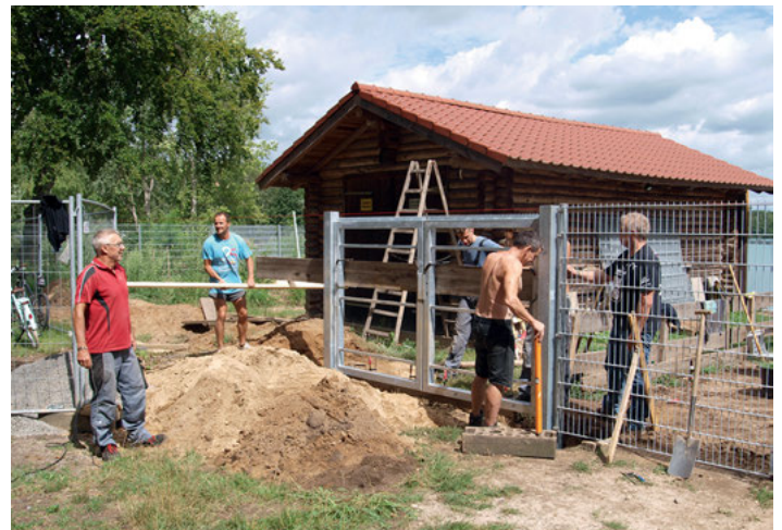
Arbeitseinsatz am 10.08.2019: Aufbau des Tores

Jetzt wartet die Ortsgruppe nach einem mühseligen Planungs- und Abstimmungsprozess sehnsüchtig auf die Baugenehmigung, so dass hoffentlich noch im Herbst diesen Jahres der Rohbau des neuen Bootshauses in Angriff genommen werden kann, leider ein halbes Jahr später als ursprünglich geplant.