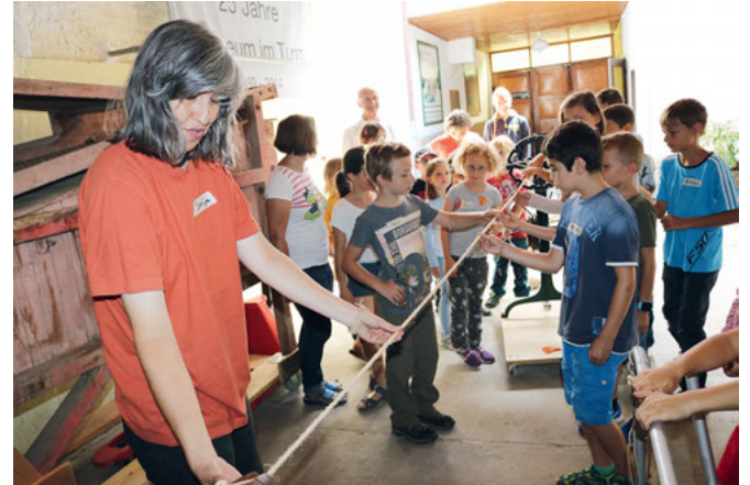
Die historische Seilmaschine

story werden würde. Einblick in die Vergangenheit und Bezug zur Gegenwart sind die beiden Faktoren, die diese Nachmittage so spannend machen. Die Antworten der Kinder flogen nur so: „Zum Klettern“, „zum Abschleppen“, „um die Ziege festzubinden“, „zum Seilspringen“ und mehr. „Genau: Die wichtigsten Funktionen sind Festbinden und Ziehen“, erklärte Güntner. Die ersten Seile seien schon in der Steinzeit aus Pflanzenfasern entstanden. Meist waren Pflanzen wie Hanf oder Sisal mit langen zähen Fasern der Ausgangsstoff für die handwerklichen Seiler. Dann übernahmen Maschinen die Arbeit und heute seien die Pflanzenfasern vorwiegend durch Kunststoff oder sogar Stahl ersetzt. Aber das Prinzip gelte immer noch, nämlich Haltbarkeit durch eine gedrehte, geflochtene oder geknüpfte Verbindung zu erzielen. Dann ging's mit Begeisterung ans Ausprobieren. Ein wirkungsvolles Hilfsmittel war die Zwillie, die zwei Schnüre zusammendreht und sehr schnell ein Ergebnis bringt. Etwas mehr Geduld erforderte das