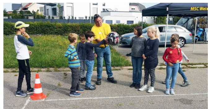
Sicherheit hat immer Vorrang. Auch das richtige Anlegen des Helms muss gekonnt sein.

Zu Beginn gab es erst einmal eine kurze Vorstellungsrunde, bevor schließlich eine Einweisung in das Kartfahren folgte. Zuerst wurde den Kindern das Kart erklärt. Wo ist das Gaspedal und wo die Bremse? Wie steige ich richtig in das Kart ein? Anschließend ging es auf die Strecke. Jedoch noch nicht mit dem Kart sondern zu Fuß. Denn auch die großen Formel-1 Fahrer schauen sich erst einmal die Strecke an, bevor sie darauf fahren. Die Streckenbegehung führte die erfahrenen Kartfahrer des MSC durch. Lernen von den Besten. Nun konnte es losgehen. Die erste FahrerIn machte sich bereit. Helm auf, Jacke an. Zuerst bestand die Aufgabe darin, den richtigen Bremspunkt zu finden. Auf der Strecke waren überall große gelbe Pylonen verteilt, welche man als Bremspunkt nutzen musste. Nach erfolgtem Stillstand ging es dann weiter zum nächsten Pylon. Hat das gut geklappt, folgte das richtige Racing. Jeder durfte jeweils 5 Minuten den mit Pylonen abgesteckten Parcours fahren. Sicherheit wird beim MSC groß geschrieben. Deshalb fuhr immer ein MSC-eigener Fahrer voraus. Das gab den Ferienspaßlern auch ein gutes Sicherheitsgefühl. Nachdem alle durch waren, gab es als Überraschung noch einen zweiten Durchgang. Ist jeder zweimal gefahren, war auch schon das Ferienspaßprogramm vorüber. Den Kindern hat's gefallen. Dafür opfert man fürs Ehrenamt gerne einen Urlaubstag. Im nächsten Jahr hofft der Verein, den Festplatz hinter sich zu lassen und schon auf dem neuen Vereinssportgelände Kart zu fahren.