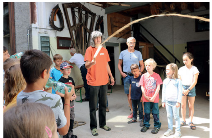
Die Zwillie arbeitet schnell und effektiv