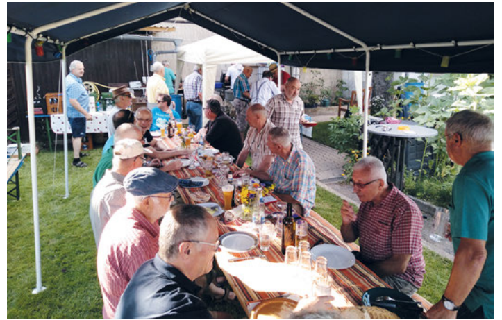
GV Frohsinn: Grillabend des Männerchors