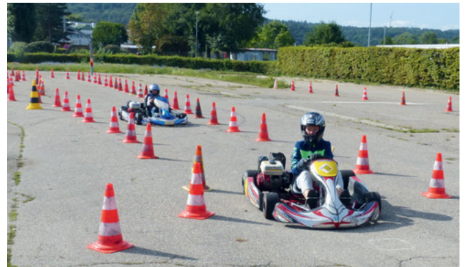
Um den jungen Kartfahrern ein gutes Sicherheitsgefühl zu vermitteln, fuhr immer ein MSC-eigener Fahrer voraus.

Am ersten Augusttag fand auf dem Festplatz in Weingarten das alljährliche Ferienspaßprogramm des MSC Weingarten statt. Bereits um 9 Uhr begann die erste Gruppe, bestehend aus 12 Kindern aus Weingarten. Um 13 Uhr dann die zweite Gruppe.