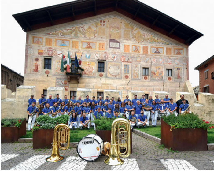
Banda Musicale Città di Staffolo