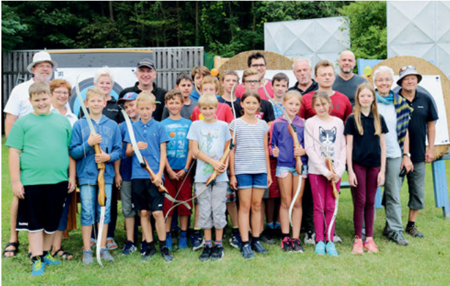
Gruppenbild beim Ferienpaß des Schützenvereins