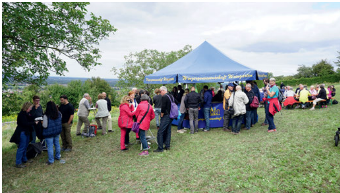
Weinwandertag - Wein probieren und die Aussicht genießen

Dort kann man den Tag bei Speis und Trank noch gemütlich ausklingen lassen. Neben alkoholfreien Getränken werden natürlich auch dort die Weingärtener Weinspezialitäten angeboten.