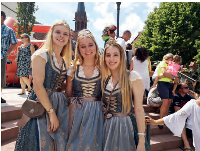
Die Weinhoheiten beim Zieleinlauf des Weingartner Entenrennens 2019

Nun geht es endlich für uns los. Unsere zweijährige Amtszeit beginnt. Schon eine Woche ist seit der Wahl vergangen. Für uns startete die Woche nach dem Wein- und Straßenfest eigentlich ganz normal. Bis auf den Unterschied, dass jetzt ein Krönchen unser Zuhause schmückt und am Wochenende schon die ersten Events auf uns warten. Am Sonntag, den 21. Juli, ging es für uns drei dann los. Denn alle Termi-