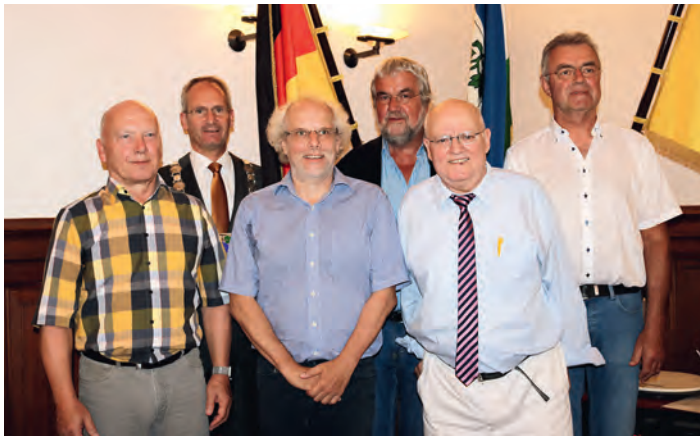
Der scheidende Gemeinderat

Anschließend rief der Bürgermeister die neuen Ratsmitglieder zu sich, verlas ihre Ernennungsurkunde und hieß sie mit Handschlag willkommen. Die wiedergewählten Mitglieder begrüßte er an ihrem Platz und überreichte ihnen ebenfalls die Urkunde. Er freue sich auf die Weiterführung der Aufgaben, begann er. In der bevorstehenden Klausur werden viele Themen erarbeitet werden, konzeptionell stehe das Thema Verkehr im Vordergrund. Das Vertrauen der Bürgerschaft habe ihnen zu diesem Mandat verholffen. Der Gemeinderat sei die kleinste Einheit der Demokratie. Aber er sei kein Parlament. Das bedeute, er sei kein Teil der Legislative, sondern der Exekutive und damit Teil der Verwaltung. Darum gebe es keine Regierungspartei und keine Opposition. Er bildet aber Mehrheiten der bürgerlichen Interessen ab. Der Gemeinderat habe als Ganzes zum Wohl der Bürger zu arbeiten. Er freue sich auf die Zusammenarbeit.