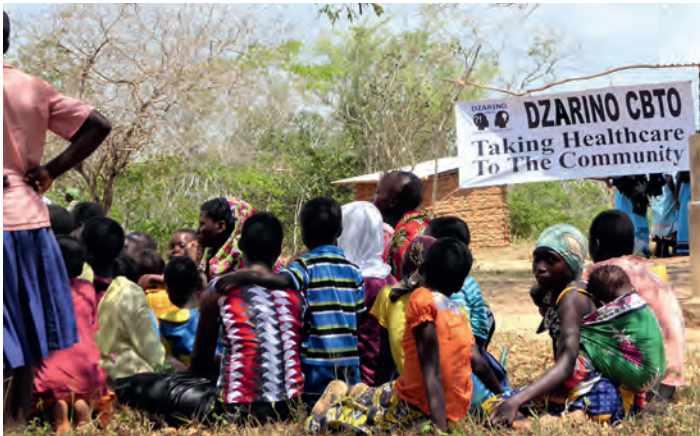
Warte-„zimmer“ im Medical Camp