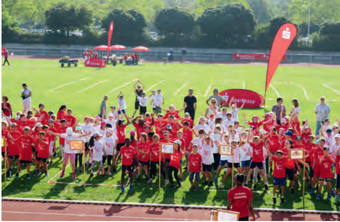
Das gemeinsame Aufwärmen mit Musik war der Auftakt zu jeder Menge Spaß und Bewegung.

Stoppuhr und Zentimetermaß gab es nicht, stattdessen sehr viel Spaß und Bewegung. So waren am Ende alle Kinder Gewinner und wurden obendrein mit einer Urkunde und ihrem „LA in Aktion“-T-Shirt belohnt.