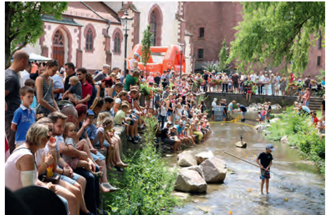
Gespannt verfolgten zahllose Zuschauer den Weg der Enten ins Ziel, vor allem im letzten Abschnitt

Die Losbesitzer suchten sich ein Plätzchen im Schatten und warteten bei einem kühlen Getränk, ob gewonnen oder nicht. Um ihnen die Zeit zu vertreiben, hatten sich die Veranstalter allerhand einfallen lassen. Magischer Anziehungspunkt für Kinder war eine Hüpfburg. Ein Tischkickerspiel war umlagert und wer wollte, konnte an den aufgebauten Tischen sein mitgebrachtes Picknick verzehren. Langsam verrann die Zeit, in der die Helfer die Losnummern der ersten 216 Enten, die ins Ziel gekommen waren, festhielten, bis um 17.30 Uhr die Sieger bekannt gegeben wurden. Sponsoren hatten ordentlich in die Tasche gegriffen und Sachpreise im Gesamtwert von 4.562 € gespendet. Aus dem Reinerlös der Lotterie wird Kolping auch dieses Jahr wieder den konfessionellen Weingartner Kindergärten eine Spende zukommen lassen.