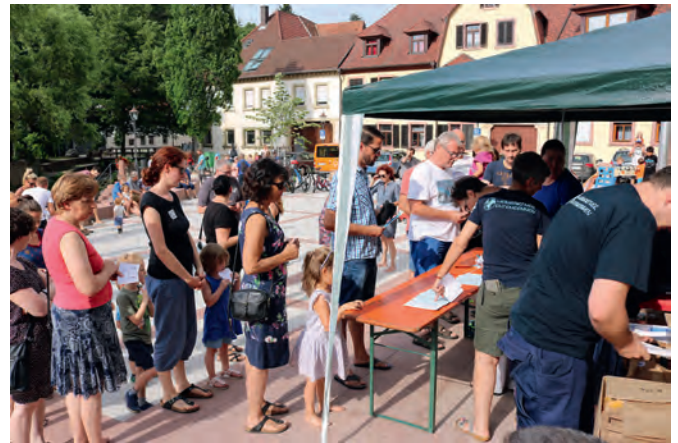
Am frühen Abend erfolgte die Preisausgabe. 216 Sachpreise im Gesamtwert von 4.562 € hatten die Sponsoren gespendet