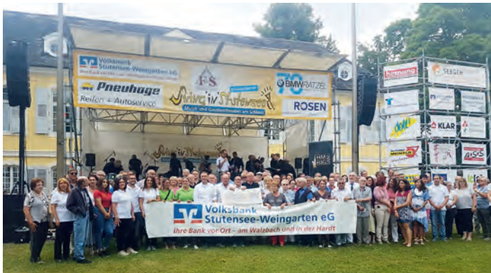
Auch der TC Kristall konnte sich über eine Förderung durch die Volksbank Stutensee-Weingarten freuen.

Am 07. Juli 2019 durften wir im Rahmen der Veranstaltung "Swing in Stutensee" einen Scheck in Höhe von 100,00 Euro entgegennehmen. Wir bedanken uns an dieser Stelle herzlich für die Unterstützung beim Jubiläum anlässlich unseres 10jährigen Vereinsjubiläums.