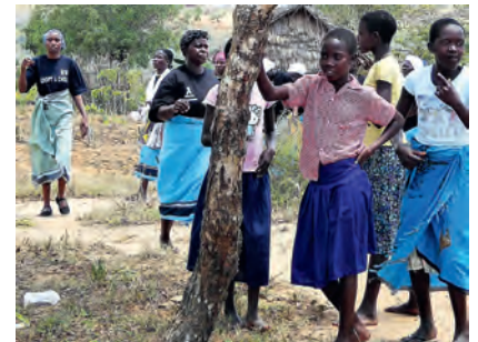
Eine besondere Zielgruppe

Der Vortrag am 29. Mai über Hilfe zur Selbsthilfe am Beispiel der Arbeit unserer Partnerorganisation im kenianischen Mombasa ist sehr gut aufgenommen worden. Wir konnten weitere Mitglieder gewinnen und die Spendensumme erhöhte sich, so dass wir dem gesetzten Ziel immer näherkommen: wir möchten unserem Partner zwei Drittel der Kosten des diesjährigen Medical Camps finanzieren. Dieses findet Anfang November im Distrikt Kwale südlich von Mombasa statt und richtet sich besonders an Frauen, Familien und Jugendliche aus den in allen Dingen unterversorgten ländlichen Bevölkerungsgruppen. Die regionale Gesundheitsbehörde stellt eine Mobile Klinik so wie Ärzte und medizinisches