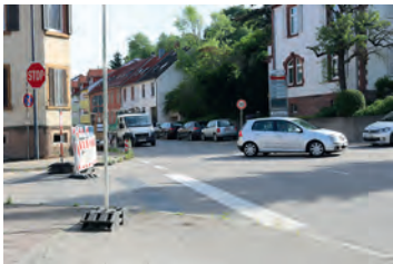
Kreuzungsbereich Burgstraße / Steigweg

Die Bauarbeiten im Kreuzungsbereich beginnen nach dem Straßenfest. Derzeit werde am Kreuzungsbereich Breitwiesenweg mit Hochdruck gearbeitet, um die Tiefbauarbeiten bis zum 12. Juli fertigzustellen. Danach werde die Straßendecke provisorisch geschlossen, damit die Straße als Umleitungsstrecke für die während des Straßenfestes vom 12. bis zum 14. Juli gesperrte Bundesstraße befahrbar sei.