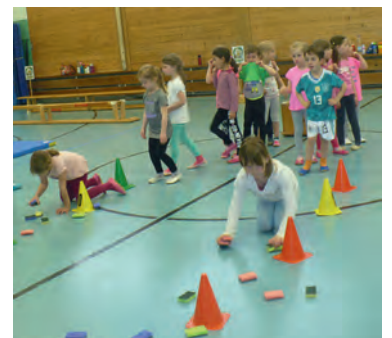
Eifrig werden Nüsse und Eicheln als Reiseproviant gesammelt.

Unterwegs finden sie viele leckere Eicheln und Nüsse, die sie schnell einsammeln und als Reiseproviant mitnehmen wollen. Doch nein! Was ist das? Der Duft dieser Leckereien hat Wildschwein Grunz angezogen. Schnell werden die Nüsse und Eicheln in ein Versteck geworfen und damit das Wildschwein sie nicht hört hüpfen alle auf leisen Sohlen davon. In Sicherheit, aber ohne Verpflegung, setzen sie ihren Weg zu Frau Eule fort. Voller Vorfreude auf das Geburtstagsfest kommen sie nach kurzer Zeit an einem Apfelbaum vorbei. Rasch werden mit gezielten Sprüngen ein paar Äpfel gepflückt. Das gibt ein super Apfelkuchen freuen sie sich. Nun ist es auch nicht mehr weit bis zum Haus von Frau Eule. Nur noch auf einem Baumstamm einen Fluss überqueren und danach über den kleinen Sumpf schwingen. Schon sehen sie das Ziel. Vor lauter Aufregung purzeln sie den Hügel hinab und landen direkt in Frau Eule's Garten, die sie auch schon sehnsüchtig erwartete. Da seid ihr ja endlich begrüßte sie die Schar, die ihr prompt ein Geburtstagslied singt. Eingebettet in diese kleine Handlungsgeschichte haben die Übungsleiterinnen Rabea und Nicole einen Parcours