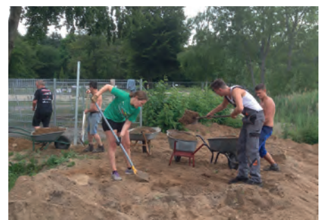
Arbeitseinsatz am 22.06.2019: Fleißige Schaufler beim Erdabtrag