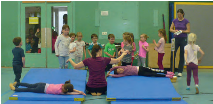
Vor lauter Aufregung purzeln sie den Hügel in Frau Eule's Garten hinab.