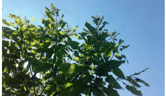
Maikäfer befallen eine Eskastanie