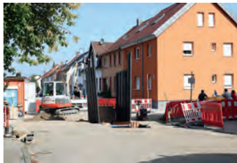
Kreuzung Burgstraße / Breitwiesenweg