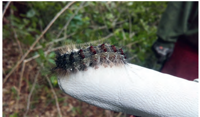
Raupe eines Schwammspinners

er als die Douglasie, wogegen Letztere in späteren Jahren deutlich trockenresistenter ist. Bereits in den letzten Jahren habe Schmitt dadurch immer wieder Douglasienkulturen angelegt, wie auf den Waldbegehungen zu hören war. Die Trockenheit macht auch den Kiefern zu schaffen und führt zu vermehrtem Absterben.