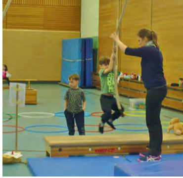
Mit viel Schwung ging es über den kleinen Sumpf

zusammengestellt, den die Kids zum Erlangen des Mini-Sportabzeichens durchlaufen mussten. Mit Übungen wie laufen, rollen, balancieren und werfen orientierten sie sich an den elementaren Grundfertigkeiten, die in verschiedenen Ausführungsvarianten an den jeweiligen motorischen Entwicklungsstand der Kinder angepasst werden konnten. Damit wurde auf spielerische und phantasievolle Weise der natürliche Bewegungsdrang genutzt und die Jungs und Mä-