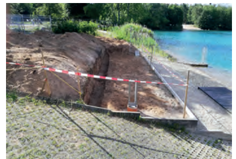
Neu terrassierte Freifläche zwischen Bootshaus und See