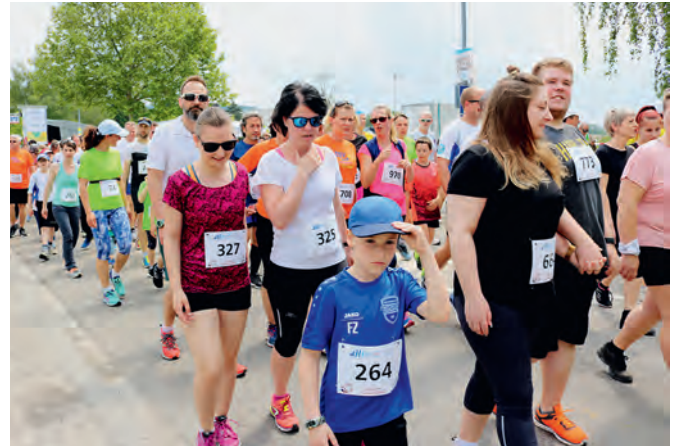
Vom Start weg kommen die Läufer aufgrund der hohen Dichte der Teilnehmer kaum vom Fleck. Erst später entzerrt sich das Feld.

Gedränge kaum vom Fleck kommen. Aber schon nach zehn Minuten hat sich das Feld entzerrt. Da kommt eine Durchsage vom Roten Kreuz, eine Unwetterwarnung sei angekündigt. Tatsächlich, es kommt Wind auf und eine Viertelstunde später fallen die ersten Tropfen. Es kommt ein kräftiger Schauer, einige flüchten ins Feuerwehrhaus, aber das große Feld der Läufer wird nicht nennenswert dezimiert. Weingartens größte Solidaraktion geht ziemlich ungestört weiter.