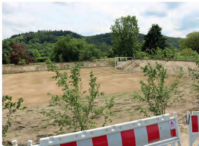
Auf dem neuen Bolzplatz beim Abenteuerspielplatz wächst langsam Gras. Noch vor den Sommerferien soll er offiziell eröffnet werden.

Riesige Erdmassen wurden bewegt und im Untergrund verlaufen parallel zwei Drainagen, um den moorigen Boden zu entwässern und zu stabilisieren. Ein I-Tüpfelchen auf dem Ganzen sind zwei Eidechsen-Habitate, die Dirk Pffirmann im Sinne des Naturschutzes angelegt hat. Es handelt sich um Haufen von groben Kantsteinen, deren Zwi-