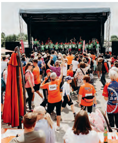
Aufwärmen mit dem ev. Kindergarten Waldbrücke

größte Teil davon war bereits um 14.00 Uhr vor der Bühne versammelt und wärmte sich mit den Kindern vom evangelischen Kindergarten Waldbrücke auf. Nachdem der Startschuss aus der Kanone des Schützenvereins Weingarten abgefeuert war, dauerte es einige Minuten bis auch der letzte Läufer sich auf den Weg machen konnte, so groß war das Startfeld. Zusammen liefen die Starter 12.341,5 Runden, das entspricht 16.043 Kilometern für den guten Zweck. Die Laufergebnisse sind unter www.blutev.de veröffentlicht.