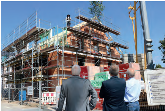
Aller Augen blickten auf den Zimmermann

Aller Augen waren auf den Zimmermann gerichtet, als mit seinem Spruch das Richtfest vollzogen war. Der Neubau, auf dem jetzt der Dachstuhl aufgeschlagen ist, ist der dritte im Zeitraum von drei Jahren. Das Richtfest des ersten von insgesamt fünf wurde am 5. Mai 2017 gefeiert. In einem ambitionierten Bauprojekt ersetzt die Baugenossenschaft Weingarten in der Mülberger Straße die alten und nicht mehr sanierungsfähigen Mehrfamilienhäuser aus den 50er Jahren. Die Genossenschaft, die in diesem Jahr ihr 100. Jubiläum begeht, sieht sich in der Pflicht, ihren Mitgliedern bezahlbaren Wohnraum zu verschaffen und pflegt dazu einen Bestand von derzeit 134 Wohnungen. Wenn aber die Sanierungskosten unwirtschaftlich werden, wird abgerissen. „Wir hatten das Glück,