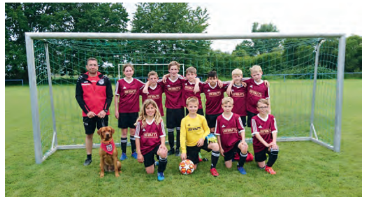
Gegen Rüppurr wurde der Aufstieg perfekt gemacht ...