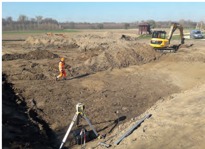
Riesige Erdmassen wurden bewegt und der Platz mit Vermessungstechnik nivelliert