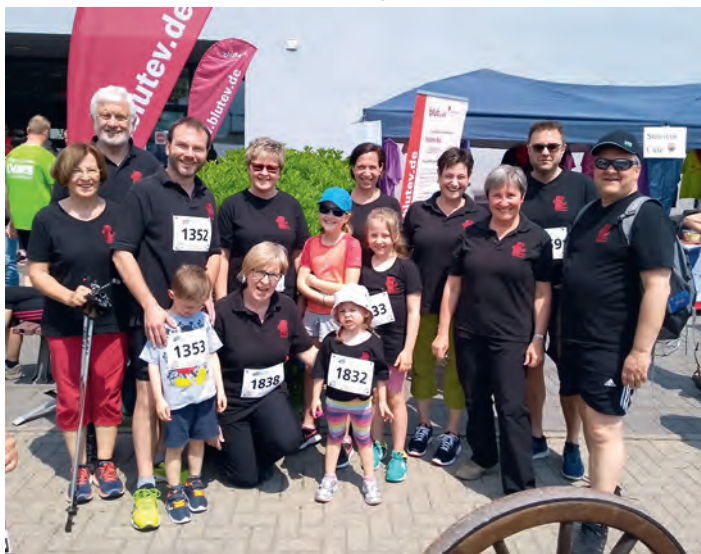
Läuferinnen und Läufer des GV Frohsinn

Dass die Sängerinnen und Sänger des GV Frohsinn Weingarten nicht nur singen können, sondern auch gerne für einen guten Zweck laufen, haben sie am 25. Mai 2019 erneut unter Beweis gestellt.