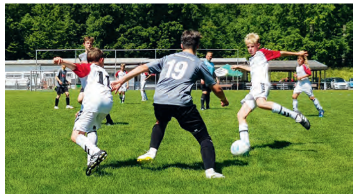
... und gegen Forchheim der dritte Platz gesichert!