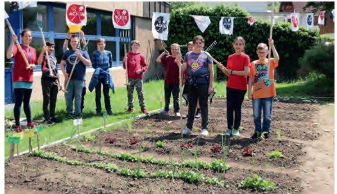
Mit viel Freude und Motivation lernen die Schüler und Schülerinnen der 5. und 6. Klasse, selbst Gemüse im Garten anzubauen.