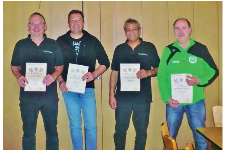
2. Platz bei den Kreismeisterschaften Kleinkaliber Liegendanschlag.