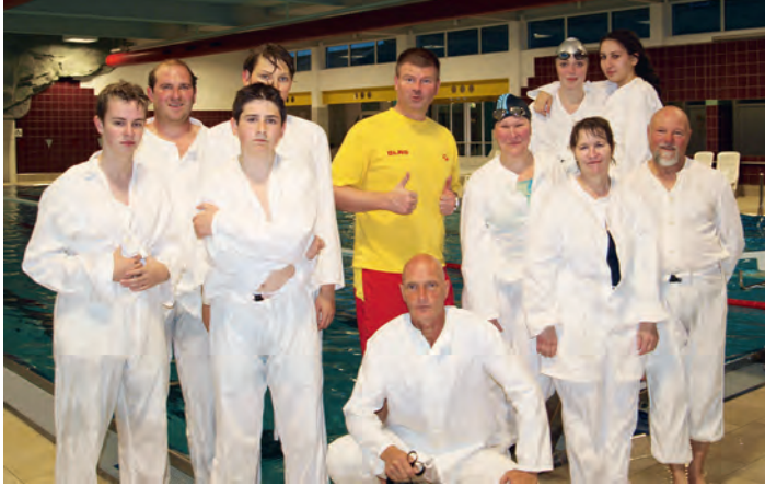
Erfolgreiche Absolventen des Rettungsschwimmerabzeichens Silber

Lösen aus der Umklammerung durch einen Befreiungsgriff 25 m Schleppen Anlandbringen des Geretteten 3 Minuten Vorführen der Herz-Lungen-Wiederbelebung (HLW) Insgesamt 11 Teilnehmer absolvierten sämtliche Übungen und Prüfungen erfolgreich und dürfen nun das Rettungsschwimmerabzeichen Silber führen. Es berechtigt unter anderem zur Teilnahme am Wachdienst am Baggersee und im Schwimmbad.