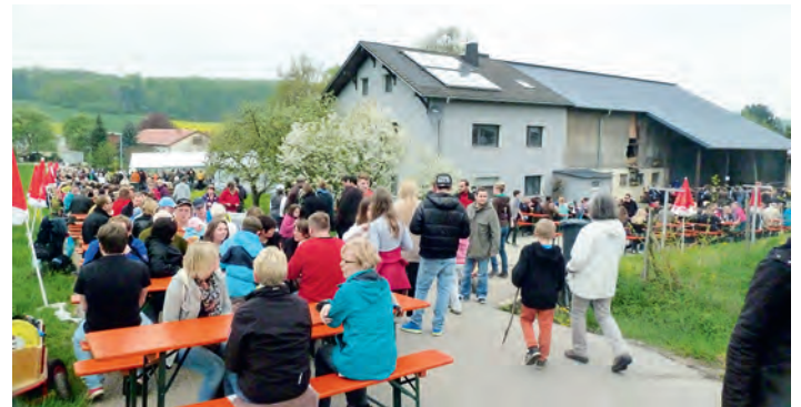
Jubel, Trubel, Heiterkeit beim Musik-Hock im Sohl am 1. Mai