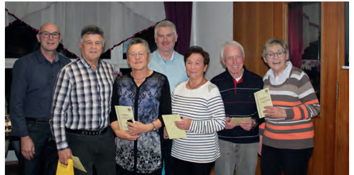
Ehrung für 40-jährige Mitgliedschaft beim TSV Weingarten