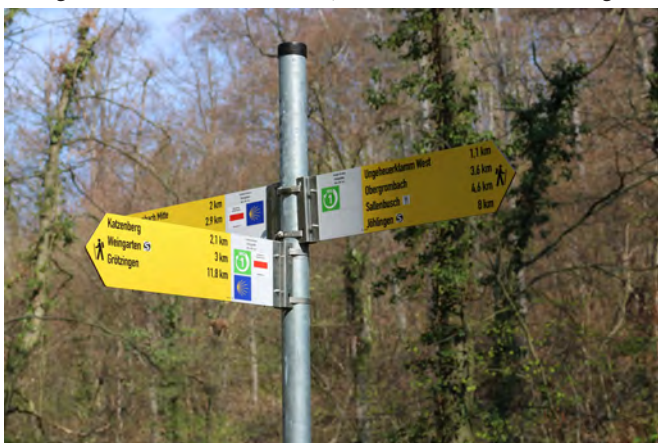
152 Wegweiser und Einzelschilder erleichtern die Orientierung und versetzen selbst Ortsunkundige in die Lage, den "WG 1" selbständig zu erwandern

Der Gemeindefunktionär Kay Ostwald hatte zusammen mit dem Bauhof 152 Schilder installiert: richtungsweisende mit Entfernungsangaben an Kreuzungen und einfache Bestätigungsschilder auf der Strecke, um dem Wanderer Sicherheit zu geben. Unter seiner Leitung machte sich der Trupp auf den Weg. Vom Parkplatz aus nach Norden Richtung Ungeheuerklamm. Bei höchst angenehmem Wetter zeigte sich der Wald in diesem feuchtschattigen Gebiet in sanft frühlingshaftem Grün. Am Ende der Klamm führte ein sanfter, aber sehr langgezogener Aufstieg zum Grillplatz auf dem Höheforst. Hier wartete zur freudigen Überraschung vieler Teilnehmer ein handfester Imbiss mit Gulasch- oder Gemüsesuppe, Brot und Erfrischungsgetränken. Ein Drittel des 14 Kilometer langen Weges war jetzt geschafft. Von dort aus führte der Weg, so gut markiert, dass selbst gänzlich Ortsunkundige ihn nicht verfehlen konnten, zur Siedlung Sallenbusch. Die einzige Asphaltstrecke auf dem ansonsten wunderbar angenehm zu gehenden Wald- und Wiesenweg führte von der Sallenbusch-Siedlung zur L 559. Es folgte der Rückmarsch ins Dorf, über den Schmalensteinweg zum