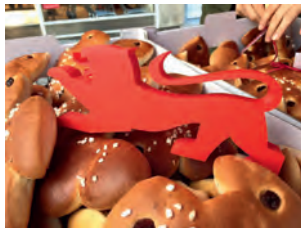
Frisches Ostergebäck von der SPD Weingarten (Baden)

Sie haben Fragen zu uns, unseren Kandidatinnen und Kandidaten? Sie möchten wissen, was der SPD Weingarten (Baden) in den kommenden fünf Jahren wichtig ist? Kommen Sie vorbei und lernen Sie uns persönlich kennen.