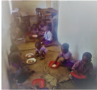
Lernen und Essen

Das Schulhaus wurde von DZARINO CBO für 3.000 KSH (Kenia-Shilling) pro Monat gemietet, für umgerechnet etwa 27 €. So brauchen die Kinder nicht zwischen Dornbüschen oder unter Akazien zu lernen und sind vor der sengenden Sonne und heftigem Regen (wenn es denn regnet!) geschützt. Doch auch drinnen sind die Temperaturen oft so hoch, dass unsere Kinder wahrscheinlich hitzefrei bekämen. Die Schulmöbel im Hintergrund, die wir bzw. Sie mitfinanziert haben, machen den Kindern bewusst, dass sie in einer richtigen Schule sind. Ihre Mittagsmahlzeit nehmen die Kinder im Schulhaus ein. Sitzend auf dem Sisalteppich zu essen ist in Kenia absolut üblich, ebenso wie das Essen