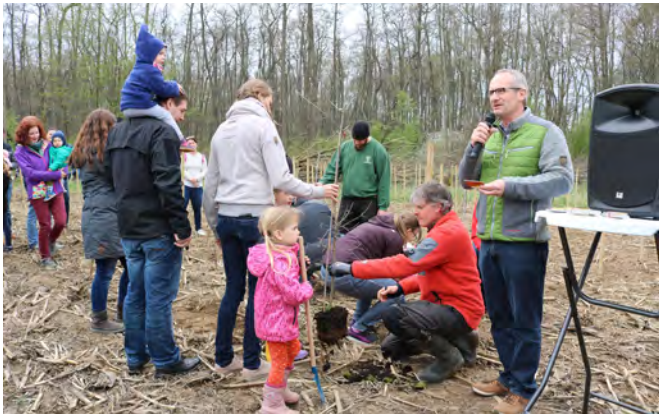
Zahlreiche Eltern finden es eine schöne symbolische Geste, zur Geburt ihres Kindes einen Baum zu pflanzen und nehmen dieses Angebot der Gemeinde gerne an.

67 neue Stieleichen als Geburtenbäume im Gewann „Richtacker“