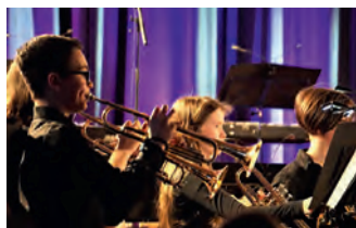
Am 14. April präsentiert der Musikverein wieder das Frühjahrskonzert in der Walzbachhalle.

Wir laden Sie am Sonntag, den 14.04.2019 um 18 Uhr zum 51. Frühjahrskonzert in die Walzbachhalle in Weingarten ein. Das Programm steht dieses Mal ganz im Zeichen der britischen Inseln. Zum Einstieg präsentiert das Jugendorchester die stimmungsvollen Stücke „Fanfare and Flourishes“ und „The Royal Scotsman“. Das Bläserorchester beginnt mit einem Medley bekannter britischer Klassiker wie „Greensleeves“, „Trumpet Voluntary“ und „Rule Britannia“. Bei der weltbekannten Melodie „Nimrod“ des englischen Komponisten Edward Elgar ist Gänsehaut garantiert. Die Suite aus „Hymn of the Highlands“ zeichnet ein kontrastreiches Bild der rauen Bergwelt Schottlands und wird durch ihre Virtuosität dem Orchester alles abverlangen. Johan de Meij vertonte in seiner Sinfonie Nr. 1 Motive der „Hobbits“ des britischen Schriftstellers J.R.R. Tolkien und führt die Zuhörer mit epischen und dramatischen Klängen in die Fantasiewelt Mittel Erde. Zu guter Letzt lässt das Orchester mit „Bohemian Rhapsody“ und weiteren Hits die Rockgruppe Queen um Freddie Mercury wieder auferstehen. In der Pause und nach dem Konzert verwöhnt Sie das Kuchenteam des Vereins mit einem Imbiss und einer reichhaltigen Getränkeauswahl. Wir freuen uns auf Ihren Besuch!