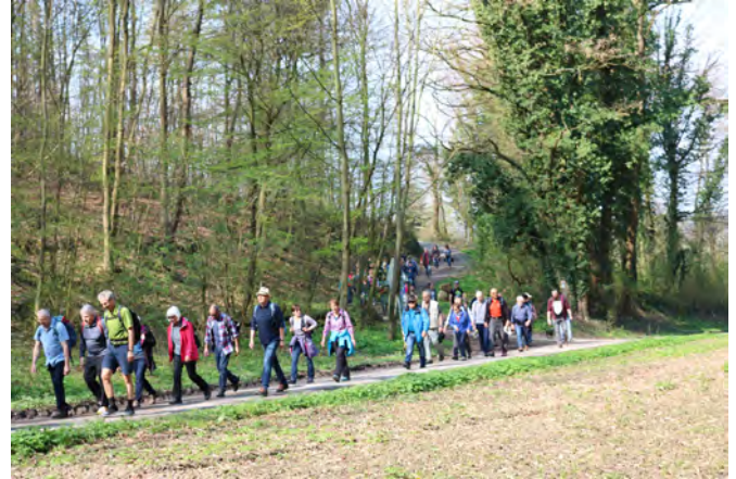
Die Ungeheuerklamm präsentiert sich bei prächtigem Wetter in frischem Grün

Alten Friedhof. Das dicke Ende für manche schon strapazierte Wanderer war dann ein extrem steiler Aufstieg über einen Erdweg auf den Kirchberg. Aber oben angekommen, war alle Mühe vergessen.