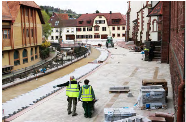
Die Baustelle „Kirchstraße/Kirchplatz“ ist auf der Zielgeraden. Bis zur Fertigstellung Ende Mai sollen an der Bachseite noch Bäume gepflanzt werden

Den Antragstellern geht es um ein Eindämmen der zunehmenden Verwilderung von Grundstücken vor allem durch überdimensionierte Bauten, abgestellte Fahrzeuge, Schuttablagerungen und dergleichen. Bürgermeister Eric Bänziger berichtete, es hätten Gespräche mit dem Sachbearbeiter des Landratsamts Baurechtsamts stattgefunden, aber nichts ergeben. Die Wochenendgebiete „Effenstiel“ und „Im Gehren“ hätten Priorität und sollen seitens des Baurechtsamts zeitnah auf Basis des rechtskräftigen Bebauungsplanes angegangen werden. Erst danach könne der weitere großflächige Außenbereich in Angriff genommen werden. Die Mitglieder des AUT waren sich einig, dass das eine unbefriedigende Auskunft sei. Sie seien nicht mehr länger gewillt, diese Zustände zu dulden. Besonders ärgerlich sei, dass auch gemeindeeigene Grundstücke von Pächtern oder unberechtigten Nutzern derart misshandelt würden und am Ende die Gemeinde auf Entsorgungskosten sitzen bleibe. Zudem sei teilweise auch das Wasserschutzgebiet betroffen. Bürgermeister Bänziger erkannte den Ärger der Ratsmitglieder, verwies aber auf den hohen personellen Aufwand, den das Rathaus zurzeit nicht leisten könne. Am Ende verblieb das Gremium dabei, im Amtsblatt deutlich auf die Missstände hinzuweisen und die Öffentlichkeit zu informieren, was rechtens sei und was nicht, und dass Zuwiderhandlungen in Zukunft gehandelt würden.