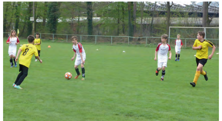
Den D-Junioren gelang ein Kantersieg

Nun erwartet das Team noch vor den Ferien den Gegner aus Beiertheim, dem man mit der gleichen Spielweise erfolgreich Paroli bieten und so den dritten Tabellenplatz festigen möchte.