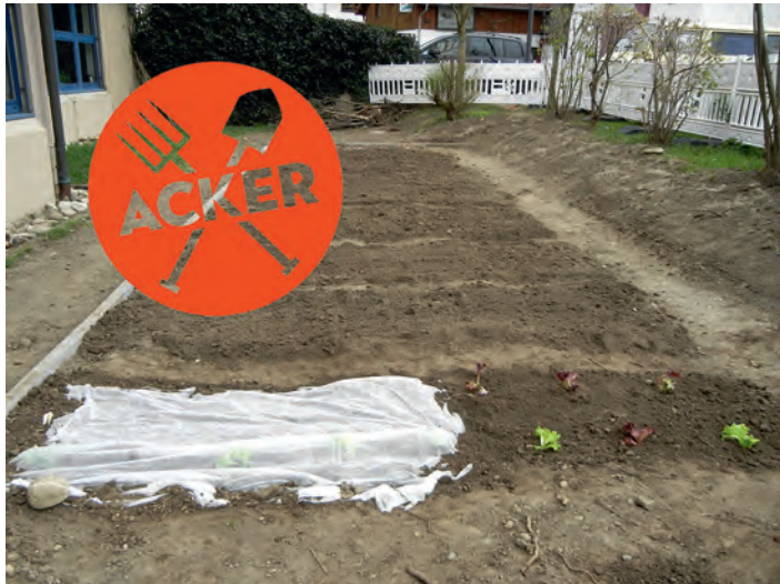
Kopfsalate sind die ersten von vielen weiteren Gemüsesorten, die bald auf dem ACKER an der Turmbergsschule wachsen.

Noch sieht die neue ACKER-Fläche recht mitgenommen aus, aber in den letzten Wochen haben die Mitarbeiter vom Bauhof mit ihren Maschinen das Gelände gründlich bearbeitet, einige Büsche entfernt um Sonne an die Pflanzen zu lassen, die Grasnarbe abgenommen und das Gelände nivelliert. Die Firma Bock&Görner Landschaftsbau hat flugs noch gefräst (also die Erde umgearbeitet und fein verkrümelnd) und dann konnten wir endlich raus auf den ACKER und selbst Hand anlegen. Jetzt ist der erste Satz Salate im Freien und in den nächsten Wochen folgen viele weitere Gemüsesorten: Zwiebeln, Karotten, Radieschen, Mangold, Kartoffeln und einiges mehr. Bald erholt sich auch die Grasfläche, die Büsche werden grün und unser ACKER sieht tatsächlich aus wie ein Garten und nicht mehr wie ein Stück Brachfläche. Mehr Informationen unter www.flurkultur.org/acker