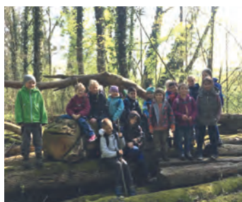
AGNUS-Jugend-Kinder im Moor