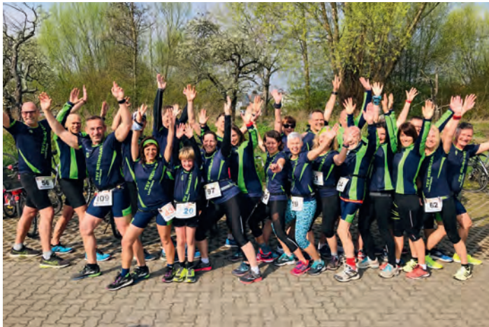
die TSV Läuferinnen und Läufer vor dem Start des 14. Stutenseer Stadtlauf

Von den 24 Läuferinnen und Läufern des TSV Weingarten Lauftreff nahmen 18 beim 10 km Lauf, drei beim 5 km Lauf, zwei beim 5 km Walking und einer beim 1,5 km Schülerlauf teil.