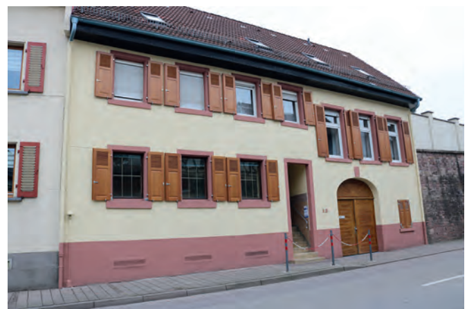
...der „Treff International“