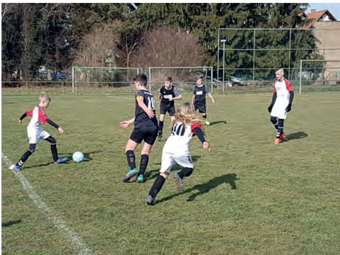
Unsere D-Junioren in Dettenheim