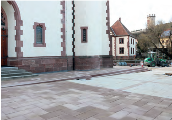
Um die gesamte katholische Kirche zieht sich eine Schlepptrappe, die den Platz mit der Kirche zu einer Einheit verbindet

Noch ist die Fläche rund um die Kirche mit Sand bestreut, aber es ist deutlich zu sehen, wie es werden soll.