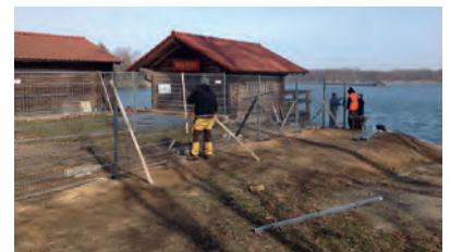
Bau der neuen Zaunanlage

Die vorbereitenden Maßnahmen zum Neubau des Bootshouses an der Wache am Bagsee sind im vollen Gange. Am Samstag, 23.02.2019, wurden der erste Teil der neuen Zaunanlage gestellt und Geländemodellierungen auf der Freifläche vorgenommen. Bei strahlendem Sonnenschein widmeten sich 11 Aktive des Vereins ihren Aufgaben und konnten Ihre Fertigkeiten beim Betonieren, Schrauben oder Schaufeln unter Beweis stellen.