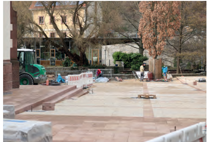
Der gesamte Platz wird großflächig mit hellen Granitpflastersteinen im Wechsel mit dunkelrotem Sandstein belegt

Die hellen Granitpflastersteine, die so schwer sind, dass sie nur von zwei Mann getragen werden konnten, sind auf dem Kirchplatz nahezu fertig verlegt. Die Pflaster werden über Verschiebekrallen mit dem Untergrund verbunden, informierte Bürgermeister Eric Bänziger im