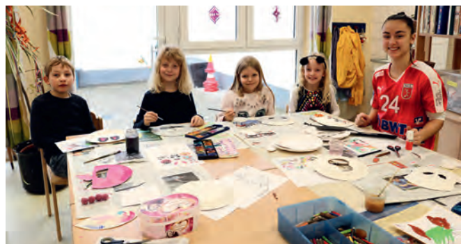
Faschingsmasken aus Pappe sind leicht herzustellen und haben eine tolle Wirkung

Die Mädels durften Faschingsmasken herstellen. Dazu gestalteten sie runde Pappteller auf der Rückseite mit Wasserfarbe zu verschiedenen Tiergesichtern. Einhorn, Katze und einige mehr gab es auf Vorlagen zur Auswahl, aber natürlich waren der eigenen Kreativität keine Grenzen gesetzt. Manche bastelten Masken zum Verkleiden, andere wollten sie lieber in ihrem Zimmer zur Deko aufhängen.