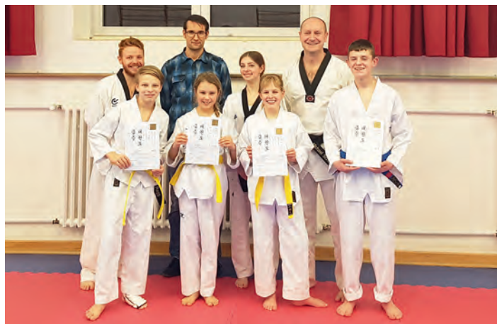
Die Prüflinge der Donnerstagsgruppe mit Trainern und Prüfer nach der Prüfung