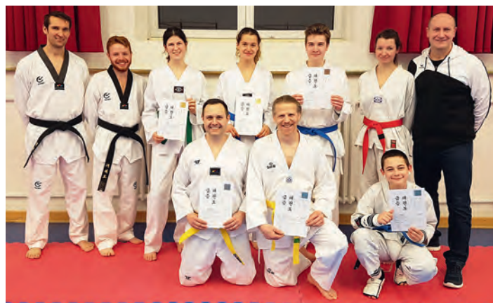
Die Prüflinge der Mittwochsgruppe mit Trainern und Prüfer nach der Prüfung

Für die bestandene Prüfung gab es am Ende für alle Prüflinge eine Urkunde. Herzlichen Glückwünsch!