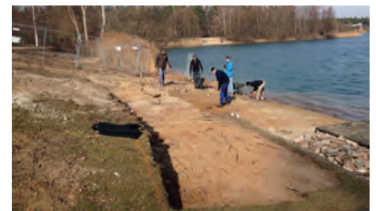
Geländearbeiten an der erweiterten Freifläche