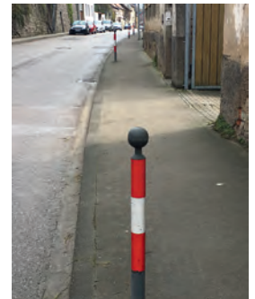
Poller zum Schutz der Fußgänger

Die SPD-Fraktion hatte sich im Verlauf ihrer Meinungsbildung über die künftige Verkehrskonzeption für die Jöhlinger Straße bereits im November 2018 mit den Vertretern der Interessengemeinschaft (IG) Jöhlinger Straße ausgetauscht. Die Forderung der IG nach zusätzlichen Parkplätzen auf der Nordseite und der Beibehaltung der Poller aus Gründen der Verkehrssicherheit für Kinder und ältere Menschen ist schon seinerzeit bei unserer Fraktion auf offene Ohren gestoßen. Von den unterschiedlichen Interessenlagen seitens der Anwohner, der übrigen Ortsansässigen und der ortsfremden Verkehrsteilnehmer stehen für die SPD die Interessen und Sorgen der Bewohner der Jöhlinger Straße und ihrer Seitenstraßen klar im Vordergrund.