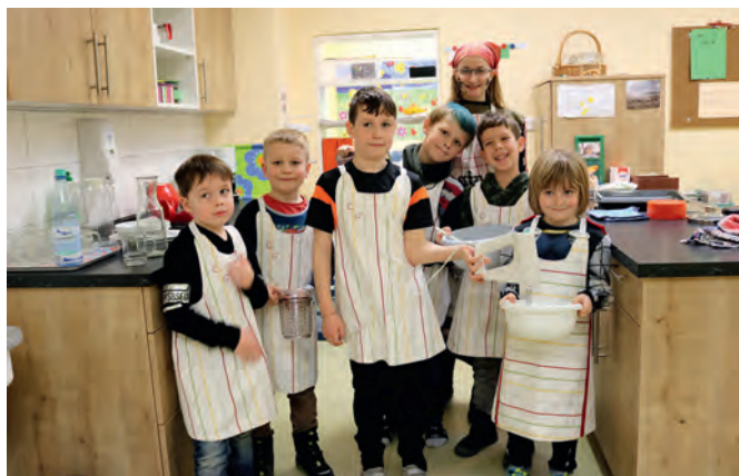
Mit tollen Schürzen backt es sich gleich besser