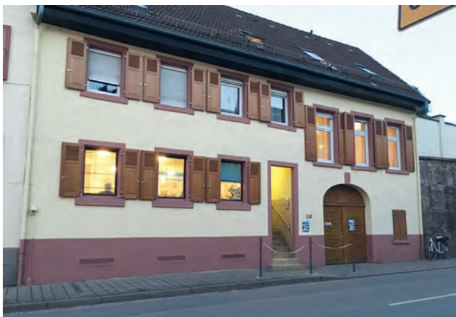
In bester Verfassung lädt das ehemalige Gasthaus Metaxa heute zur Begegnung ein.

Mit einem rundum gelungenen Fest für alle Beteiligten feierte der Freundeskreis Asyl einen Meilenstein in seiner Geschichte. Die Gruppe hatte sich bereits vor rund 30 Jahren gegründet, als zum ersten Mal eine nennenswerte Anzahl von Flüchtlingen nach Weingarten kam. Diese kamen zunächst aus Vietnam, später waren es Spätaussiedler und schließlich Kriegsflüchtlinge aus dem ehemaligen Jugoslawien. 2015 traf eine weitere Flüchtlingswelle in Deutschland ein und auch Weingarten wurde für viele Menschen ein neues Zuhause. Der Freundeskreis wurde reaktiviert und seither engagieren sich etliche Weingartnerinnen und Weingartner in verschiedenen Arbeitsgruppen. Es entstanden eine Kleiderkammer, eine Fahrradwerkstatt, das „Café International“, die Gruppe „Lernen“, die Gruppe „Kids & Teens“, „Patenschaften“, „Alltagsbegleitung“, sowie eine Zuständigkeit für Organisation und Öffentlichkeitsarbeit.