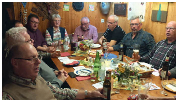
Männerchortreffen zum Jahresabschluss