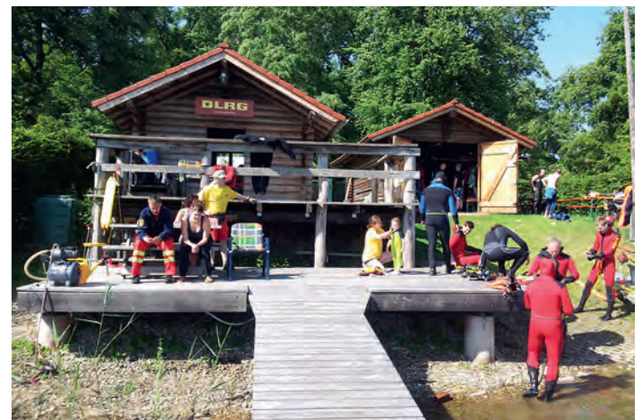
Tauchtraining an unser Wache am Baggersee

Beim Schnorcheltauchen wird der Umgang mit Schnorchel, Brille und Flossen und erste Einblicke in die Tauchtheorie erlernt. Das Deutsche Schnorcheltauchabzeichen ist die ideale Ergänzung für jeden Schwimmer / Rettungsschwimmer, um seine schwimmerischen Fähigkeiten weiter zu entwickeln und zu festigen. Die Ausbildung für dieses Abzeichen wird