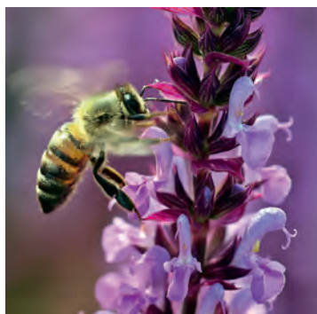
Vorgarten: Lebensraum für Pflanzen und Tiere.

Dies alles ist belastend für unser ökologisches Gleichgewicht. Heimisches Gärtnern gilt übrigens als gesund und mental entspannend. Je nachdem, wie eine Freifläche bepflanzt wird, z.B. mit Stauden, Bodendeckern oder Sträuchern, hält sich der Pflegeaufwand in Grenzen.