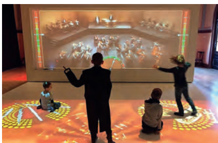
Die MusikvereinKIDS im Toccarion

Letztes Wochenende waren unsere MusikvereinKIDS im Toccarion in Baden-Baden. In der Kinder-Musik-Welt im Festspielhaus konnten sie unter anderem an den vielfältigen Stationen die Entstehung und Vielfalt von Tönen und Rhythmen erkunden, spielerisch die Klangfarben der Instrumente erfahren und sogar als Dirigent vorm interaktiven Orchester stehen. ...gar nicht so einfach, dass alle Musiker auf ihren Plätzen bleiben. ... Als nächste gemeinsame Aktion steht im Januar ein spielerischer Rhythmuskurs mit Trommeln, Cajons und mehr in Weingarten an und die MusikvereinKIDS machen das erste Mal zusammen Musik. Kennen Sie auch Kinder, die gerade angefangen haben ein Blasinstrument oder Schlagzeug zu lernen oder demnächst damit beginnen? Dann sprechen Sie uns doch an.