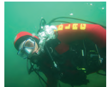
DLRG-Taucher im Einsatz

Die Stufen der Tauchausbildung umfassen die Schnorcheltauchausbildung , die Geräteausbildung (CMAS*, CMAS**) und die Einsatztauchausbildung .