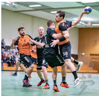
Die Partie zwischen den beiden benachbarten Spielgemeinschaften war sehr kampfbetont aber stets fair

Verbandsliga Frauen: SG Stutensee-Weingarten - SG Heidelberg/Helmsheim 22:23 (16:10)