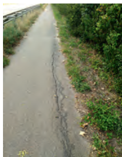
Radweg L559: Gefahr an den Autobahnrampen wird beseitigt

Als „kritisch“ stufte die WBB den Zustand des Radwegs entlang der L559 nach Blankenloch kurz vor Schuljahrs Beginn 2018/19 ein. Schlamm vom Starkregen, fehlende Wasserabläufe, üppiger seitlicher Grünbewuchs sowie eine bröckelnde Fahrbahn bergen nicht unerhebliche Gefahren für den, vor allem von Schülern stark frequentierten und ohnehin zu schmalen Radweg. Durch die guten Kontakte zur Kreisverwaltung wurde auf Initiative der WBB umgehend eine Säuberung des Weges veranlasst, ebenso wurde das seitliche Gehölz stark zurückgeschnitten. Eine frohe Kunde