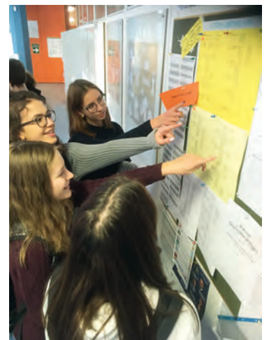
Welcher Vortrag wurde uns zugewiesen? Schülerinnen der Kursstufe am TMG informieren sich über die Zuteilung der persönlichen Ansprechpartner

Alle zwei Jahre steht ein besonderes Ereignis am Thomas-Mann-Gymnasium in Stutensee an, und diese Woche war es nun wieder so weit. Die Schülerinnen und Schüler der Klasse 10 und 11 konnten sich am Donnerstag, 15.11.18, gezielt und aus erster Hand über ganz unterschiedliche Berufe informieren. Dazu sprachen sich die Elternbeiräte der Schule im Vorfeld ab und überlegten, wer von ihnen entweder selbst seinen beruflichen Werdegang schildert oder aber Experten kennt, die als Referenten zu dieser Veranstaltung eingeladen werden könnten. In diesem Jahr waren es insgesamt elf Berufstätige aus den Bereichen der Geistes-, Sozial- und Naturwissenschaften, die sich im Rahmen des Nachmittagsunterrichts bei insgesamt drei Vorstellungsrunden in Kleingruppen den neugierigen Fragen der Gymnasiasten stellten. Bei den Jugendlichen kam gut an, dass die Referenten mit Begeisterung auftraten und ihre Vorträge durch persönliche Details bereicherten. Ausgiebig wurde auch die Möglichkeit genutzt, die Experten nach den jeweils 20 Minuten dauernden Kurzpräsentationen im persönlichen Gespräch über den Ausbildungsweg und die aktuellen Berufschancen zu befragen. Viele Schülerinnen und Schüler interessierten sich beispielsweise für den Arbeitsalltag eines Richters oder Redakteurs beziehungsweise den Weg vom Studium zur Arbeit als Architektin im eigenen Planungsteam. Am Ende sprachen sich viele der