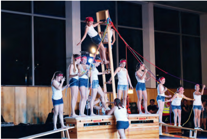
Das „Richtfest“ des künftigen Vereinsheims mit Baum und Richtkranzbändern nahm die Gruppe „Kinderturnen ab fünfte Klasse“ in ihrem Beitrag schon vorweg.

Rot-weiße Absperrbänder durchteilen die Halle, die Akteure tragen Bauhelme und Warnwesten: Im 135. Jahr seines Bestehens hat der Turn- und Sportverein für sein alljährliches Schauturnen aus aktuellem Anlass das Motto „Baustelle“ gewählt und die meisten der 18 Beiträge haben es irgendwie verarbeitet. Das Schauturnen ist ein Blitzlicht, das als Höhepunkt des Vereinsjahres Eltern und Gästen der Akteure einen Einblick in die enorme Arbeit der Trainer und Übungsleiter gibt. Der erste Teil der Vorführungen galt dem Kinderturnen. Rund 480 Kinder turnen aktuell in vielen verschiedenen Altersgruppen und weitere 100 füllen die Wartelisten. Schon allein dadurch erklärt sich das große Bauvorhaben des Vereins. Mehrere Kindergruppen im Alter zwischen drei und acht Jahren purzeln durch die Halle, teils mit, teils ohne Gerät und jede Gruppe macht mit Klettern, Springen, Hüpfen und Balancieren, mit und ohne Purzelbaum, deutlich, wie viel Spaß Kinder im Training haben und wie viel Freude und Selbstbewusstsein ihnen Erfolgserlebnisse bringen. Es folgen die Älteren, die ab der dritten Klasse schon langsam an Leistung herangeführt werden und schließlich junge Frauen, die mit Energie, Anmut und Körperspannung hervorragende turnerische Darbietungen zeigen. Jeder Vorführung lag eine einstudierte Choreografie zugrunde, meist mit Musik unterlegt, und die Trainer- und Übungsleiterin-