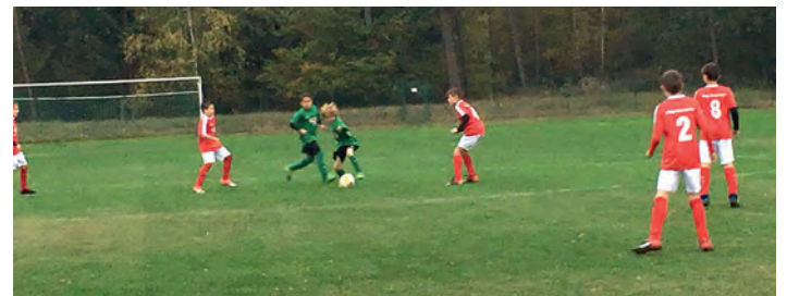
Ein spannendes Endspiel um die E1-Staffelleisterschaft

Für die E1 bedeutete dieser Sieg die erneute Staffelleisterschaft nach dem 1. Platz im Frühjahr! Kurz genießen, durchschnaufen und weiter geht's mit neuen Zielen in der Weiterentwicklung.