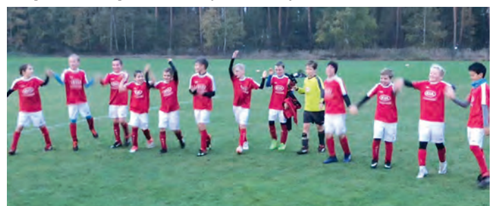
Der verdiente Sieger jubelt