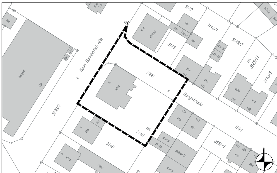
Stadt Weingarten - Bebauungsplan Nr. 70 "Burghof" - Übersichtsplan Geltungsbereich, M 1:500 21048-4-PL10, Übersichtsplan Geltungsbereich, 14, Karlsruhe, 25.04.2018