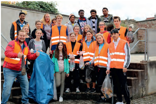
Müllsammeln als Gemeinschaftsaktion beim Joggen: Sport, Spaß und Sauberkeit

Plogging ist jetzt auch in Weingarten angekommen. Die Trendsportart aus Skandinavien, die in großen Städten schon viele Mitläufer hat, ist ein ebenso einfaches wie wirksames Instrument, bei dem jeder Einzelne etwas für sich selbst und zugleich für die Umwelt und die Gemeinschaft tut. Das Wort setzt sich zusammen aus dem schwedischen „plocka upp“, das heißt „aufheben“, und dem allgemein bekannten „Jogging“. Konkret bedeutet es, in einer Gruppe zu joggen und dabei Müll aufzuheben. Jetzt hat eine Gruppe christlich orientierter junger Menschen aus Weingarten dieses Thema aufgegriffen.