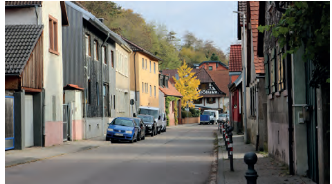
An einer der engsten Stellen der Jöhlinger Straße soll eine Verschwenkung eingebaut werden, um den Gehweg (auf der rechten Seite im Bild) durchgängig auf 1,50 m Breite zu gestalten.

Nach den Regelwerken für den Ausbau von Landesstraßen sei auch die Forderung der Interessengemeinschaft nach einer Fahrbahnbreite von nur 5,50 Meter nicht machbar. Um das bisherige „Lückenspringen“ zu vermeiden, solle auf der Straße nur noch in wenigen Zonen geparkt werden und dort nur noch zu bestimmten Tageszeiten: Nachts, am Wochenende und außerhalb der Hauptverkehrszeiten, also morgens vor sechs und abends nach 19 Uhr. Von 6 Uhr morgens bis 9 Uhr und von 15 bis 19 Uhr sei dort absolutes Haltverbot. Als eine Zuhörerin darauf hinwies, dass sie dann nicht mehr anhalten könne, um ihr Hoftor auf- und abzuschließen, räumte er ein,