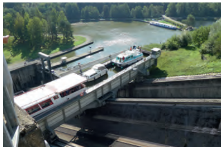
Schiffshebewerk in Saint Louis-Arzweiler