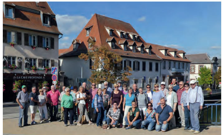
Frohsinn-Ausflügler am Rhein-Marne-Kanal in Saverne