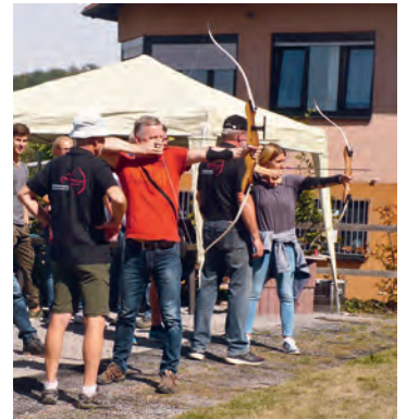
Großes Interesse beim Bogenschießen.

Doch wer hat den von der Gemeinde Weingarten gestiftete Wanderpokal gewonnen? Dieses Geheimnis lüften wir bei der Siegerehrung am Sonntag, 23. September 2018 (11.00 Uhr) im Festzelt auf dem Rathausplatz Weingarten bei unserem 5. Oktoberfest. Wer der/die neue Bürgerkönig/-in ist wird da aber noch nicht verraten. Dies wird weiterhin erst bei unserer traditionellen Königsfeier am 24. November 2018 bekannt gegeben. Wir gratulieren allen Gewinnern und sagen noch einmal vielen Dank für euer Kommen und Begeisterung an unserem Schießsport.