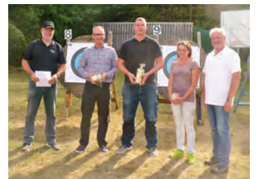
Gewinnübergabe leckeres Wurstpaket beim Bogenschießen