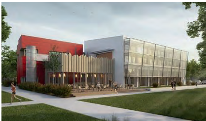
Modellzeichnung: So könnte das TSV Vereinszentrum mit Ausrichtung zum Freibad aussehen

Nach rund 8 Jahren Planungs- und Vorbereitungszeit geht es endlich los! Der TSV Weingarten startet mit seinem neuen Vereinszentrum in die nächste Etappe der Vereinsgeschichte. Mit der Vereinsgaststätte inkl. Geschäftsstelle sowie Konferenzräumen und zwei je 300 qm großen multifunktionalen Hallen entsteht an der Kanalstraße gegenüber dem Bauhof und Kleintierzüchterverein ein modernes zweistöckiges Gebäude, das dem TSV Weingarten und anderen Institutionen ideale Bedingungen für Sport, Fitness, Kultur und Gemeinschaft bieten wird. In unmittelbarer Nähe zur Walzbachhalle und Ringerhalle, zum Freibad und Festplatz sowie zum Weingartner Moor und seinen Naturlandschaften bettet sich das „Neue TSV Vereinszentrum“ in ein Areal mit hohem Freizeitwert ein. Der TSV Weingarten vollzieht heute am Donnerstag, den 20. September 2018, um 17.30 Uhr, den Spatenstich in der Kanalstraße auf dem Gelände des ehemaligen Abenteuerspielplatzes.