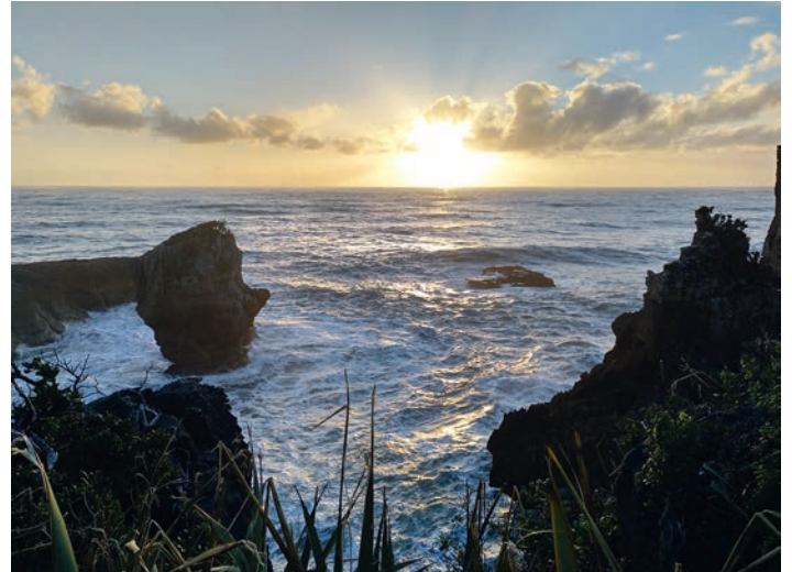
GV Frohsinn wünscht schöne Ferien!

Samstag, 15. September 2018: Tagesausflug ins Elsass, nach Lothringen und in die Pfalz.