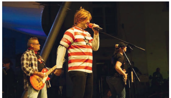
Hitparade des MV Weingarten am 01.09.

Am Samstag, den 01.09. findet auf dem Rathausplatz DAS Open-Air-Event schlechthin in Weingarten statt - die Hitparade des Musikver-