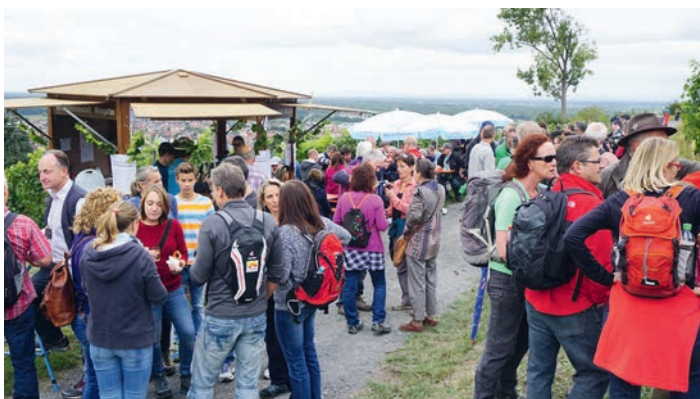
30. Weingartener Weinwandertag am 02.09.

Am Sonntag, den 02.09. ist wie jedes Jahr ganz Weingarten auf den Beinen, um auf den Katzenberg und den Kirchberg zu wandern. An mehreren Probierständen können Sie sich die Weine der Weinmanufaktur Weingarten und der WG Schliengen schmecken lassen. Ab 10:30 starten im Grundschulhof geführte Touren , bei denen Winzer und Weinexperten den Weinbau in Weingarten vorstellen. Natürlich kann jeder auch auf eigene Faust von Probierstand zu Probierstand wandern. Ein praktisches Probierset (0,1l Probierglas mit passendem Halter) können Sie im Grundschulhof oder an den Probierständen erwerben.