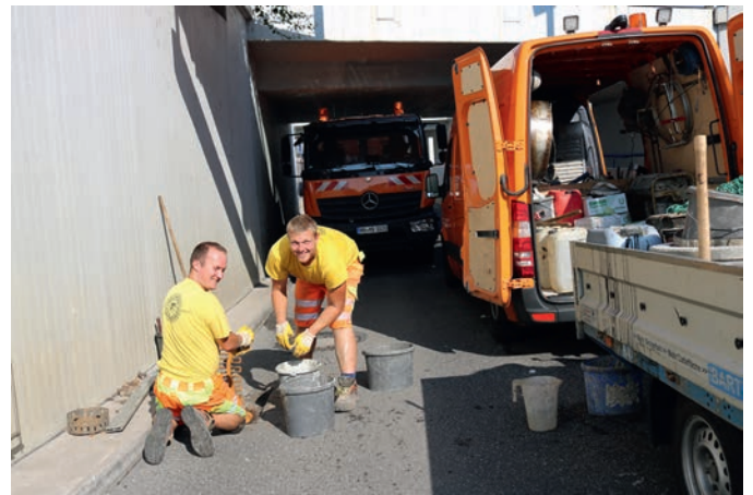
Die Erneuerung der kaputten Seiteneinläufe in der Unterführung waren ein Teil der umfangreichen Instandhaltungsarbeiten.

Am anderen Ende der Unterführung hatten zwei Mitarbeiter einer Fachfirma damit begonnen, die Seiteneinläufe zu erneuern. Die alten, vermutlich unter der Belastung des Autoverkehrs, kaputtgegangenen Einlaufschächte wurden herausgenommen, durch neue ersetzt und diese einbetoniert. Im Weiteren ist eine Wartung der Pumpstation erforderlich und der Regenwasserkanal muss gespült werden. An den Wänden und an der Fahrbahn müssen Unfallschäden behoben und Reinigungsarbeiten vorgenommen werden. Da vor allem Letztere zeitlich sehr aufwendig sind, musste die Unterführung am Montag und Dienstag dieser Woche von 8 bis 20 Uhr und noch ab Mittwoch bis einschließlich dem morgigen Freitag von 8 bis 16 Uhr gesperrt bleiben.