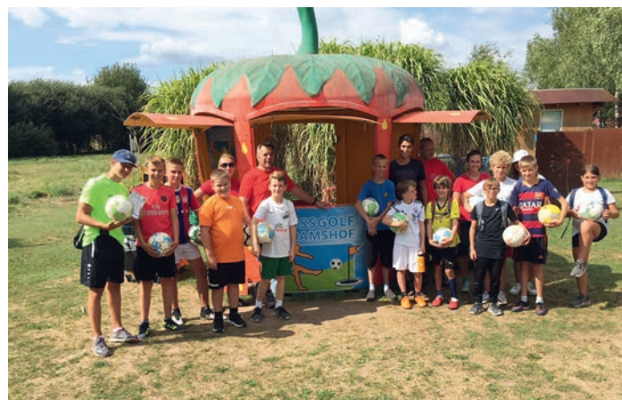
Beim Fussgolf in Kandel