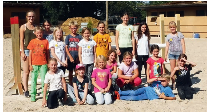
Ferienstpaß 2018 beim Reitverein Weingarten

Gruppe 1 wurde geführt auf gesattelten Pferden, Gruppe zwei konnte das auf Ottokar geübte Turnen nun auf schwankendem Pferderücken probieren. Alle haben sich getraut die teilweise schwierigen Übungen zu versuchen und auch geschafft. Auch hier wurden dann die Gruppen getauscht.