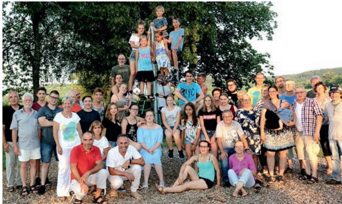
Die Theaterkistler nach erfolgreicher Wahl beim traditionellen Stückstammtisch

Premiere am 17. März 2019 , weitere Aufführungen am 23., 24. und 30. März 2019 jeweils um 15 Uhr im Evangelischen Gemeindehaus Weingarten (Baden)