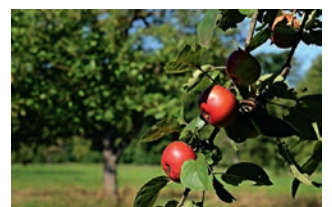
Streuobstinitiative im Stadt- und Landkreis Karlsruhe e.V. unterstützt naturschutzgerechten Anbau und produziert Obstsaft.

umwelt- und energieagentur kreis karlsruhe