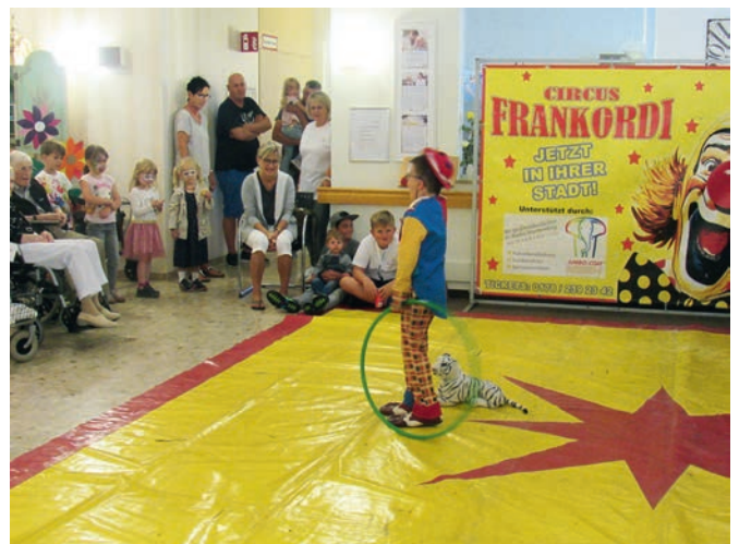
Senioren und Kinder verfolgten am Nachmittag aufmerksam den Auftritt des jugendlichen Clowns des Zirkus „Frankordi“.