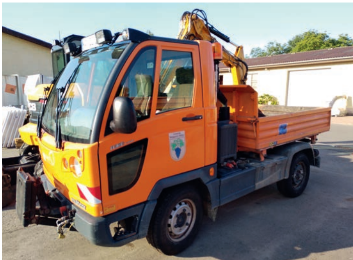
Diskussion um Ersatzbeschaffung für ein baugleiches, nur wenige Jahre alte Fahrzeug mit rund 5.000 Benutzungsstunden

Große Diskussionen gab es auch um die Beschaffung eines Kommunalfahrzeugs für ca. 130.000 € (!) .