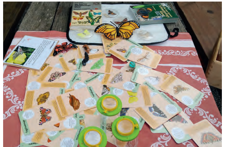
Die Gaukler = Schmetterlinge war eine von vier Stationen.

Mädchen erkannte auf der Blumenwiese nahe dem Friedhof einen Nachtfalter, der sich ganz am Fuße eines Halmes versteckt hielt. Vorsichtig, um die zarten Flügel nicht zu beschädigen, hielt sie eine Becherlupe über das Tier und ließ es aufliegen, so dass sie den Becher schließen konnte. Mit Hilfe des Bestimmungskartensets an der Gauklerstation konnte sie ihn als Augen-Eulenspinner bestimmen und war ganz stolz darauf die Natur so nah erfassen und begreifen zu können. Andere Kinder kamen mit Raps-Weisslingen im Fangnetz, diese waren zu zweit so abgelenkt gewesen, dass sie sich erhaschen ließen. Ein Junge ließ sich Zeit und fing eine Grille, was die anderen Kinder schwer beeindruckte. Auch Streifenwanzen und viele verschiedene Hummeln ließen sich von den Blüten um den Turm leicht fangen. Nachdem alle Funde den anderen Kindern gezeigt wurden, wurden die Tiere natürlich wieder freigelassen. Mit Spielen zum Thema wie einer Spinnenschaukel zum Hängen und Schwingen oder einem Spinnen-Netz aus Seilen mit Glöckchen, das nicht berührt werden durfte oder einem Bewegungsspiel, bei dem auf ein bestimmtes Kommando schnell ein Tuch, was eine Blüte symbolisierte, erreicht werden musste, sowie einem Besuch des Wartturmes wurde der Vormittag beendet.