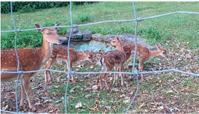
Nachwuchs im „oberen Vogelpark“

Der „obere Vogelpark“ hat Nachwuchs im Damwildgehege bekommen. Drei kleine Kälbchen sind in den letzten Wochen dort zur Welt gekommen. Neugierig erkunden sie bereits ihr Gehege und freuen sich über Besuch. Noch etwas scheu kommen sie bis ganz dicht an den Zaun und lassen sich gerne füttern. Aber es gibt noch mehr zu entdecken im Vogelpark. Zahlreiche Vogelarten wie Wellen- und Nymphensittiche, Fasane aber auch Ziegen und noch viele weitere Tiere können dort bestaunt werden. Und während die Kids sich am neuen Klettergerüst mit Rutschbahn austoben, können die Erwachsenen auf der Chalet-Terrasse bei südtiroler Spezialitäten und einem herrlichen Blick auf die Weingartner Weinberge wunderbar relaxen. Kommt doch mal vorbei. Die Tiere und das Vogelparkteam würden sich freuen.