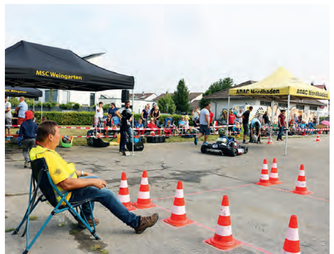
Viele Eltern begleiten ihre Sprösslinge zu den einzelnen Rennen im Jugend-Kart-Slalom. Der letzte Lauf dieser Saison fand am Wochenende in Weingarten statt.