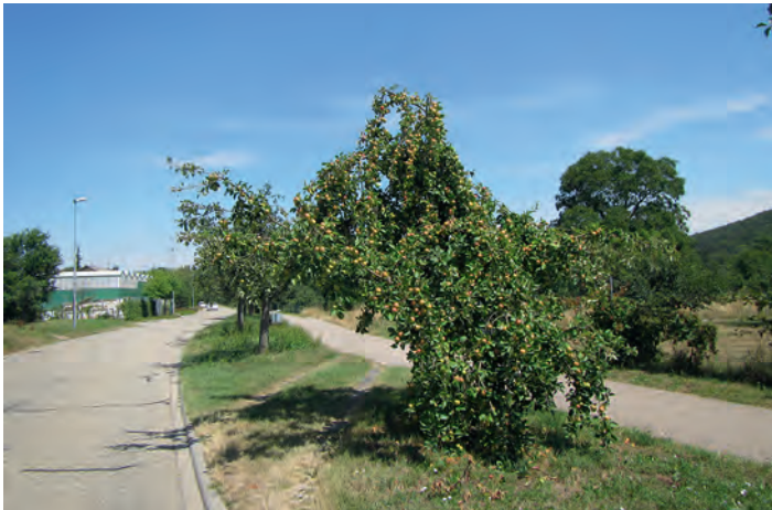
Bei zunehmendem Fruchtgewicht drohen bei diesem Apfelbaum Astabbrüche

Weitere Informationen gibt es beim Landratsamt Karlsruhe, per E-Mail unter naturschutz@landratsamt-karlsruhe.de oder telefonisch unter 0721/936-86710.