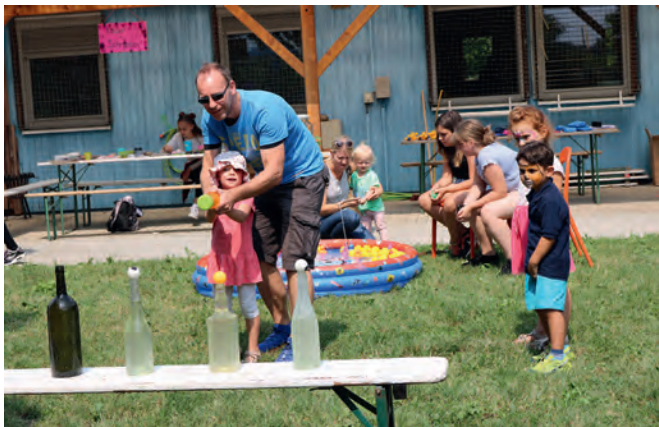
Beim Schießen mit der Wasserpistole auf einen Tischtennisball durfte auch der Papa mithelfen

Zum wiederholten Mal hat das „Fest der Generationen“, das die AWO seit Jahren als Sommerfest veranstaltet, seinem Namen alle Ehre gemacht.