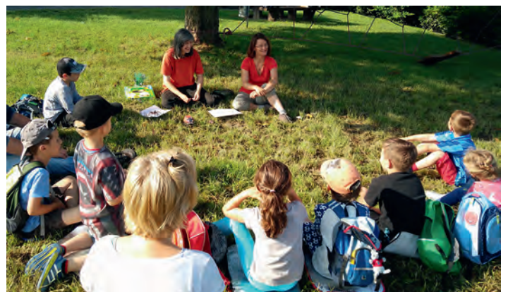
Einführung in die Welt der Insekten und Spinnen