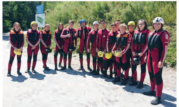
Die Ruhe vor dem Sturm.