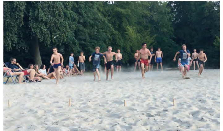
Beachflag auf dem Volleyballfeld