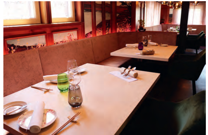
In völlig neuem Outfit präsentiert sich das bisherige „Gourmet-Restaurant“ im Walk'schen Haus. Es trägt jetzt den Namen „Zeit-Geist“.

Gereicht werden Kleinigkeiten, eher klein im Volumen aber groß im Geschmack.