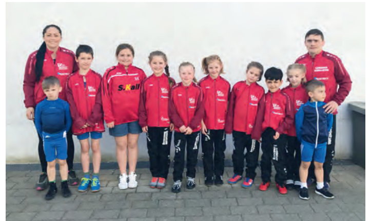
Der SVG-Nachwuchs vor der Abfahrt nach Brötzingen

Letztendlich konnten all unsere neun Anfangsringer nach einem anstrengenden Turnier mit einer Medaille oder einer Urkunde müde aber glücklich nachhause fahren. Folgende Platzierungen belegten unserer tapferen Ringer: