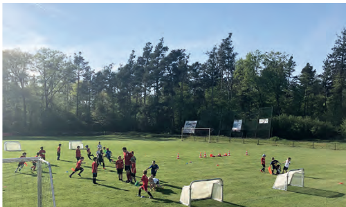
Die F-Junioren UND unsere Trainer lernen dazu