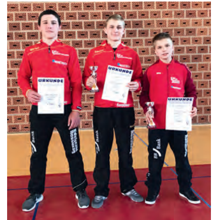
Die Teilnehmer des SVG in Fahrenbach

Konnten sie es doch kaum erwarten, dass endlich die ersten Kämpfe starteten.