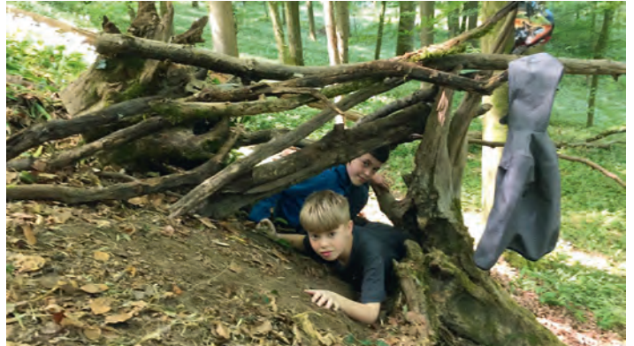
AGNUS-Jugend Wildnisgruppe - Höhle mit Einlass

berücksichtigen muss - ging es los. Unser ureigenster Feldbrand wurde gestartet und brannte bis in die Tunnelkatakomben hinein. Was für ein Erfolg!