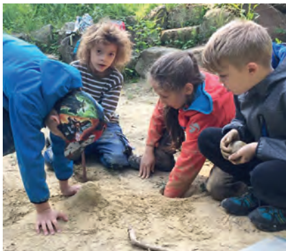
AGNUS-Jugend Wildnisgruppe - Feldbrand

Am Samstag, den 05. Mai 2018, war die AGNUS-Jugend-Wildnisgruppe wieder im Wald. Jetzt, da wir unsere gebrannten Kunstwerke aus Ton in der Hand hielten, um sie farbig zu gestalten, fiel es uns auf: Wir stehen auf Tonerde! Natürlich gab es nun kein Halten mehr für vielfältige Experimente. Die einen mischten an, formten und kneteten. Die anderen gruben Tunnel,