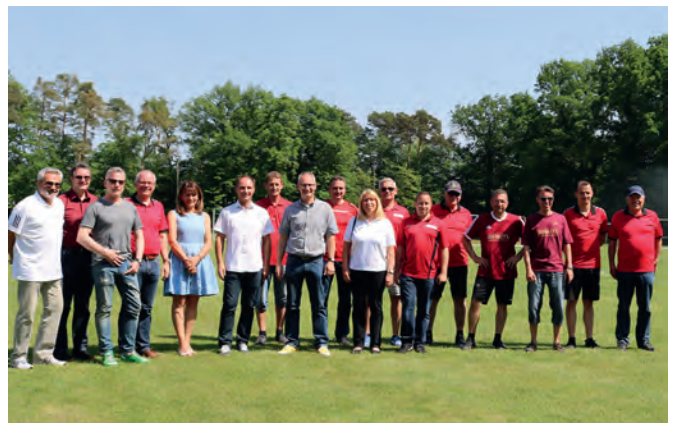
Spender, Vertreter der Bank und Funktionäre des Vereins feierten gemeinsam die Übergabe der Platzbewässerungsanlage

So sei eine optimale Rasenpflege garantiert. Das Projekt komme 250 aktiven Fußballern, darunter 200 Jugendlichen, zugute, denn die bisherige Form der Bewässerung per Schlauch sei ehrenamtlich nicht mehr zu stemmen gewesen. Bürgermeister Eric Bänziger nannte es eine zukunftsweisende Idee, den Rasenplatz maschinell bewässern zu lassen, um dadurch das Ehrenamt zu entlasten und dadurch Kräfte freizusetzen. Die Leistung der Vereine sei ein immens wichtiger Baustein im Sozialgefüge einer Gemeinde, denn dadurch werden Jugendliche an eine Gemeinschaft