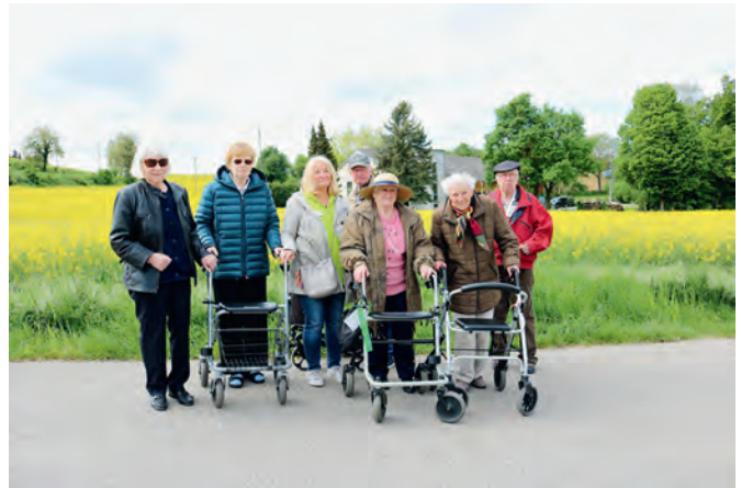
Auch eine Seniorengruppe aus „Haus Edelberg“ hatte einen Ausflug unternommen