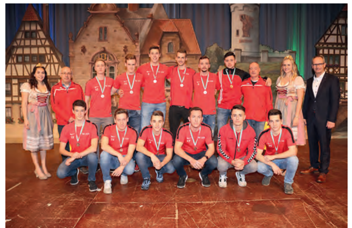
Unsere ausgezeichneten A-Junioren

11.30 Uhr: B2-Jugend FC Südsterne Karlsruhe 3 - SG Wgt/Bla