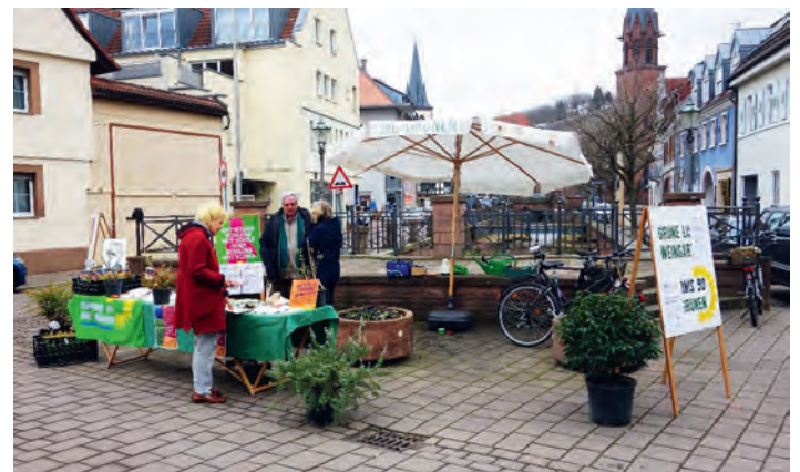
Geplanter Infostand blühende Gärten & blühende Landschaften am 14.04.2018