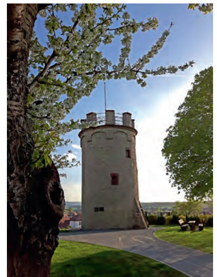
Frühling am Wartturm: Er ist eines der markanten Weingartener Wahrzeichen. Am Ostersonntag öffnet das „Museum im Turm“ wieder seine Pforten.

im Norden die Kühltürme des Kernkraftwerks in Philippsburg, die Türme des Kaiserdoms zu Speyer sowie im Westen die Berge der