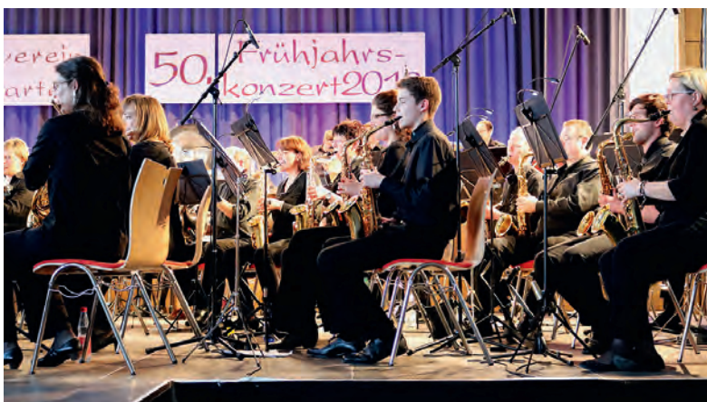
In einem gemeinsam gespielten Stück von Bläserchester und Jugendorchester demonstriert der Verein eine motivierende Nachwuchsarbeit

Vom zartesten Pianissimo einer einzelnen Flöte bis zum Fortissimo des gesamten Bläserorchesters einschließlich Schlagzeug war im 50. Frühjahrskonzert des Musikvereins Weingarten ein High-