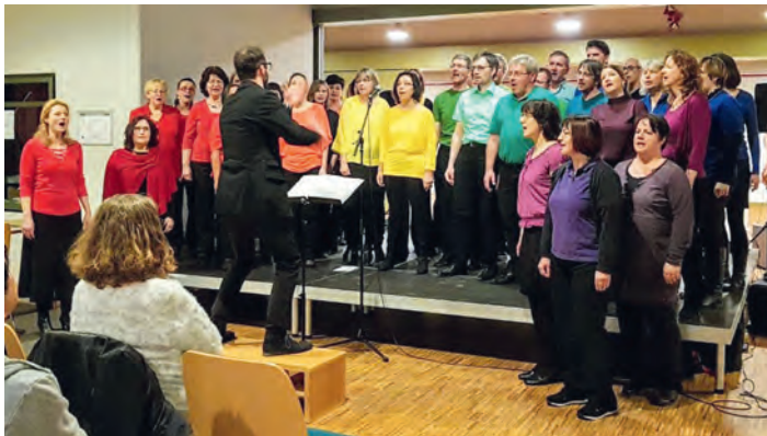
Die Swinging Voices im Altenbürgzentrum

Vom 15. bis 18. März veranstaltete der Kunst Kreis Karlsruhe in der Altenbürghalle in Karlsdorf Neuthard seine große Jahresausstellung unter dem Titel „Brücken bauen“ mit einem reichhaltigen Rahmenprogramm. Topact am Samstagabend war in diesem Jahr ein Konzert der Swinging Voices. Die Brücke, die sie beisteuerten, war der Regenbogen als Brücke vom Land der Vernunft in das Land von Phantasie und Kunst. Dies machte der Chor auch optisch mit entsprechender Kleidung deutlich. Die Stücke waren so angeordnet, dass ihr Inhalt der symbolischen Bedeutung der Farben des Regenbogens entsprach. Auf dem Programm standen Lieder von Liebe und Zorn, Lebensfreude und Eifersucht, Hoffnung, und Begeisterung. Den Abschluss bildeten dann mit „Boulevard of broken Dreams“ von Green Day und „The Sound of Silence“ von Simon und Garfunkel kritische und nachdenkliche Töne sowie das katalanische Wiegenlied „Canco des bres“, das sich seit dem Besuch unserer spanischen Freunde aus Abrera auch bei den Swinging Voices großer Beliebtheit erfreut.