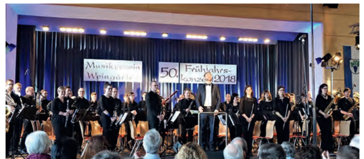
Stimmungsvolles Frühjahrskonzert in der Walzbachhalle

Ein großer Dank gilt auch den Notenspendern, die es uns ermöglichen, ein solch abwechslungsreiches Programm auf die Bühne zu bringen. Danke sagen möchten wir auch den vielen freiwilligen Helfern, die Schilder aufgestellt, den Imbiss vorbereitet, den Abwasch erledigt, Speisen und Getränke verkauft, die Stühle und Tische auf- und wieder abgebaut haben. Durch Euren Einsatz konnten wir als Musiker uns entspannt der Musik widmen. Wir danken nicht zuletzt für den zahlreichen Besuch des Konzertes und für den Applaus - wir haben uns sehr darüber gefreut! Wir hoffen, Ihnen hat das Konzert so viel Freude bereitet wie uns und Sie werden im nächsten Jahr wieder unsere Gäste sein.