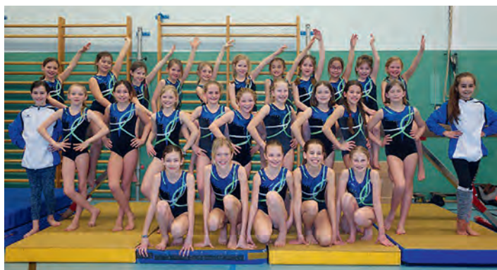
Unsere jungen Turnerinnen bei den „Bestenkämpfen“

Unsere Mädels hatten einen super Wettkampf geturnt - Herzlichen Glückwunsch an alle!