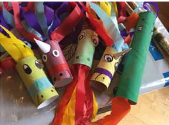
Drachen und Einhörner der AGNUS-Jugend-Kinder aus der Winterwerkstatt

Auf Feldern und Wiesen, öffentlichen Flächen und in Gärten blüht es immer weniger. Wir ändern das. Helfen Sie mit! Unsere Kulturlandschaft soll wieder blühen - auch für uns Menschen!“ Passend wird es am 04. und 25. März vormittags zwei Infostände in der Nähe vom Füllhorn geben. Die AGNUS-Jugend bringt sich mit einem Infostand bei der Vortragsveranstaltung und einem Beratungsangebot für Kindergärten zur bienengerechten Geländegestaltung ein. Nutzt die Chance Euch vor Beginn der Pflanzzeit zu informieren.