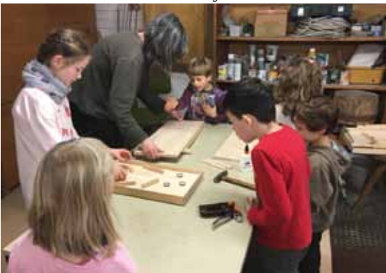
AGNUS-Jugend-Kinder in der Winterwerkstatt beim Flipper bauen