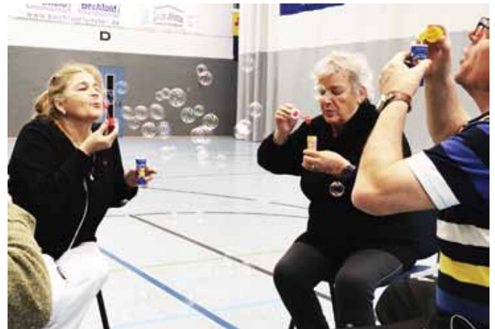
Atemtraining im Lungensport mit Seifenblasen