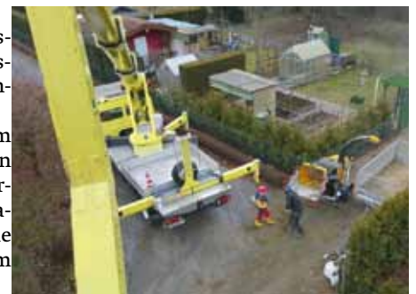
schweres Gerät im Kleingartenverein

Wer Interesse an einem Kleingarten hat, kann sich gern an den Vorstand wenden. Informationen dazu finden sie in den Schaukästen im Vereinsgelände.