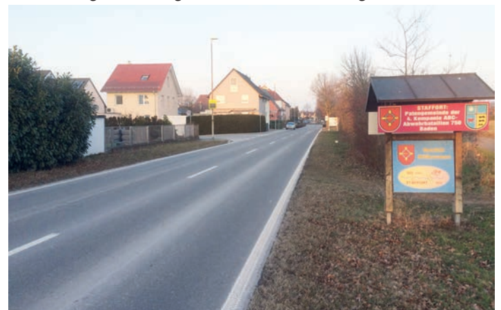
Ortseinfahrt Staffort Richtung Weingarten

Aus diesem Grund setzt sich die Junge Union Stutensee-Weingarten direkt für eine Gefahren- und Geschwindigkeitsreduzierung ein. In Kürze wird es deshalb eine weitere Ortsbegehung geben, den Termin werden wir zeitnah veröffentlichen und laden die Bevölkerung der Ortschaften und andere Interessierte schon jetzt ein, uns dabei zu begleiten. Junge Union Stutensee-Weingarten