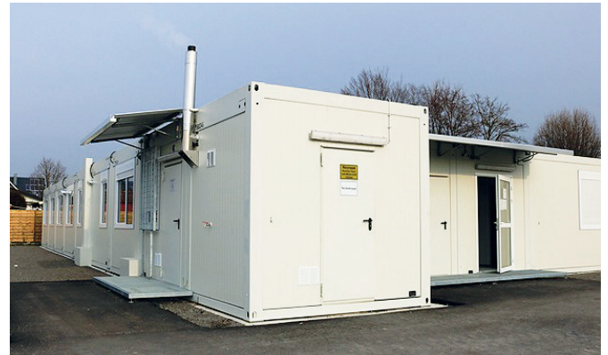
Außenansicht von einem der beiden Gebäudekomplexe

Die Gemeinschaftsunterkunft in der Dörnigstraße soll im Lauf des Monats mit 40 Personen belegt werden. Wie Bürgermeister Eric Bänziger bereits in einer vorangegangenen Sitzung des Gemeinderates berichtet hatte, kommen die Personen aus einer Unterkunft in Rheinstetten, die geschlossen wird. Bevor die Neuankömmlinge in Weingarten eintreffen werden, bestand am Freitagnachmittag für zwei Stunden Gelegenheit für die interessierte Bevölkerung, einen Blick ins Innere der Containersiedlung zu werfen. Das Interesse war offensichtlich verhalten. „Ganz anders als beim Winkelpfad“ bilanzierte Hauptamtsleiter Oliver Russel. „Das zeigt, dass jetzt mit dem Thema wesentlich entspannter umgegangen wird als seinerzeit.“ Auch Bürgermeister Eric Bänziger sah die Entwicklung zufrieden. „Wir haben richtig reagiert“, sagte er. „Wir stellen den Leuten helle und freundliche Wohnungen zur Verfügung und sie werden betreut“. Am Dörnig stehen dieselbe Anzahl von Containern wie am Winkelpfad, aber nicht übereinander, sondern in zwei Komplexen. Neben den Privaträumen, die mit Betten, Spinden, Tisch und Stühlen sowie einem Kühlschrank ausgestattet und separat abschließbar sind, stehen Sanitäräume, ein Schulungsraum, ein Büro und eine Küche pro Komplex zur Verfügung. Hier können jeweils drei Familien zur sel-