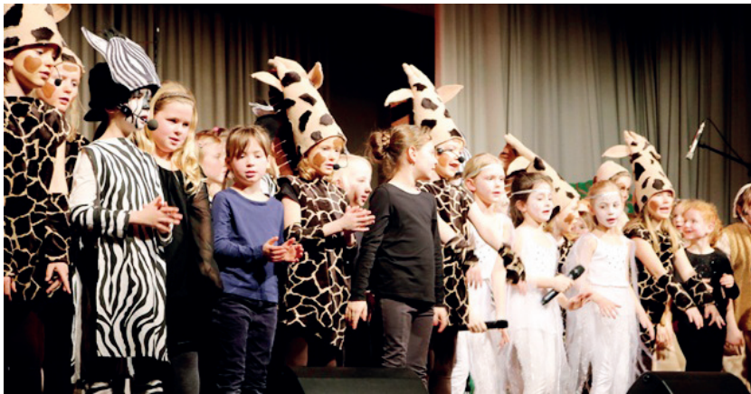
Foto: So viele Chorkinder wie nie zuvor hatten am Musical „Tuishi pamoja“ mitgearbeitet, das von Vorurteilen und Freundschaft handelt.