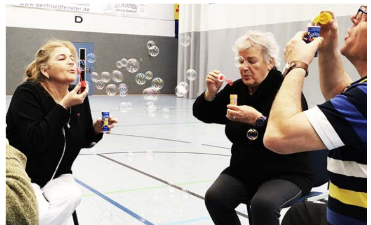
Atemtraining im Lungensport mit Seifenblasen