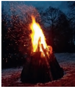
Das Feuer weist dem Nikolaus den Weg über den See

Genau rechtzeitig zur Nikolausfeier verwandelte das kurze Schneeeinter- mezzo die Landschaft in eine winte- rliche Kulisse. Das Feuer am Ufer wärmte die gespannt wartenden Gä- ste, heiße Getränke, das mitgebrachte Gebäck und angeregte Gespräche ver- kürzten die Wartezeit. Der Nikolaus kam dann bei Anbruch der Dunkel- heit mit dem Angelnachen über den See gefahren und verteilte seine Ga- ben an die Kinder. Die Nikolausfeier 2017 war wieder eine stimmungsvolle Veranstaltung für Groß und Klein.