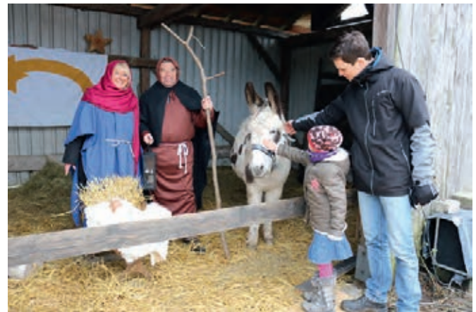
Die Heilige Familie im Stall von „MuTiG“ findet immer wieder viel Anklang bei den Besuchern.