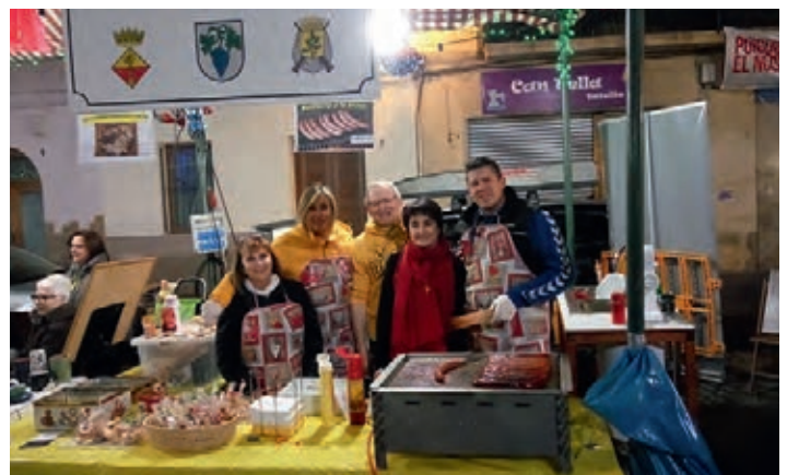
Partnerschaftsstand, Besuch der Bürgermeisterin Pilar Puimedon