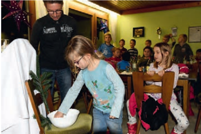
Unsere Losfee zieht die Gewinner

Auf der Weihnachtsfeier der E1-Jugend fand die Verlosung der fünf Pizaessen statt, die in unserem Crowdfunding-Projekt als Dankeschön wählbar waren. Die glücklichen Gewinner werden schriftlich benachrichtigt und können es sich in unserer Vereinsgaststätte bei Graziano schmecken lassen.