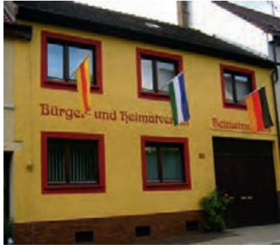
Das Heimatmuseum in der Durlacher Straße ist von Heiligabend bis zum Feiertag Dreikönig, 6. Januar, geschlossen.