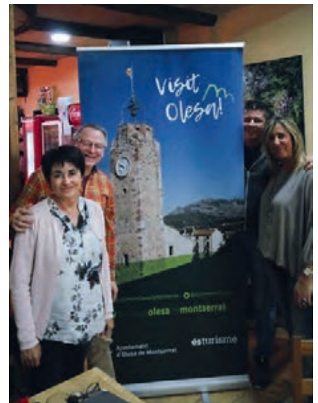
Übergabe des neuen Werbebanners an die PK-Vorsitzenden von Weingarten

Das Komitee Olesas, das Bürgermeisteramt und das Team vom Bauhof unterstützten uns im Vorfeld und am Tag selbst nach besten Kräften. Neben unzähligen Freunden und Bekannten, die unseren Stand besuchten, konnten wir mit dieser Aktion auch viele, über die Partnerschaftsbeziehungen „unwissenden Olesaner“, über die nunmehr 33 Jahre währende Partnerschaft informieren und mitunter begeistern. Dazu trugen auch die zwei neu kreierten Werbebanner der Gemein-