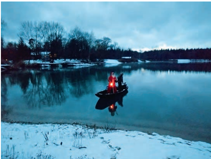
Der Nikolaus kommt mit dem Angelnachen