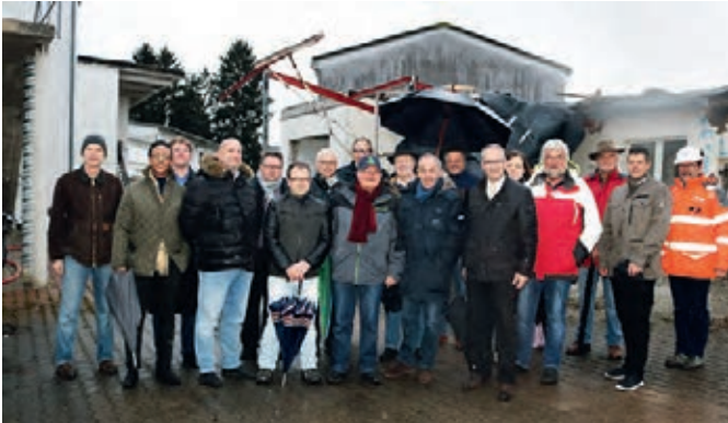
Bürgermeister Bänziger ließ es sich nicht nehmen, eigenhändig die ersten Abbrucharbeiten mit der schweren Betonschere vorzunehmen

bruchkonzept mit dem Landratsamt Karlsruhe abgestimmt. Bis Ende Februar wird der Abbruch vermutlich abgeschlossen sein.