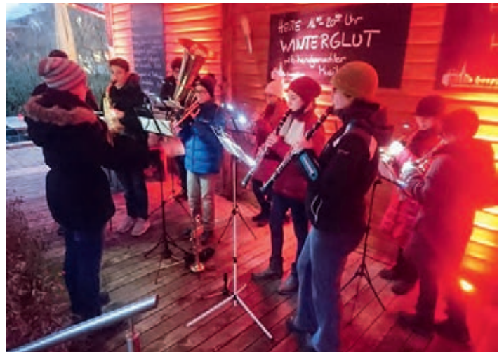
Das Jugendorchester bei der Winterglut im Backhaus.

Zum Probenabschluss machte sich vergangenen Sonntag unser Jugendorchester auf eine Wanderung zum Backhaus Sallenbusch. Dort wurden dann zur Freude der Zuhörer einige Weihnachtslieder intoniert. Zum Abschluss gab es dann in gemütlicher Runde eine Stärkung mit leckerer Bratwurst und warmen Getränken.