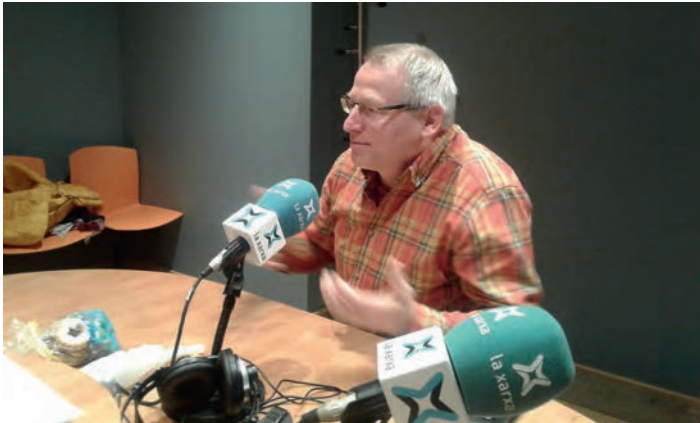
Radiointerview mit PK Präsident Siggí Kolar in katalanischer Sprache

Neben den Weihnachtsmarktaktivitäten nahmen Vertreter beider Komitees noch einen offiziellen Termin beim örtlichen Radiosender «Radio Olesa» wahr. In dem ca. 20 minütigen Interview von Radio Olesa, das auch im Internet auf Podcast unter http://www.olesademontserrat.cat/olesaradio/ca/pl11/radio-a-la-carta/id8000/hotel-gori-15122017-visita-comite-weingarten-nachzuhoren ist, konnte Werbung für den Weihnachtsmarkt und die Städtepartnerschaft gemacht werden. Die Herausforderung bestand darin, dass das komplette Gespräch ohne Dolmetscher in katalanischer Sprache live durchgeführt wurde.