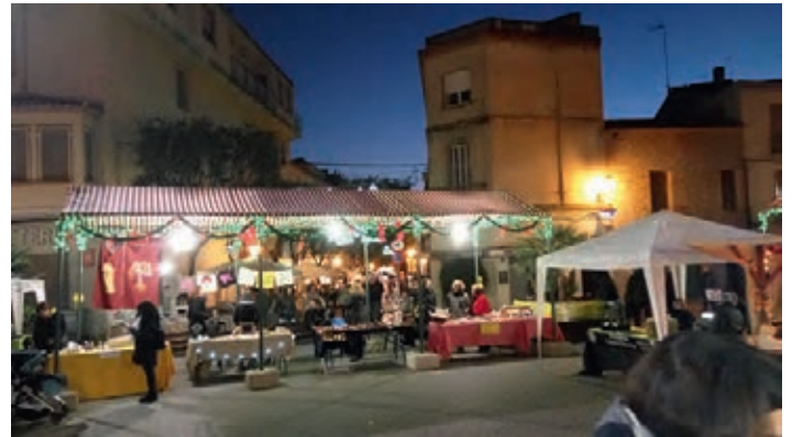
Impressionen der Weihnachtsmesse Olesa de Montserrat

Über fünfzig verschiedene Vereine und Organisationen luden zum vorweihnachtlichen Verweilen in der historischen Altstadt Olesas ein. Neben einem Kunsthandwerkermarkt und verschiedenen Musik- und Gesangseinlagen gab es eine vielfältige Auswahl typisch katalanischer Spezialitäten, beispielsweise Olivenöl, Serano-Schinken oder den Aperitif „Vermut“. Am Weingartener Partnerschaftsstand gab es dagegen badische Köstlichkeiten.