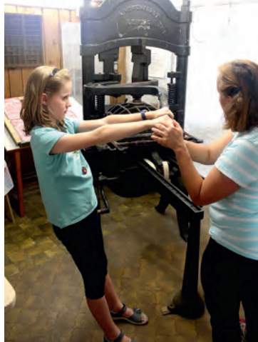
Das Drucken mit der historischen Kniehebelpresse aus dem Nachlass des Grafikers Erwin Koch ist eine Attraktion beim Museumsfest des Bürger- und Heimatvereins.

Nach der Eröffnung von Sonderausstellungen zu verschiedenen Themen steht heuer die historische Kniehebelpresse des Grafikers Erwin Koch, die dessen Sohn Klaus dem Verein