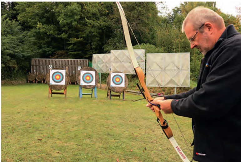
Pfeil einlegen, spannen, zielen, loslassen - und treffen! Auch Bogenschießen war beim Preisschießen angeboten.

Schützenverein freut sich über regen Zulauf