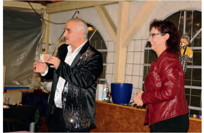
Einen Zehn-Euro-Schein verschwinden und ganz woanders wieder auftauchen lassen, war nur einer der spektakulären Tricks in „Armins und Susannes Zaubercocktail“.

Absoluter Höhepunkt: ein soeben für alle sichtbar von einer Dame signierter Zehn-Euro-Schein verschwand spurlos - und steckte in einer frisch aufgeschnittenen Kartoffel. Beifall, Lachen, Staunen!