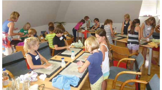
Volle Konzentration war gefordert, damit aus Wolle und Seife farbenfrohe Windlichter entstanden.