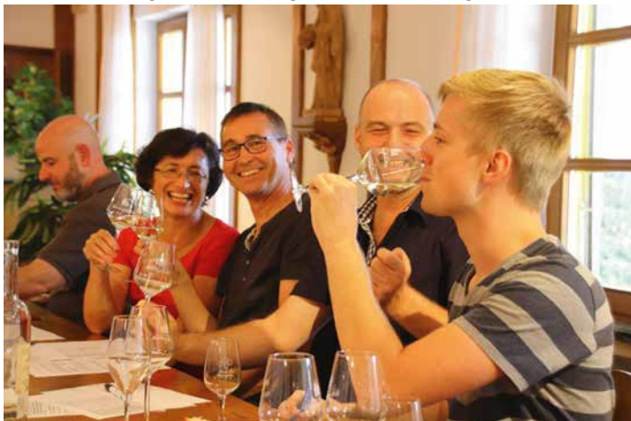
Feuchtfrohliche Vorbereitung auf den Weinwandertag

Wie in jedem Jahr können Sie beim Weinwandertag an mehreren Ständen in den Weinbergen verschiedene Weine der Weinmanufaktur Weingarten probieren. Auf eigene Faust oder geführt von Winzern und Weinexperten wandern Gruppen über den Katzenberg und den Kirchberg, wo jeweils an zwei Probiertischen der Wein der dortigen Reben vorgestellt wird. Die geführten Touren