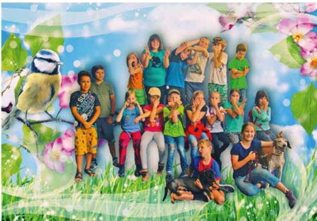
Viel Spaß hatten die Kids beim Ferienspaß im oberen Vogelpark

Ja uns hat es großen Spaß gemacht und wenn ihr wollt kommt mal wieder im Park vorbei und besucht uns. Die Tiere und wir würden sich riesig freuen.