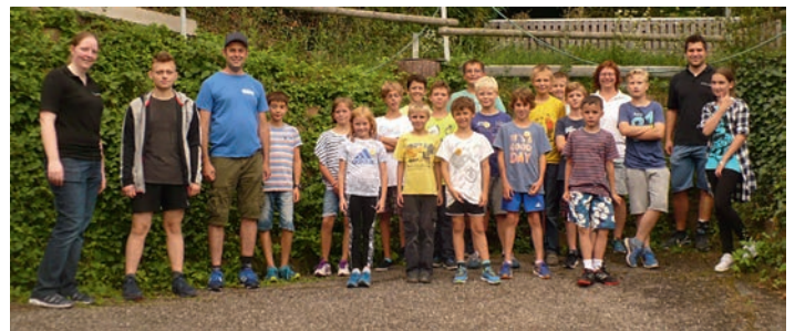
Ferienstpaß beim Schützenverein

Das Jugendleitererteam hatte sich dazu so einiges einfallen gelassen und so konnten die Kids an insgesamt fünf Stationen ihre Treffsicherheit testen. Bunte Luftballons galt es mit Dartpfeilen zu treffen, eine Dosenpyramide musste mit höchstens vier Würfeln fallen und mit sogenannten Nerf-Gewehren schoss man auf Holzstäbe. Doch die eigentlichen Highlights waren das Bogen- und das Lasergewehrschießen.