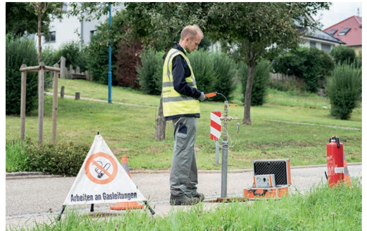
Aktuell werden THT-Messungen in den Regionen Nordbaden und Oberschwaben durchgeführt.

So können die Menschen in den Gemeinden auch bei Sommerwetter und heißen Temperaturen beruhigt die Seele baumeln lassen. Denn faule Eier würden selbst sonnengebräunte Nasen sofort bemerken.