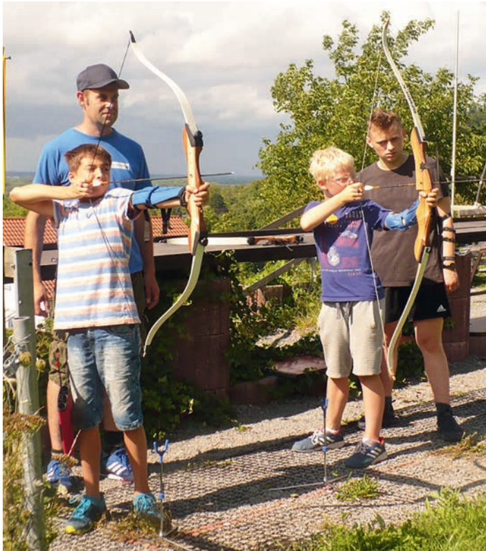
Bogenschießen eines der Highlights beim Ferienspaß.