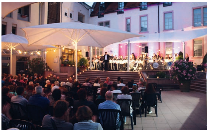
Impressionen vom Sommernachtskonzert 2013